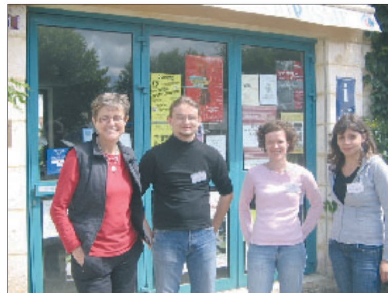
Une équipe très en forme pour un bel été