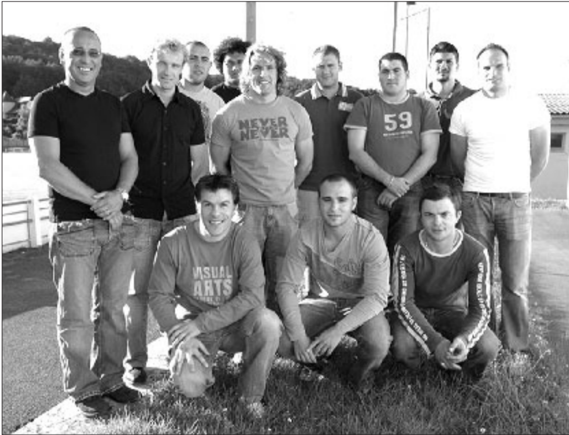
L'encadrement sportif et les recrues