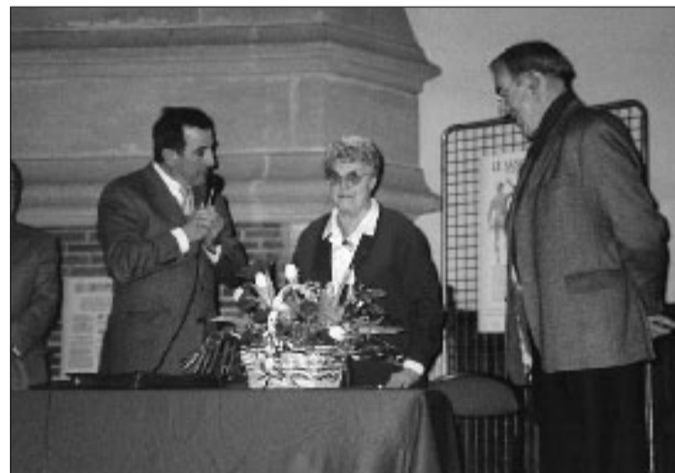
Hiver 2003, à l'ancien théâtre de Sarlat, remise de la médaille d'officier du mérite pour le don de sang

L'Amicale pour le don de sang bénévole du Sarladais est en deuil depuis la semaine dernière.