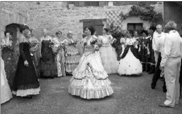
Dernier briefing avant le spectacle !

Dimanche 25 juin, l'association Les Amis de Maillac organisait son traditionnel thé dansant costumé.