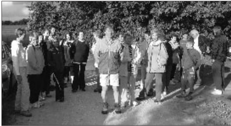
Prêts pour le départ