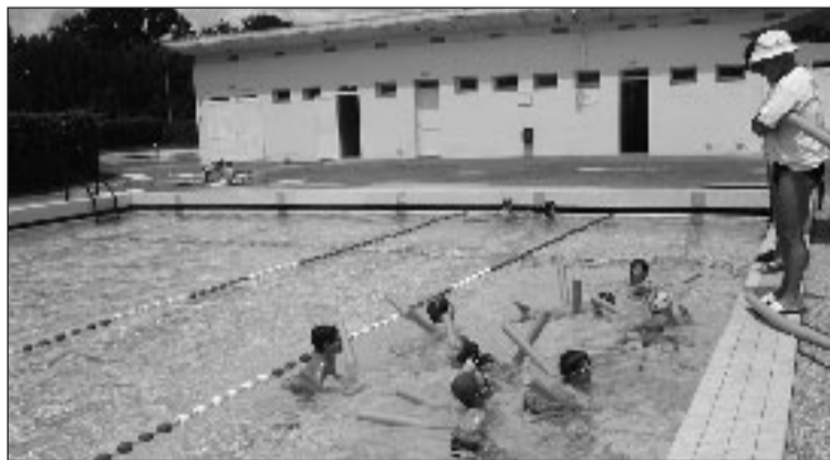
Pour les vacances, il faut savoir nager !