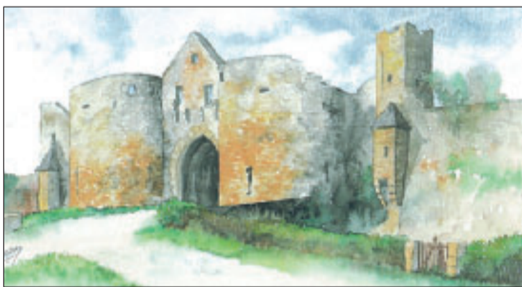
La porte des Tours à Domme