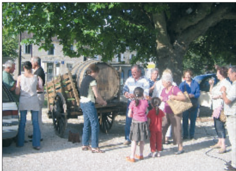
Conversations autour du barricou