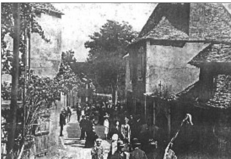
La rue principale. Début du XX e siècle