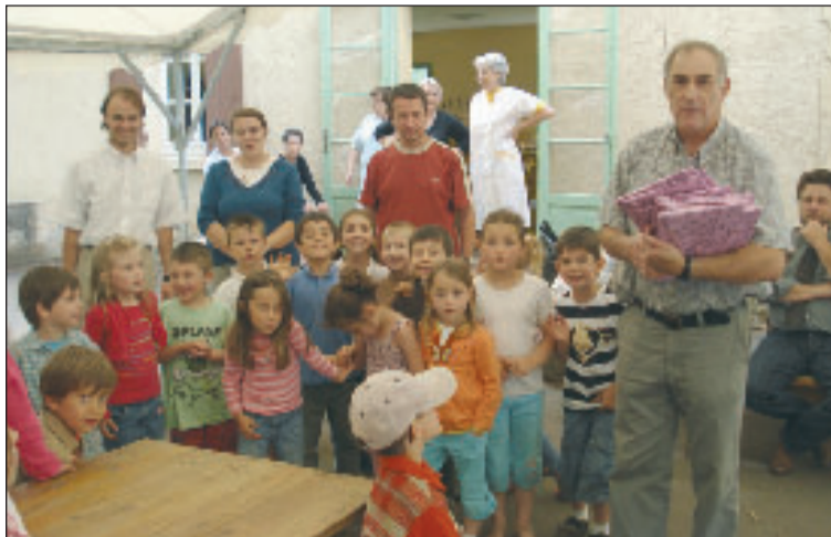
Les enfants du CP