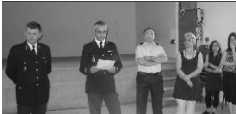
Les remerciements de l'adjudant en présence de ses supérieurs et de personnalités locales

En trois ans, il aura acquis l'estime des élus et de la population montignacoise et, par son savoir-faire, sa pugnacité, ses compétences, sa disponibilité, son sens du devoir, sa gentillesse, il aura porté haut les couleurs de la gendarmerie nationale.