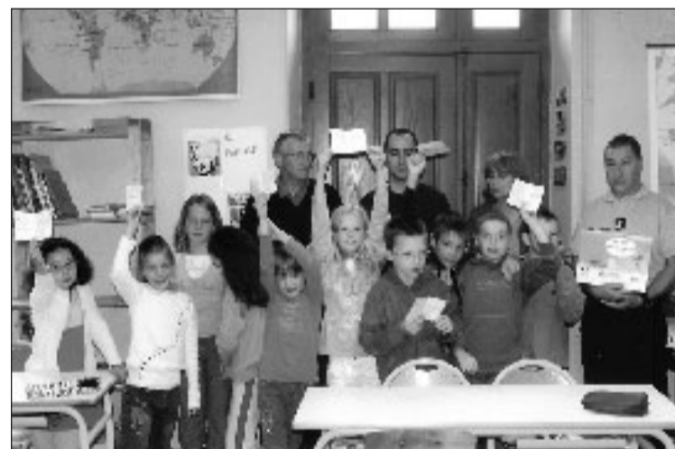
Les heureux récipiendaires