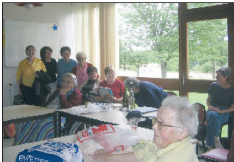
On se quitte avec regret