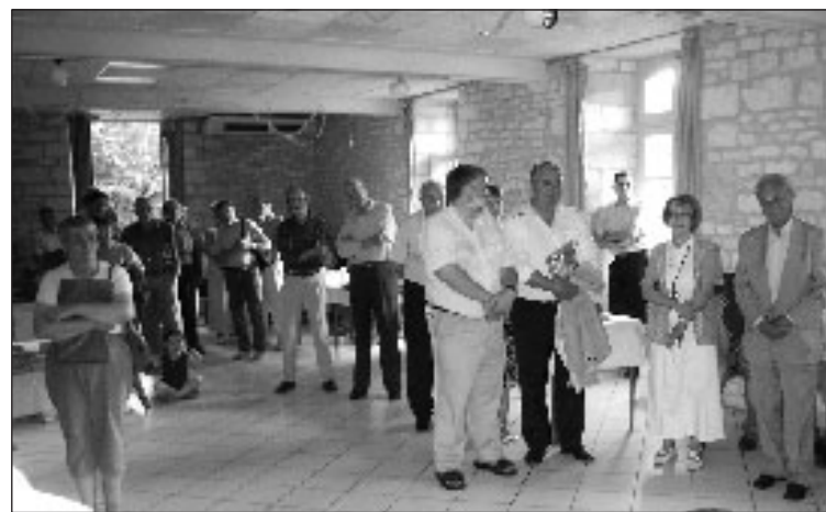
Dans la salle avec les personnalités