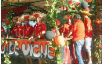
Le club de rugby organise sa traditionnelle bodEga le mardi 14 août