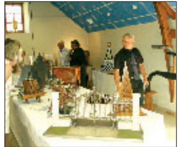
Transmettre et partager son savoir