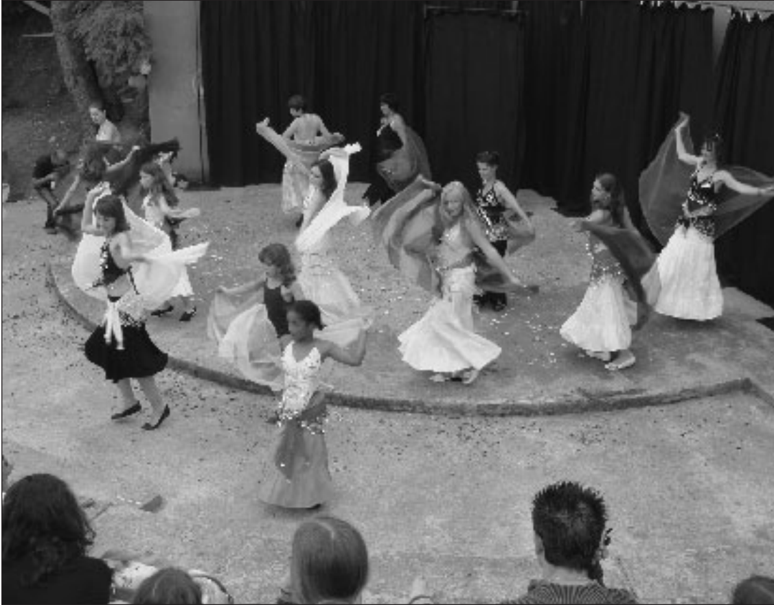
Spectacle dans l'amphithéâtre