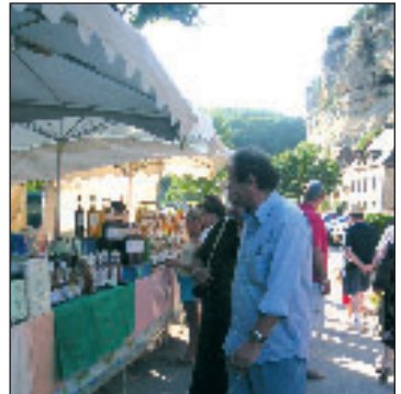
Le Marché des gourmets et des gourmands aura lieu les 18 et 19 août