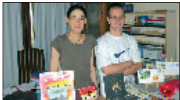
Une deuxième étoile pour l'Office de Tourisme