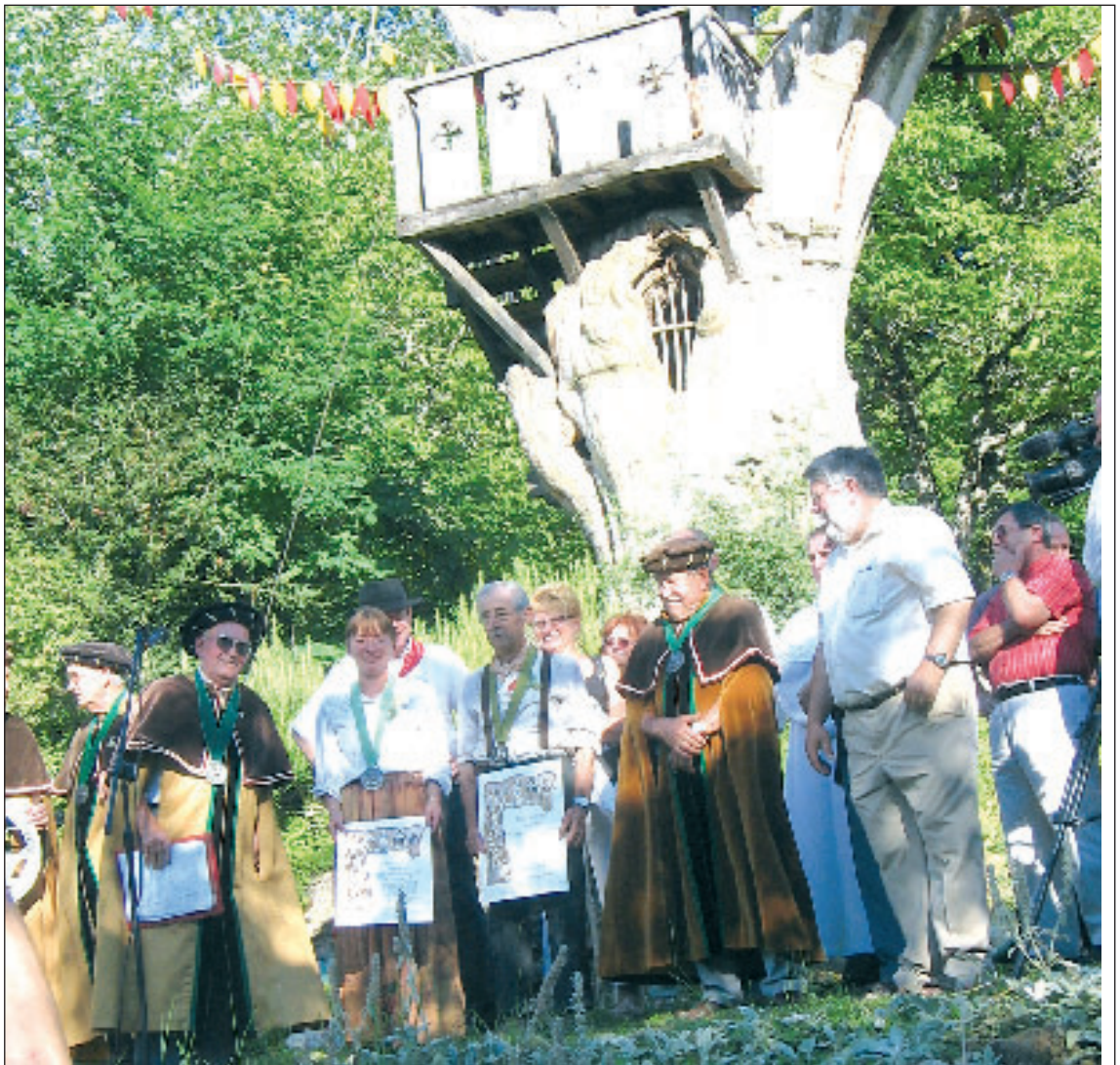
Les heureux intronisés et diplômés