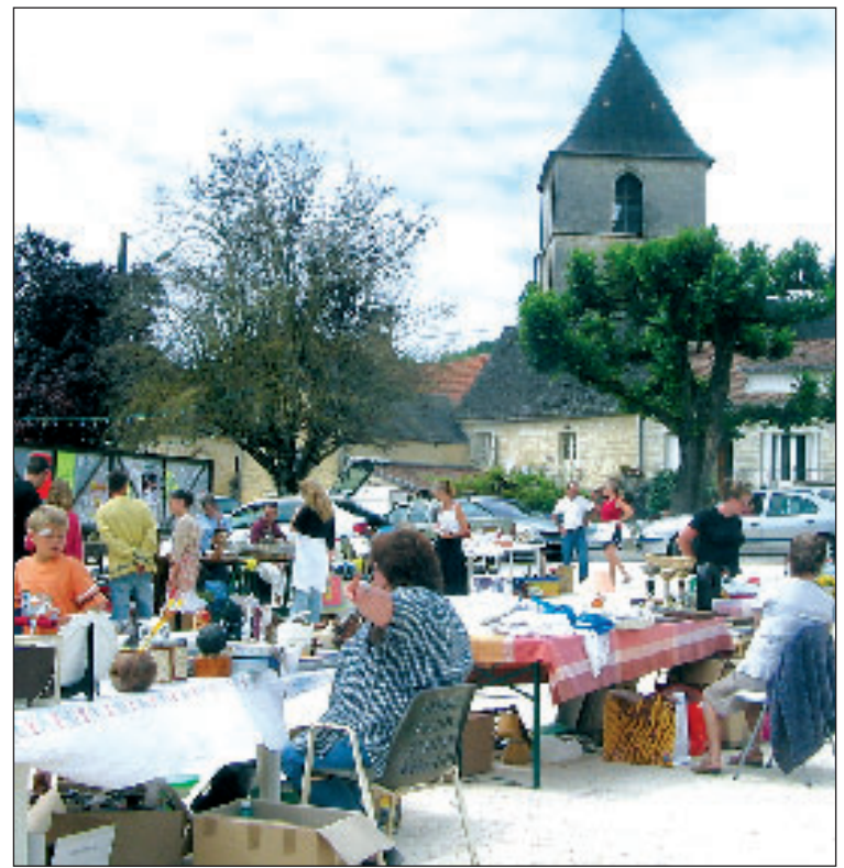
Une manifestation très appréciée