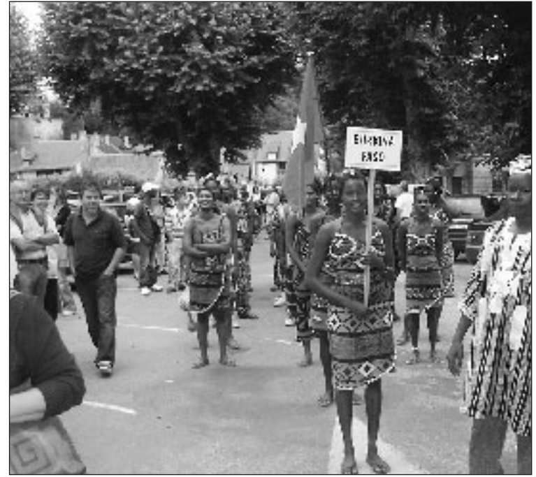
Le Burkina Faso