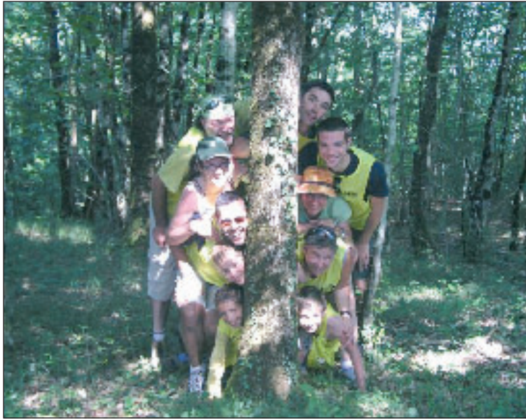
Après le VTT, le jeu de cache-cache