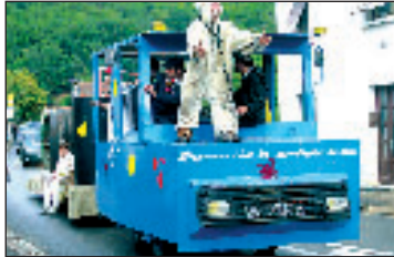
Les férias de Daglan les 17, 18, 19 et 20 août