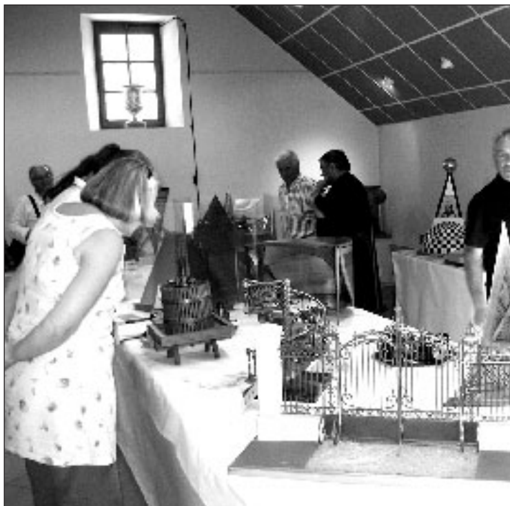
Une très belle exposition