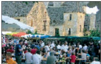
Le calendrier des animations estivales