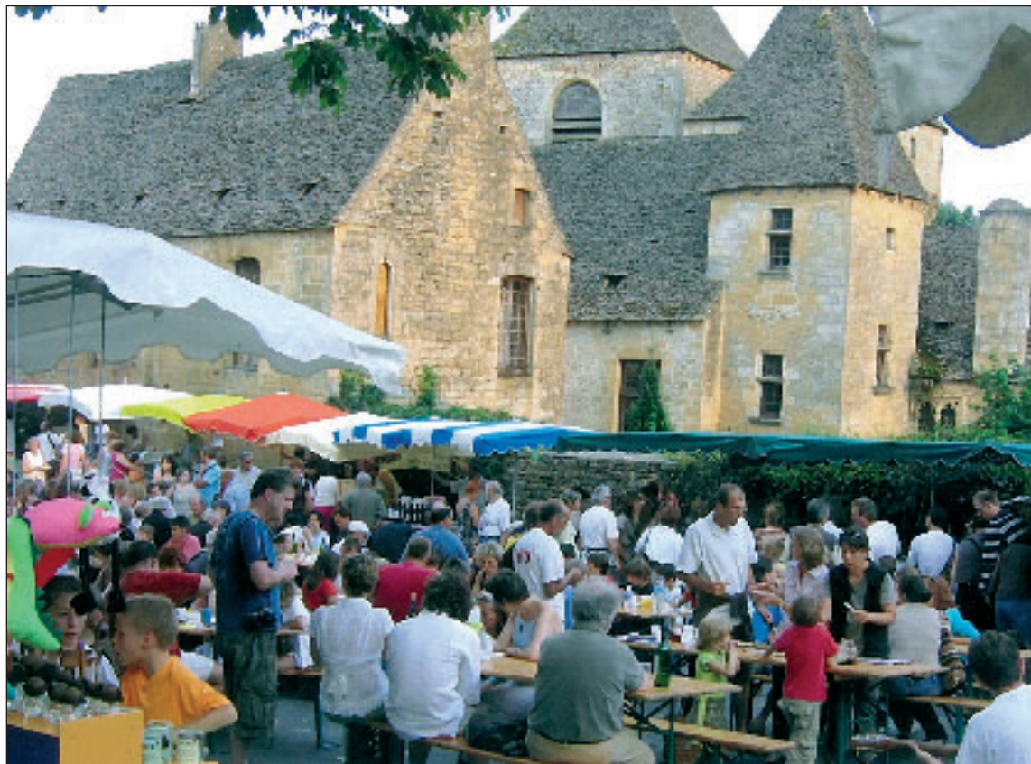
Un marché nocturne, un cadre...