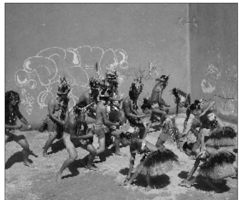
Le groupe Manahau dans une danse très frémissant