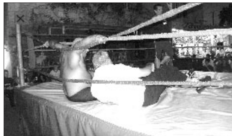
L'arbitre au tapis