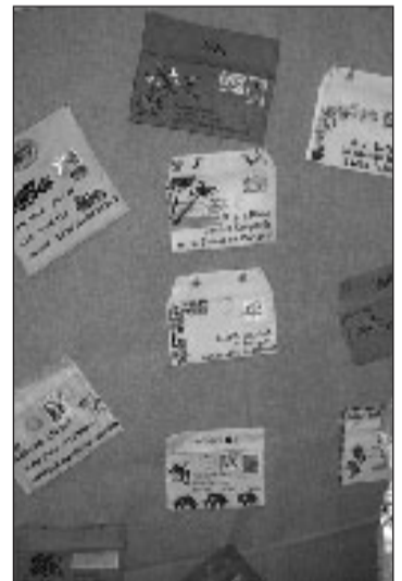
Les enveloppes au point de croix ont toujours autant de succès

Pour la troisième année consécutive, le club de point de croix de la commune, "le Fil de la Dordogne", organise son exposition à la mairie.