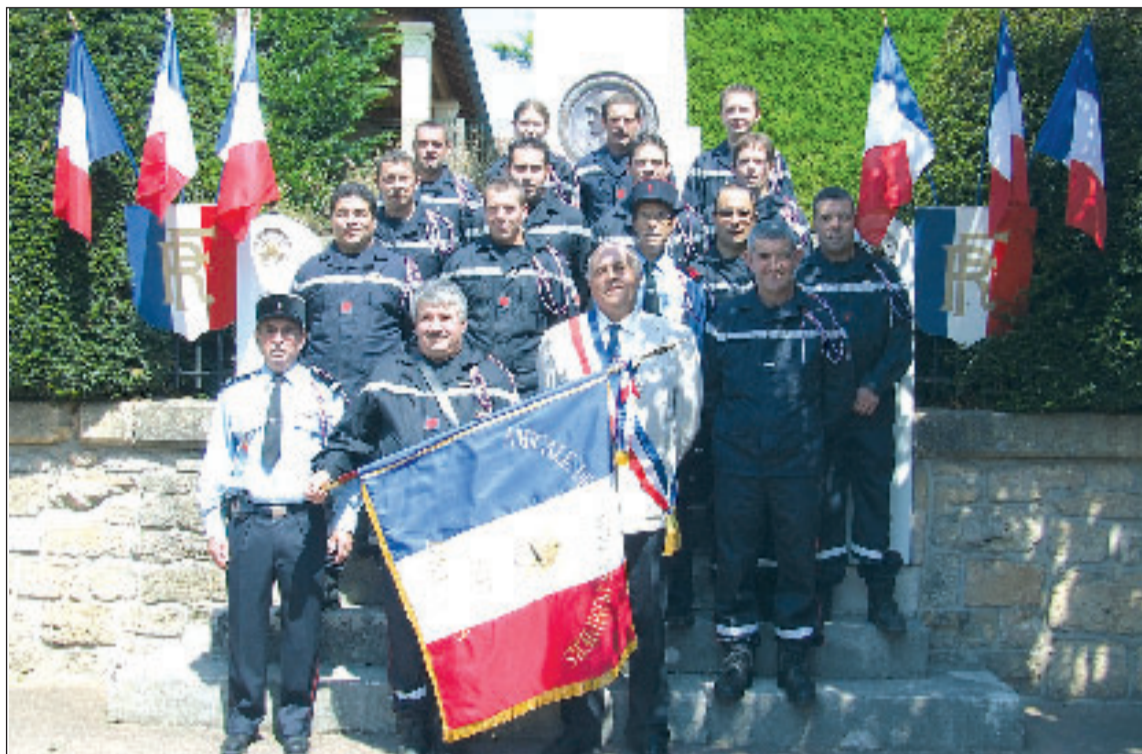
Les sapeurs-pompiers arborent un nouveau drapeau et continuent à rehausser de leur présence les cérémonies officielles

Il n'y avait pas eu de rassemblement pour la Sainte-Barbe en 2006, on nous prédisait alors une grande manifestation pour 2007 à l'occasion du soixantième anniversaire du centre de secours, ce fut vraiment une grande fête célébrée en juillet. Il n'y avait eu aucune cérémonie de cette ampleur depuis 1967, et il fallait bien les 800 m 2 du gymnase pour recevoir les nombreux invités.