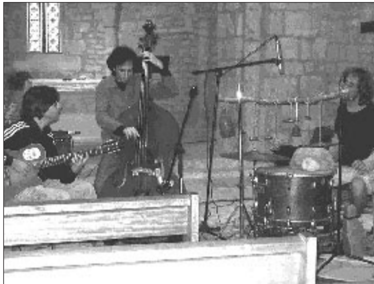
Le trio "O"

L'office était célébré pour les deux relais de Salignac et Saint-Geniès, et le cadre de verdure d'une grande beauté ne pouvait que contribuer à la ferveur de la cérémonie.