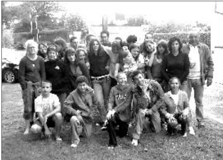
La sélection des Dauphins pour les Aquitaines

Après les épreuves départementales, durant lesquelles de nombreux nageurs se sont distingués, ce furent les épreuves régionales, dites les Aquitaines.