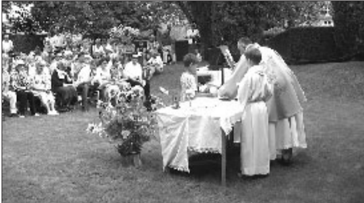
Un paysage qui invite au recueillement