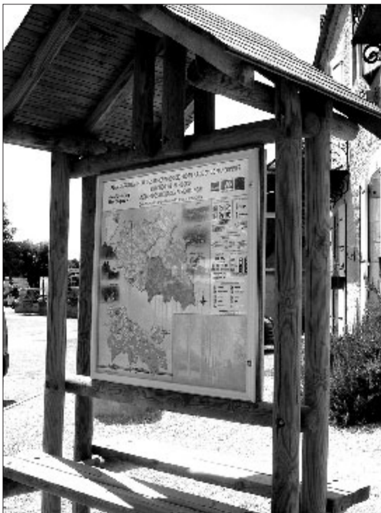
Un exemple de panneautage