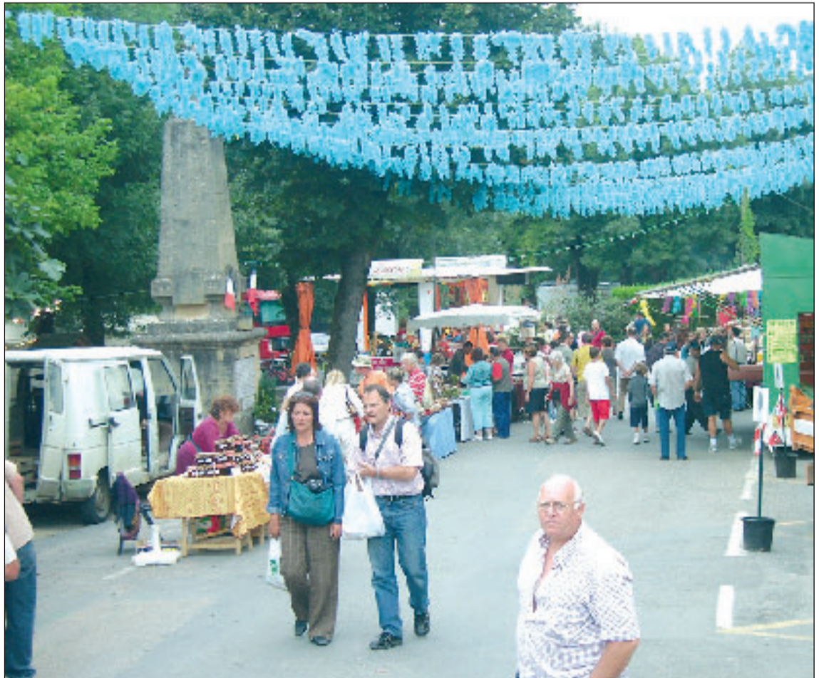
Une vue de la manifestation