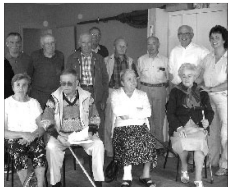
Un groupe de narrateurs