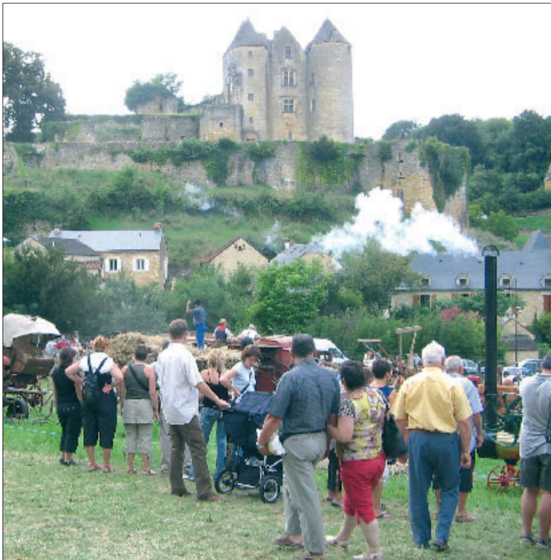
Moisson et battages au pied du château