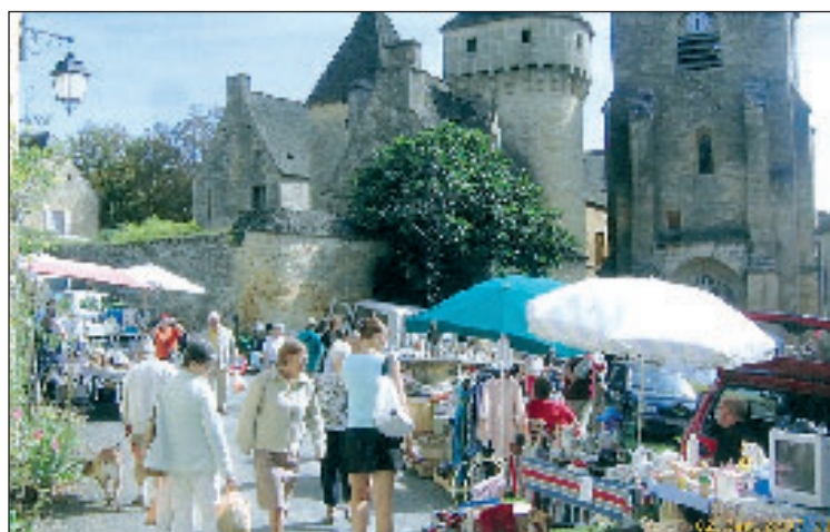
Un vide-greniers dans un cadre des plus agréables