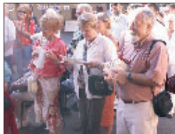
Le meilleur élève de la classe