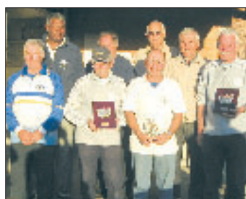
Championnat de Dordogne de pétanque