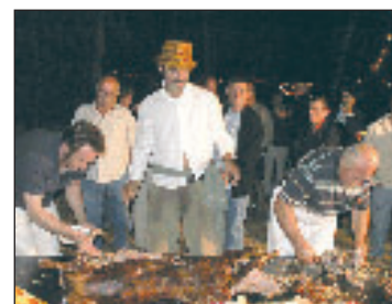
Théâtre et convivialité