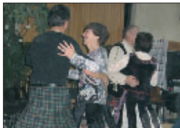
Cours de danses écossaises et irlandaises