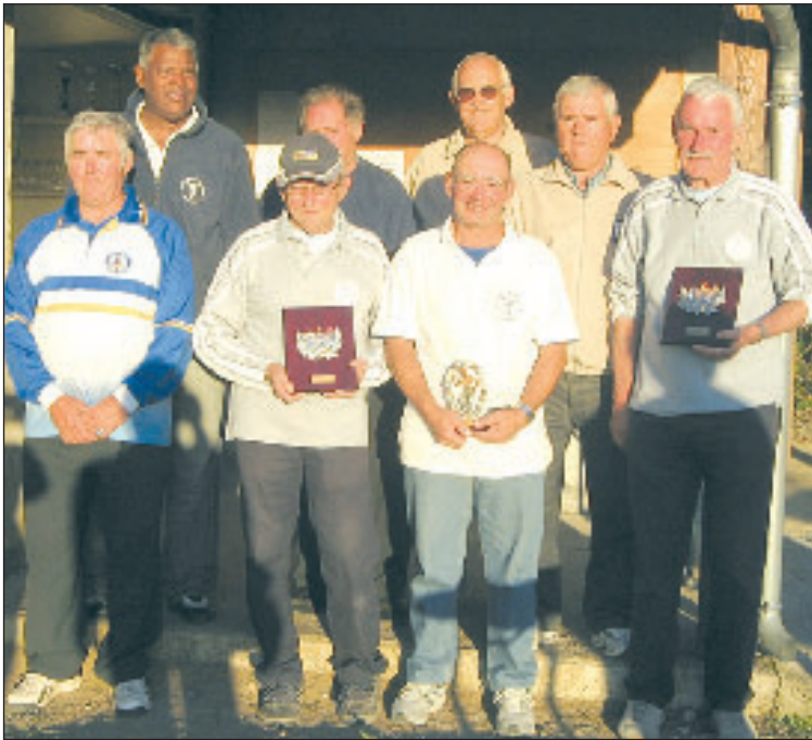
Les finalistes et les vainqueurs