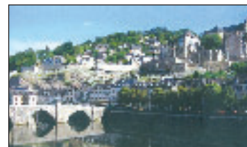
Salon en plein air des loisirs du jardin les 22 et 23 septembre à Terrasson