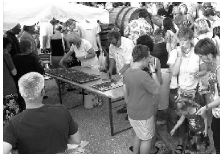
Beaucoup d'amateurs pour la tarte aux fraises