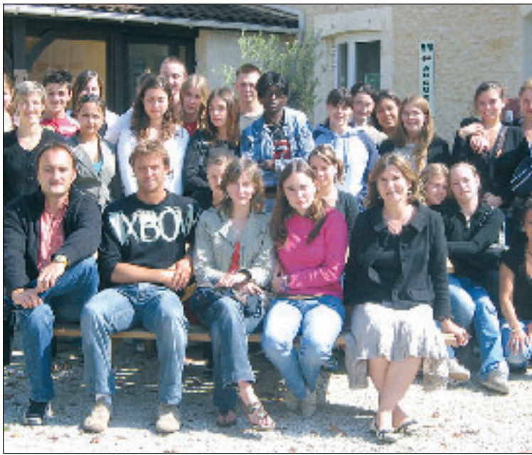
Une belle journée de rentrée