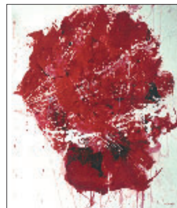
Exposition Patrick Delaunay