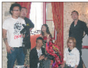
Le pays du Soleil-Levant en Belvésois