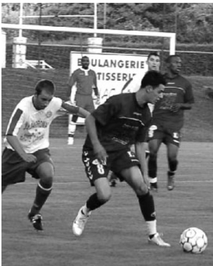
Les Sarladais à l'attaque

Une gifle salutaire ?... La C sauve l'honneur !