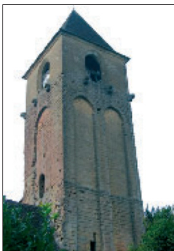
Le clocher de l'église

Les 15 et 16 septembre de 15 h à 19 h dans l'église, l'exposition photos intitulée "Plazac, l'architecture de ses maisons" sera de nouveau proposée au public pen-