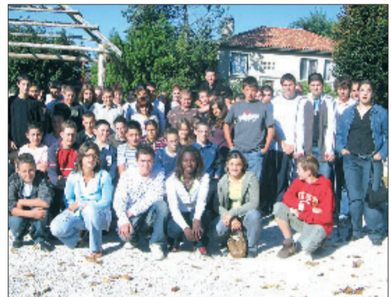
Une nouvelle année scolaire commence