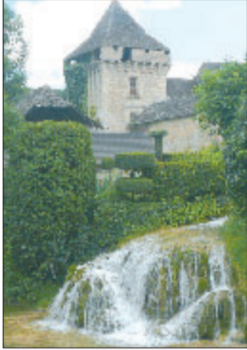
La gestion des rivières