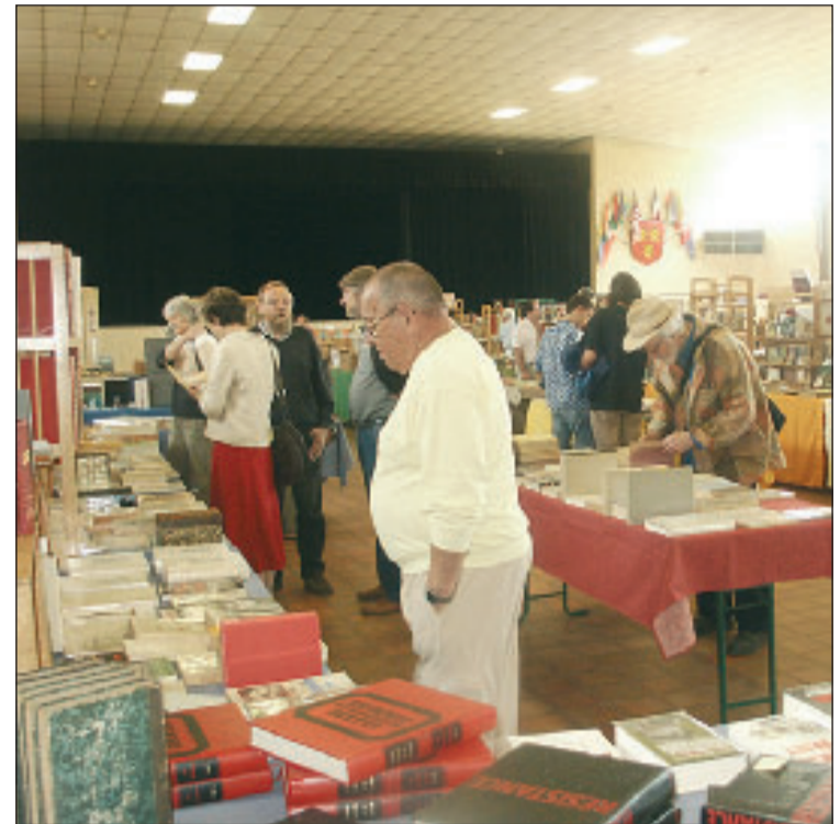
Une vue de la manifestation