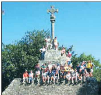
Bolée d'air breton pour les marcheurs des Sentiers d'antan