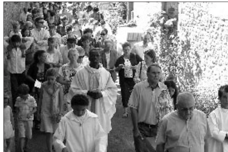
Dans la rue principale, au retour de la chapelle

Ce 15 août, jour de l'Assomption, une messe a été célébrée en l'église Saint-Martin pour l'ensemble de la paroisse Saint-Pierre de Vézère.