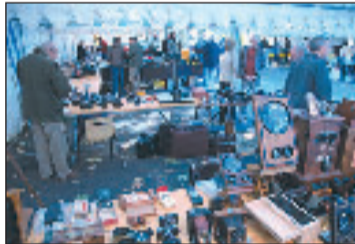
Dimanche 16 septembre sur la place de la Grande-Rigaudie