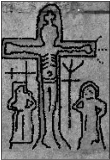
Relevé de graffiti templiers à Domme

dimanche à 11 h 30, 16 h, 17 h et 18 h. Réservations obligatoires.