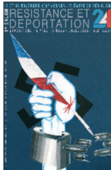
Deux journées pour le souvenir