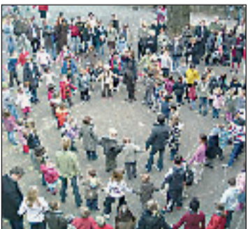
L'école transformée en ferme !