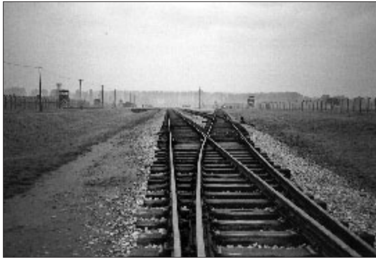
Birkenau : la voie ferrée conduisant à la mort