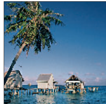
Tahiti - Marquises. Un certain regard Cinémaconférence lundi 12 novembre au Rex