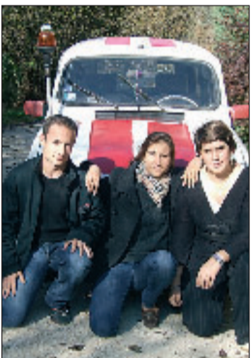
Les Schumis du Périgord