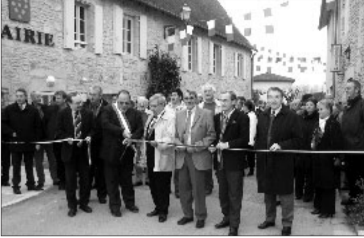
On a coupé le ruban