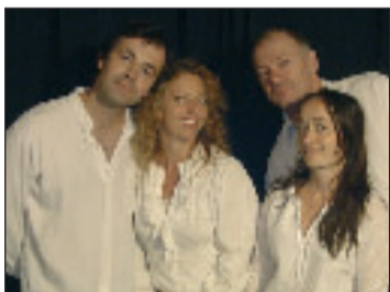
Théâtre jeune public avec "Molière au carré" lundi 26 et mardi 27 novembre