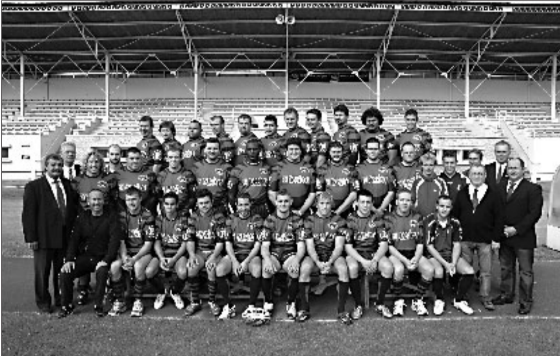
Les seniors du CASPN