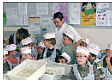
Bilan de l'opération dans les écoles