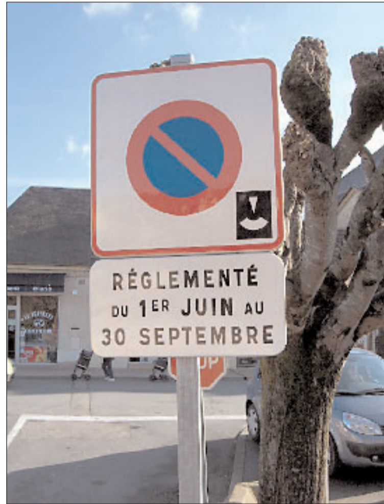
Une mesure qui sera reconduite, voire envisagée à l'année