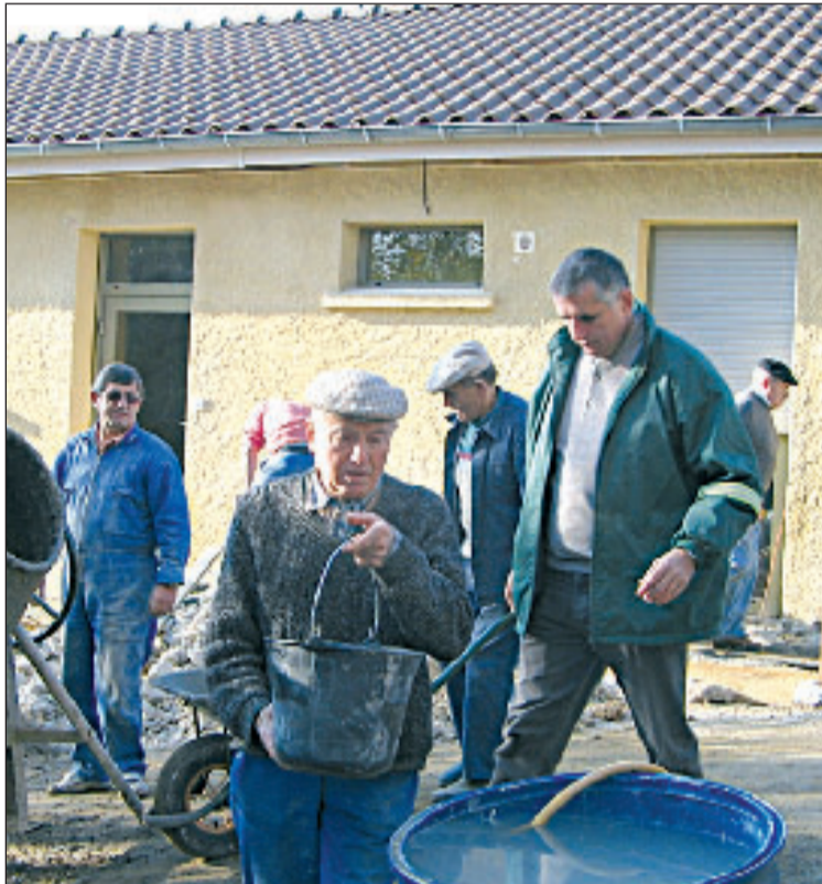
Les bénévoles sur le chantier