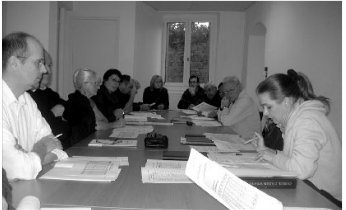
Le comité de direction a planché sur les animations 2008