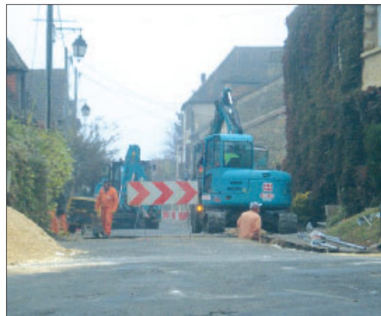
Les travaux de la rue de la Poste ont débuté