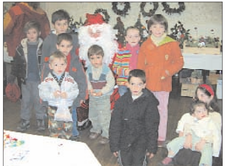
Petit papa Noël...