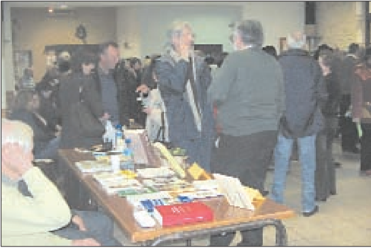
Des auteurs à l'écoute des lecteurs