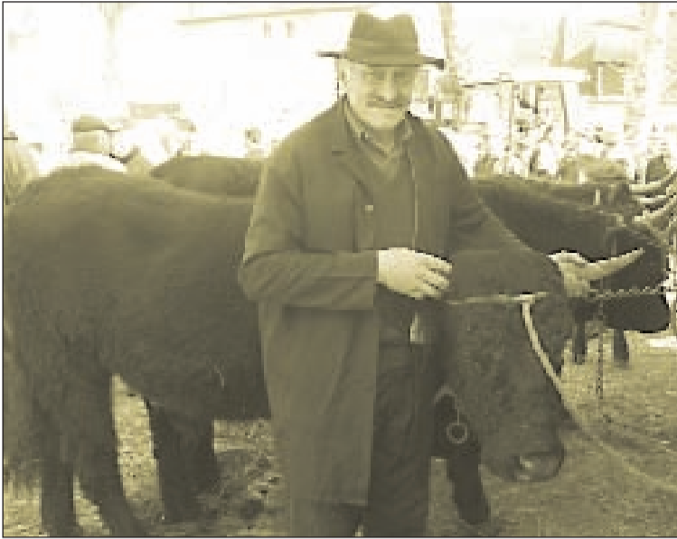
Les salers étaient présentes