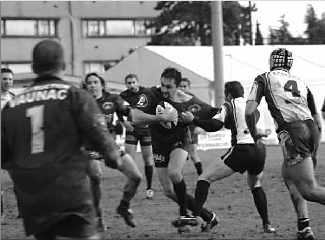
On a bien tenté côté sarladais, mais la défense adverse était vigilante

Le vent, la pluie et un terrain lourd, on comprit vite que ce ne serait pas le jour des grandes envolées à Madrazès. L'équipe qui s'adapterait le mieux à ces conditions hivernales aurait toutes les chances de l'emporter et ce ne fut pas Sarlat.