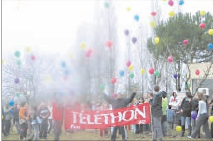
Les ballons s'envolent dans la liesse