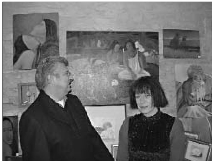
Le maire et l'artiste