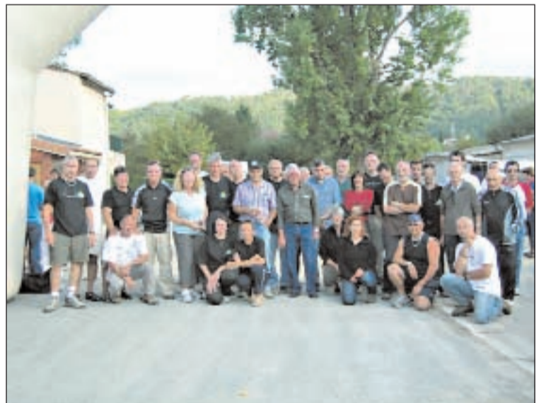
Une équipe de bénévoles veille au bon déroulement de l'épreuve

Cet aspect quantitatif est heureusement contrebalancé par de bons points qualitatifs. Les parti-