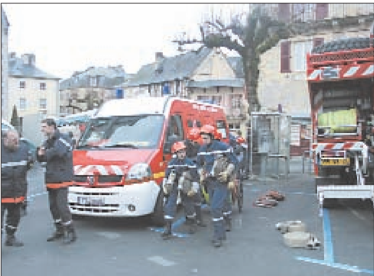
De jeunes sapeurs-pompiers lors d'une manœuvre