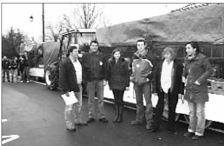
Dernières consignes avant le départ des tracteurs fleuris