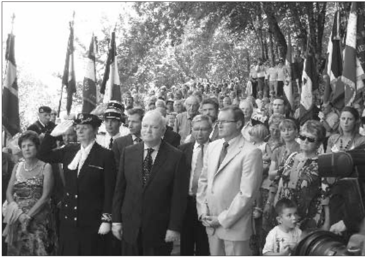
Pendant les hymnes nationaux