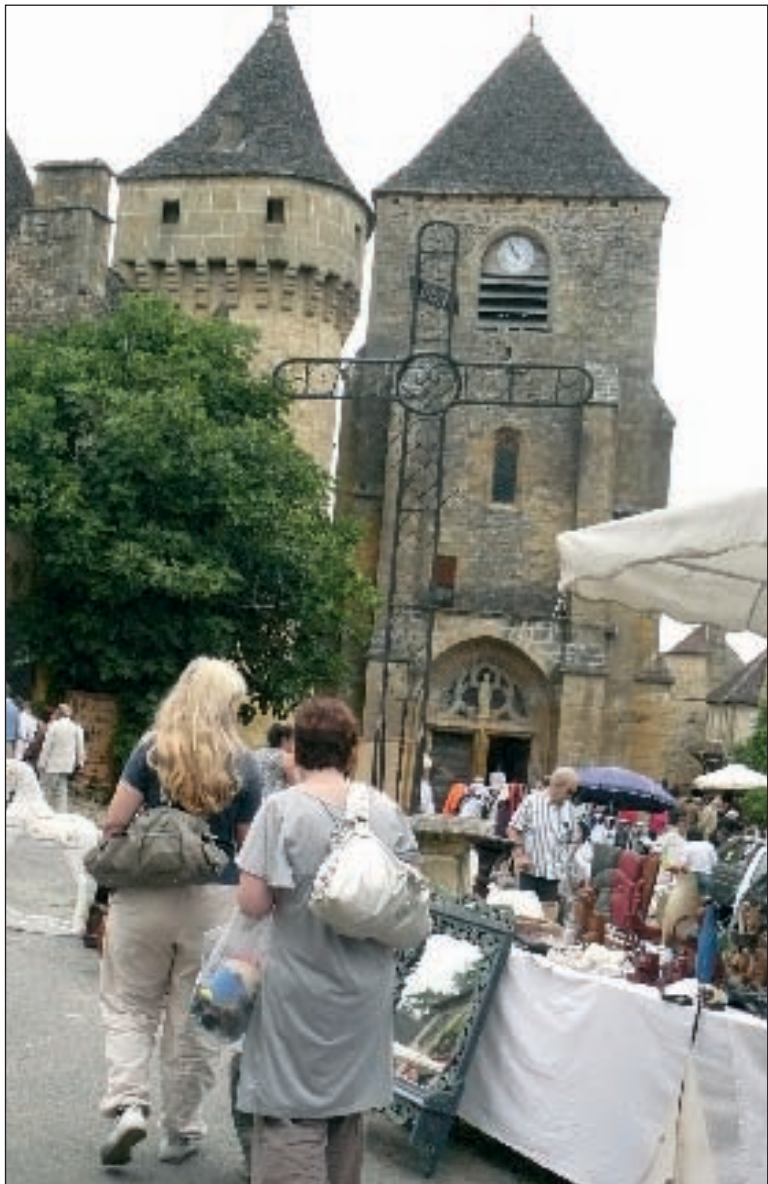
Le plaisir de chiner au cœur d'un bourg magnifique