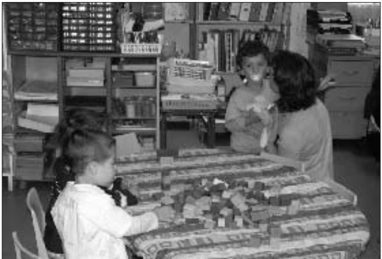
La séparation, un moment délicat