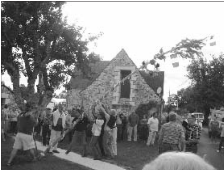
La plantation du mai

En laissant le temps au temps après les douloureux et pénibles moments vécus lors de sa mise en place, l'équipe municipale avait voulu instaurer une période de respect bien compréhensible. Bien que les pensées à l'égard de leur collègue soient toujours aussi fortes et présentes, la vie et le quo-