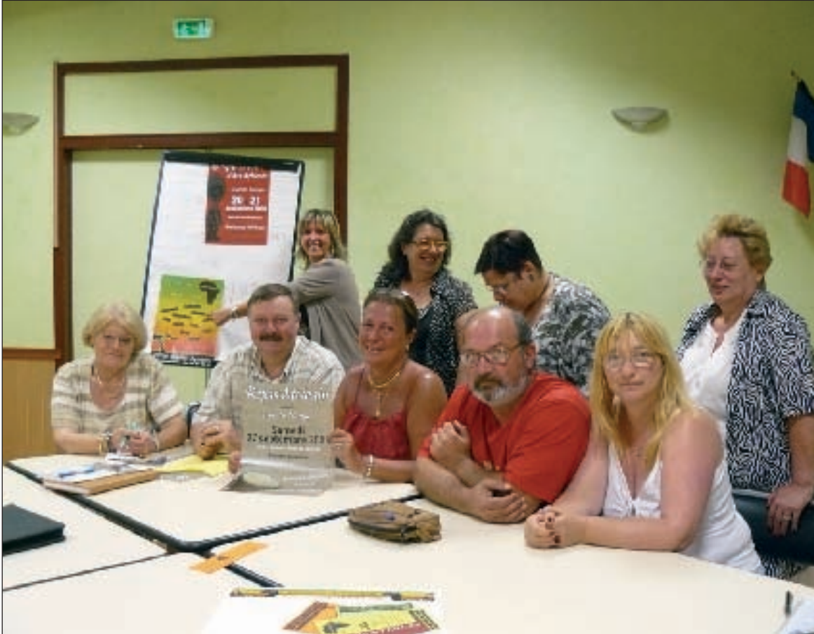
Une équipe au travail