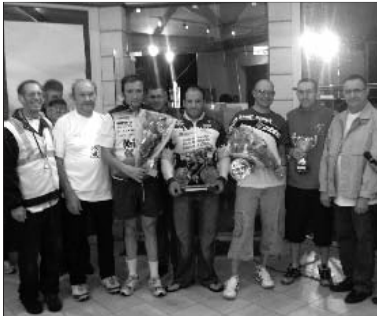
Le podium des 1 er et 2 e catégories

Une semi-nocturne perturbée par la pluie