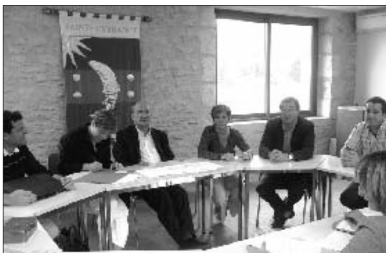
Le projet d'aménagement de la Traverse n'est encore qu'une ébauche

La réflexion sur l'aménagement du bourg, initiée par l'ancienne municipalité, a été relancée. Le 4 septembre une délégation d'élus et de professionnels des routes et du développement local s'est rendue sur la commune.