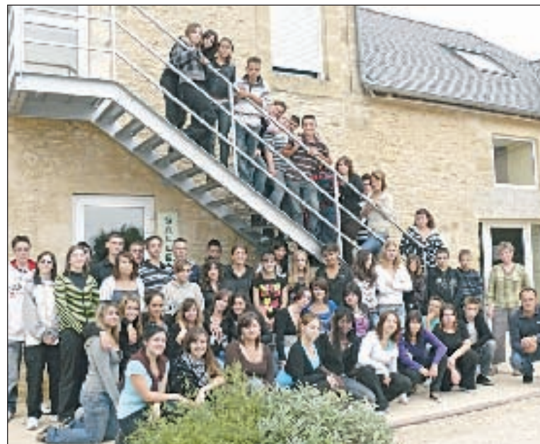
Les p'tits nouveaux