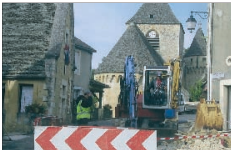
Les travaux ont démarré