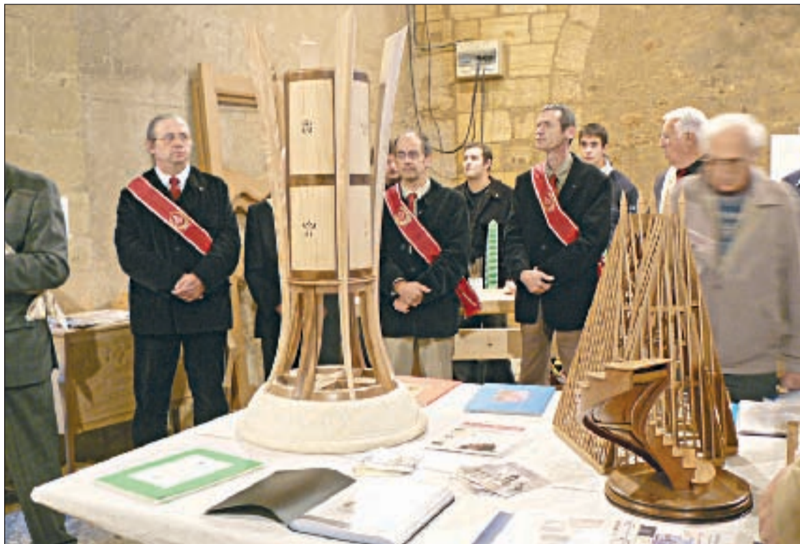
Des compagnons et des chefs-d'œuvre