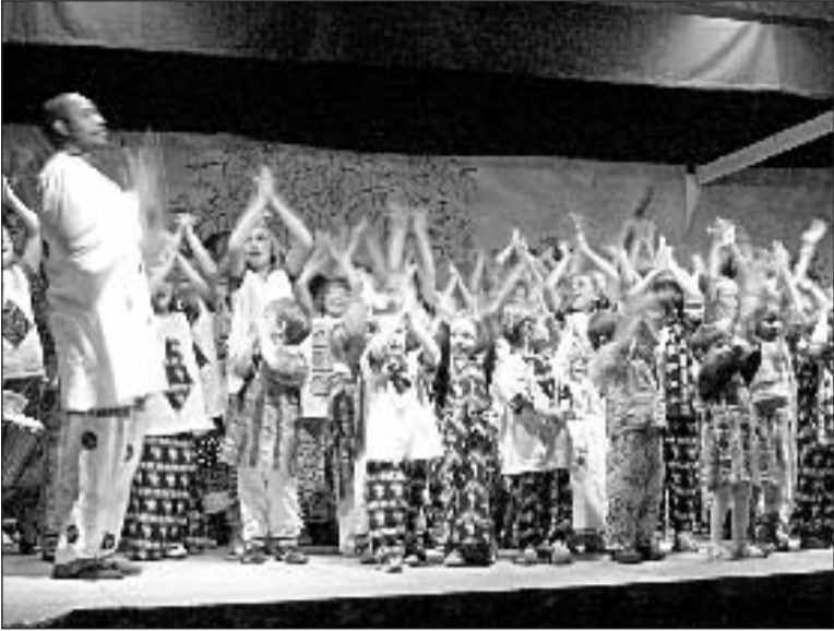
Toute l'école sur scène !