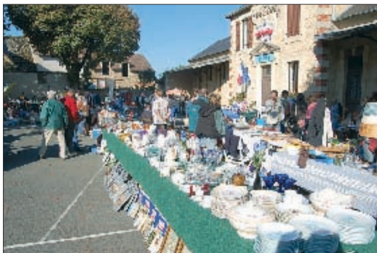
Un immense bric-à-brac sur la place de la Mairie