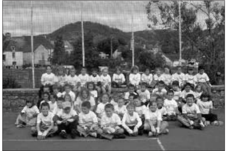
Les écoliers prêts pour la collecte des déchets !

" Pour la troisième année consécutive, nous avons participé à l'opération " Nettoyons la nature ".