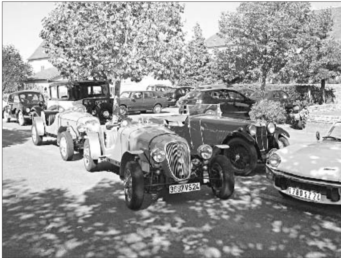
Sur la place de Montfaucon

Dimanche 28 septembre, le 3 e Rallye des Vieilles Mécaniques du Céou, qui regroupait une trentaine de voitures et de motos, partait de Castelnaud-La Chapelle. Avant le départ, un casse-croûte périgourdin fut servi : jambon de pays, saucisson, rillettes et vin rouge, consommé avec modération bien entendu !