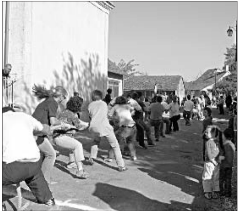
Le tir à la corde réunit toutes les forces familiales