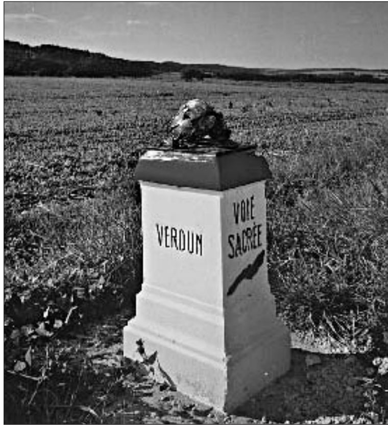
Borne kilométrique de la Voie sacrée