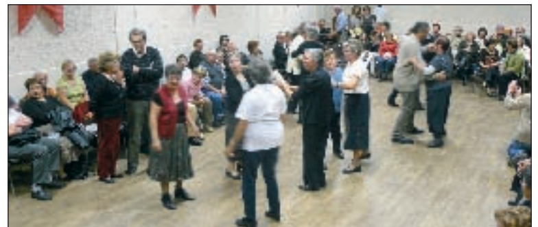
Voulez-vous danser la gigue ou la bourrée ?