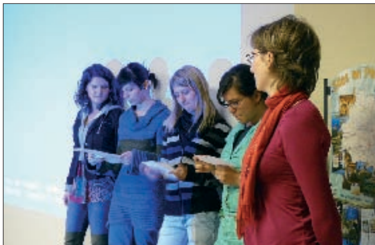
Exposer et dialoguer en anglais : challenge réussi