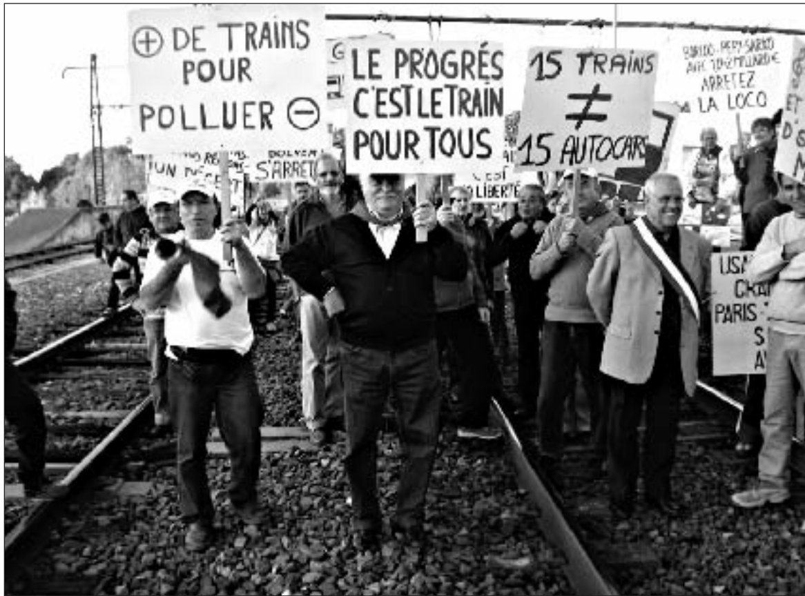
Lors d'une manifestation en gare de Gourdon

A l'appel du collectif Sud Dordogne de défense et d'amélioration des services publics et du collectif Tous ensemble pour les gares, association de défense des usagers des transports ferroviaires, les municipalités de Cénac-et-Saint-Julien, de Domme, de Carsac-Aillac, de Daglan,