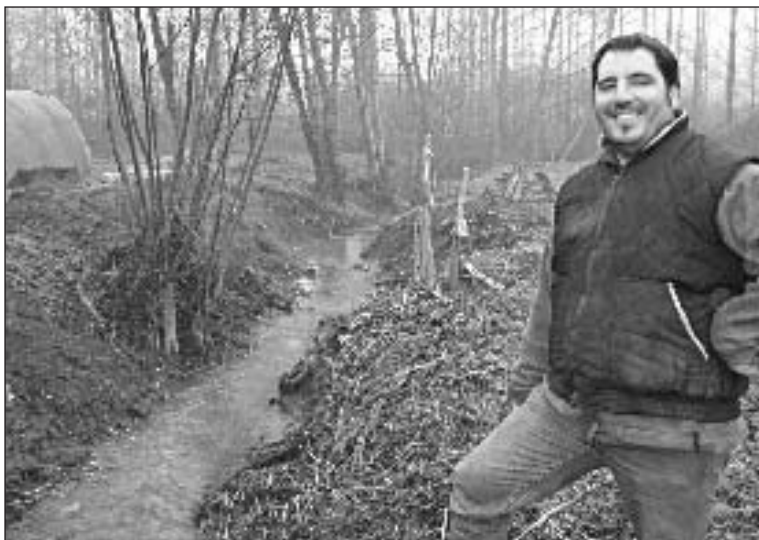
L'eau de la Nauze au cœur de plusieurs projets