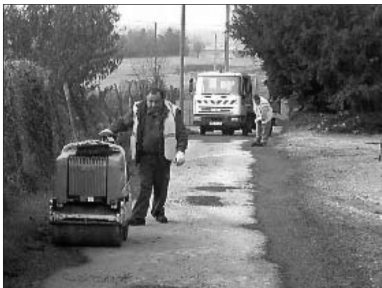
Les travaux à la Saladie