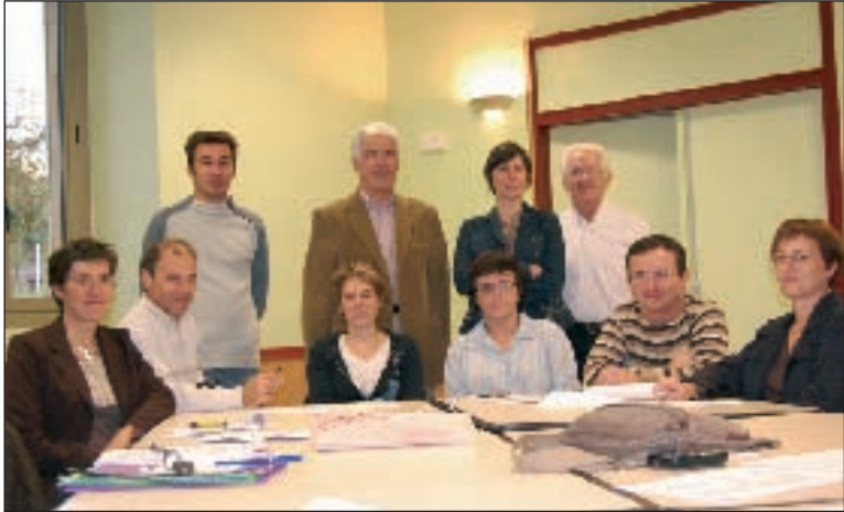
Une première réunion constructive