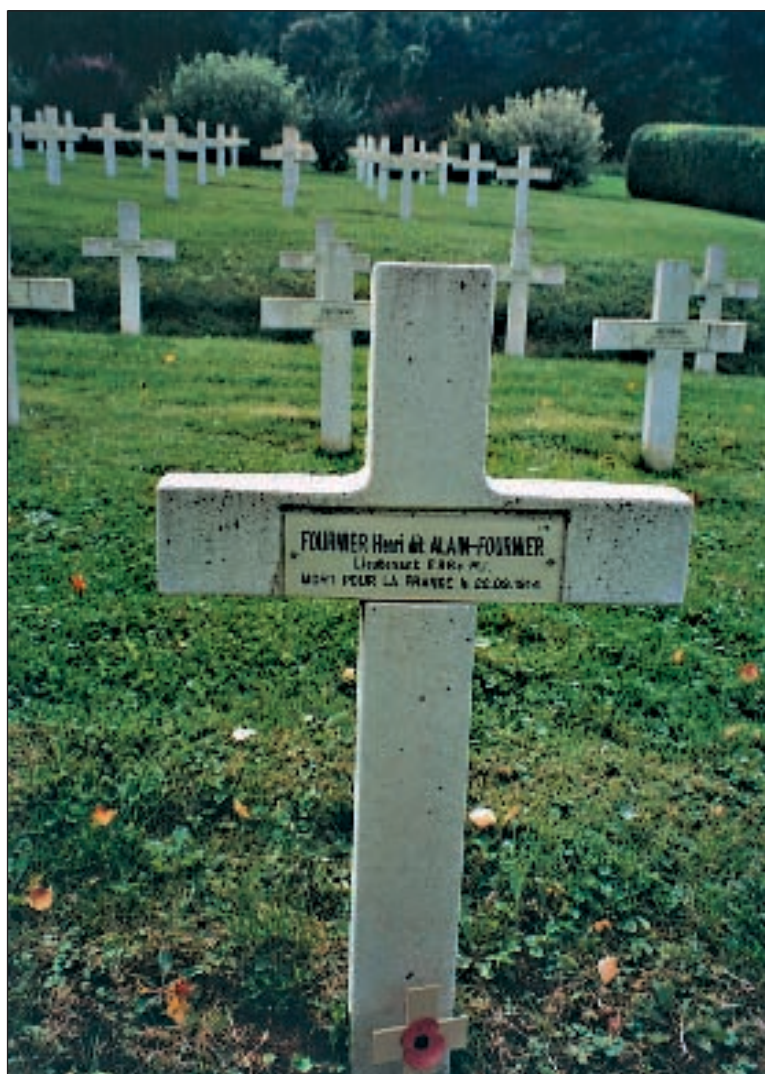
La tombe d'Henri Alain-Fournier au cimetière de Saint-Rémy-La Calonne

Cet enrichissant parcours de mémoire se poursuit par la visite de la partie située au sud-est de Verdun, la plaine de Woëvre et les Côtes de Meuse riches en