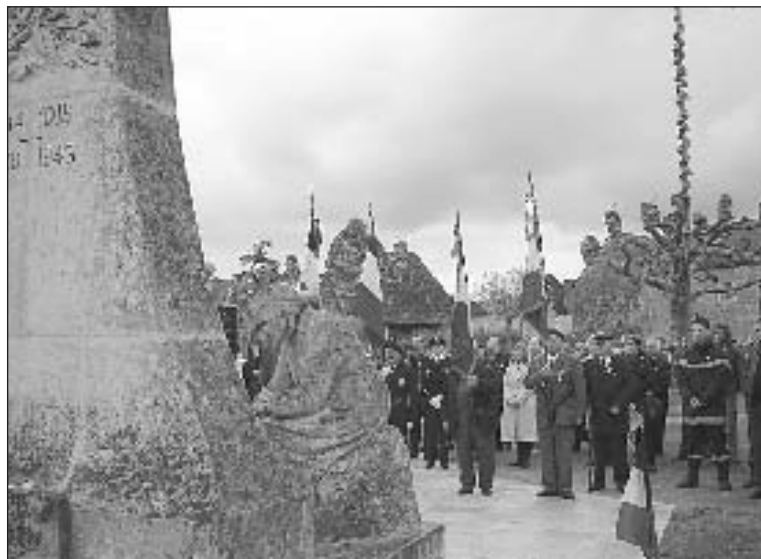
Le monument aux Morts avec la sculpture de Marguerite Mazet