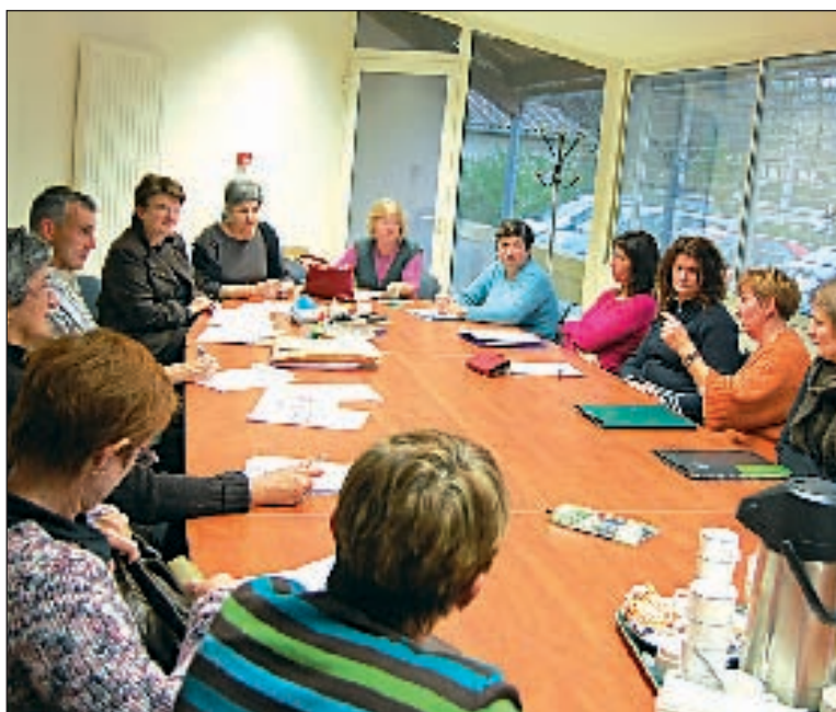
Les stagiaires à la maison de retraite de Montignac