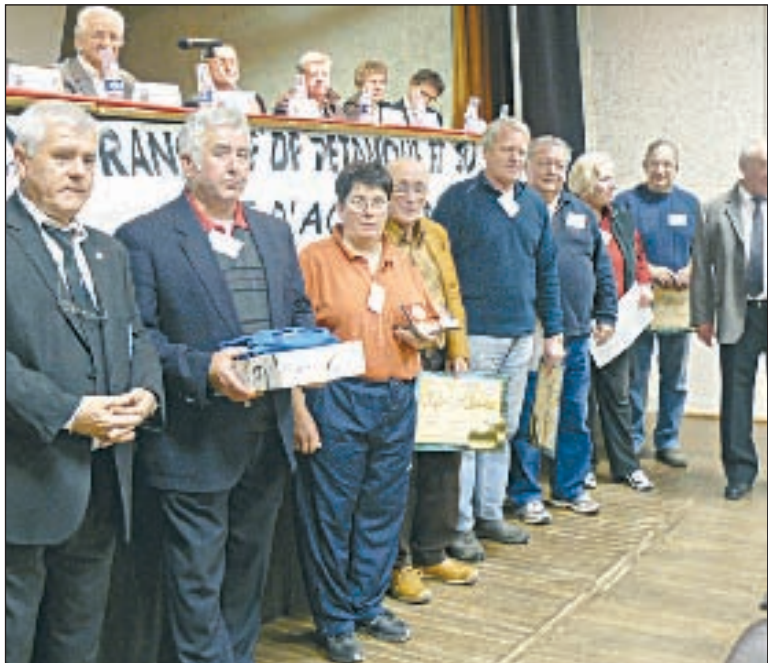
Les membres très actifs de la Boule truffée récompensés

Le dimanche 9 novembre fut une grande journée pour la Boule truffée. Le 41 e congrès de la Fédération française de pétanque et jeu provençal, ligue d'Aquitaine, se tenait dans la salle des fêtes de Salignac qui a réuni quelque deux cents personnes venues de toute la Dordogne.