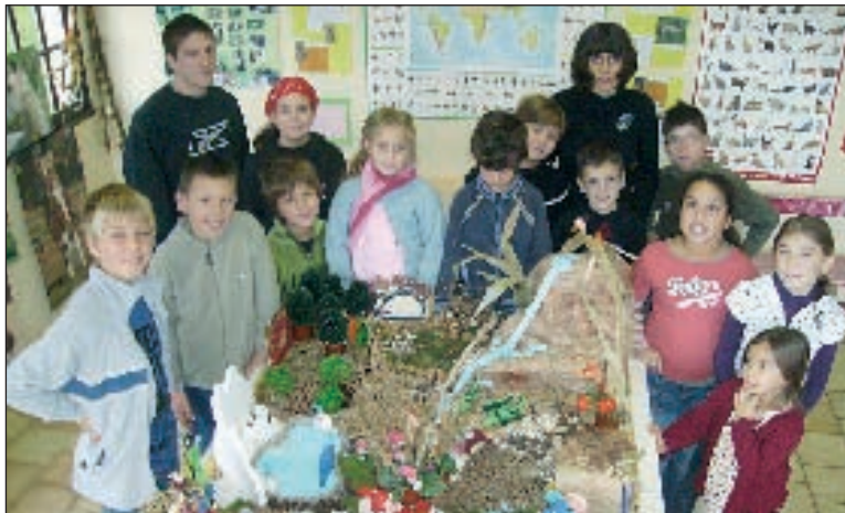
Les enfants fiers de leur chef-d'œuvre