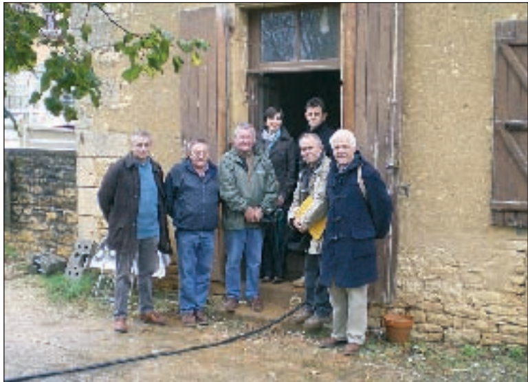
Une première réunion de chantier