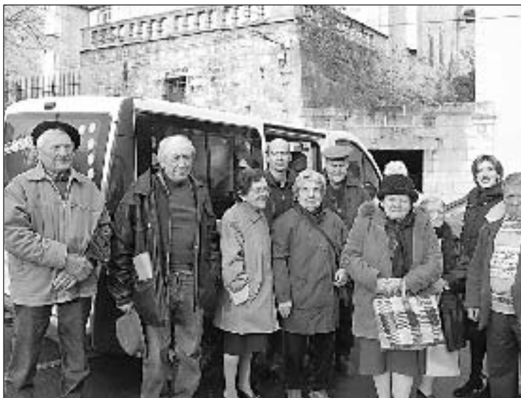
Accueillis par le maire, les Croquants viennent pour la foire

Accompagner les personnes âgées dans leurs déplacements, tel est un des projets étudiés actuellement par le Centre intercommunal d'action sociale (Cias).