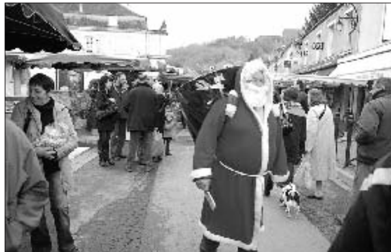
Même le père Noël était sur la foire

C'est pourquoi l'opération sera renouvelée pour les Fanlacois courant décembre, les mercredis matin, puis étendue à d'autres communes au fur et à mesure des demandes.