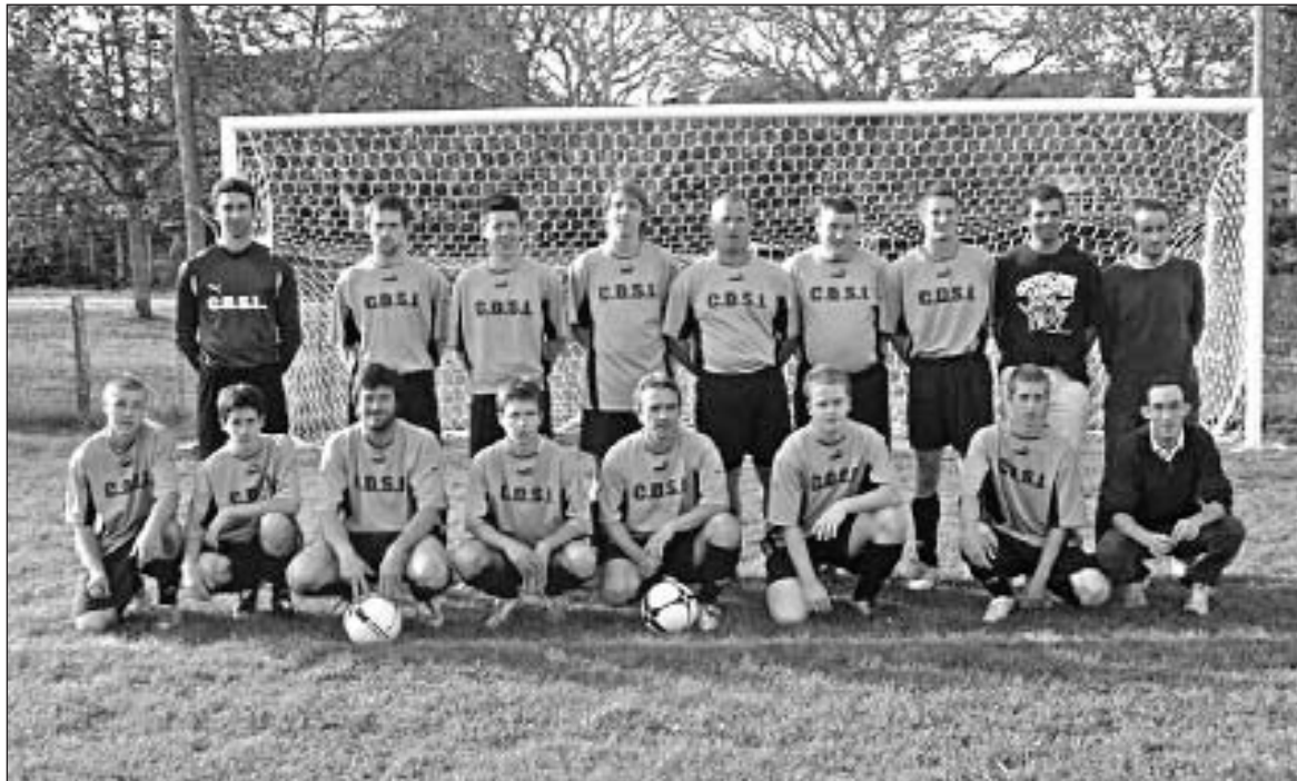
L'équipe seniors B

Pour cette septième journée de championnat, l'équipe première de l'Union sportive Campagnac/Daglan/Saint-Laurent foot recevait son homologue de l'AS Proisans/Sainte-Nathalène et se devait de renouer avec la victoire. N'étant pas dans un grand jour, elle y est parvenue avec beaucoup de peine malgré de belles occasions, mais stériles.