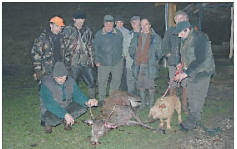
Les chasseurs et leur trophée