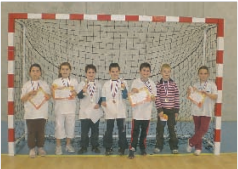
Les enfants fiers de leurs premières médailles