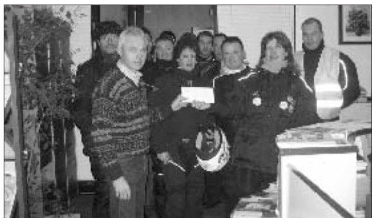
La remise de l'enveloppe de la solidarité à la responsable

Comme tous les ans, les matras du Téléthon sont passés. Juste avant 20 h, le cortège de plus de cinquante motocyclistes arrivait de La Bachellerie et faisait sa première halte devant la mairie. De nombreuses communes les attendaient au cours de ce périple de plus de deux cents kilomètres à travers le Périgord Noir. La salle