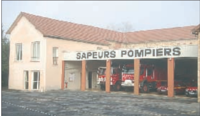
La caserne avec ses garages et ses nouveaux locaux de garde