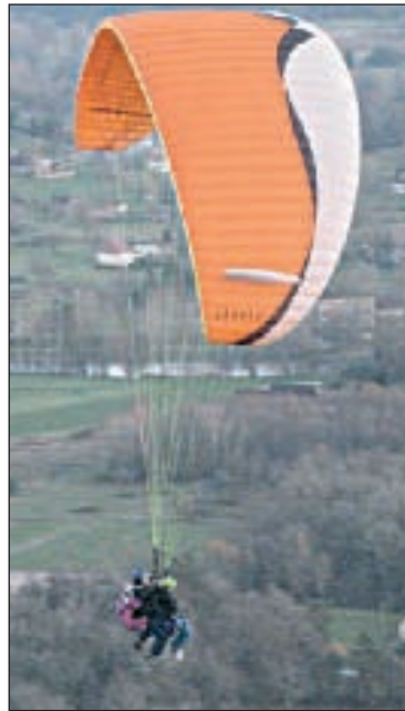
Le parapente

Pour le Téléthon 2008, En quatre pour l'espoir, association aubasienne, regroupait l'ensemble des animations du canton de Montignac.