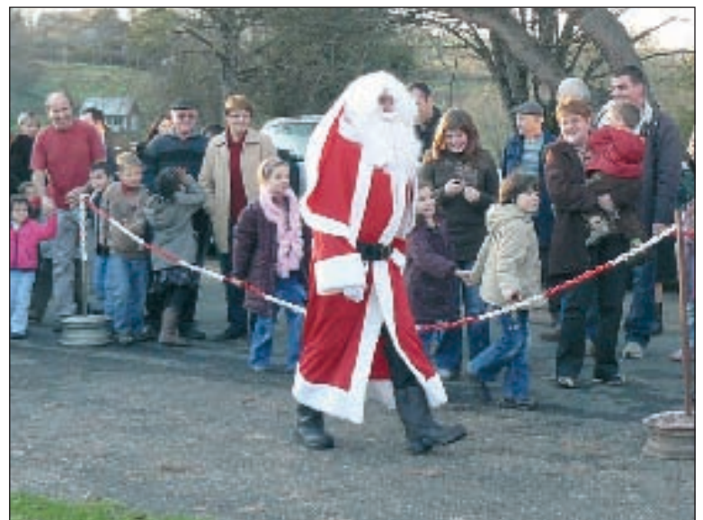
Il était très attendu par les enfants