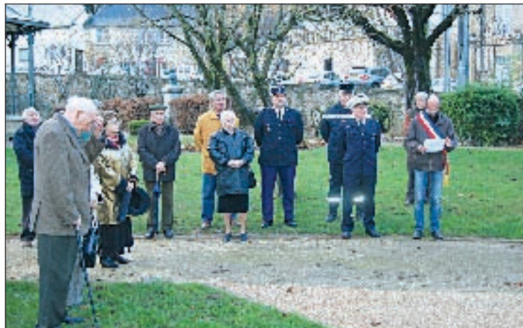
Les diverses personnalités