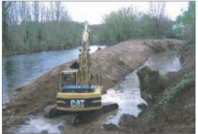
L'aménagement de la couasne de Biars