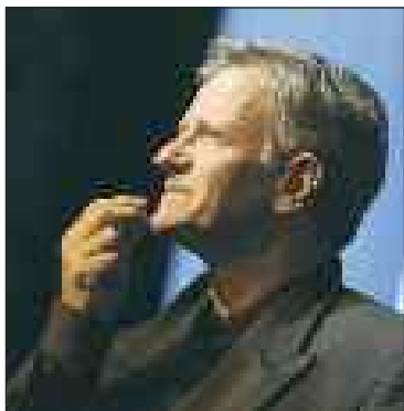
Francis Huster

Vendredi 23 à 21 h 30, place de la Liberté, Traversée de Paris de Marcel Aymé. Avec Francis Huster.