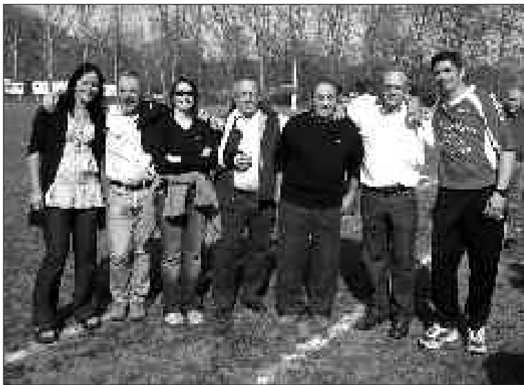
Quelques dirigeants du RCD

Classement temporaire de la poule 2 e série du comité Périgord-Agenais : 1 er ex aequo, Caudecoste et Saint-Aubin ; 3 e , Périgueux ouest ; 4 e , Virazeil ; 5 e , Le Buisson-de-Cadoux ; 6 e , Prigonrieux ; 7 e , Saint-Romain-Le Noble ; 8 es ex aequo, Daglan et Cancon ; 10 e , Cheveix-Cubas.