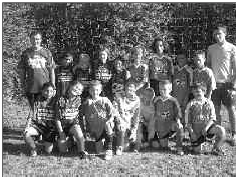
Les U11 sont en finale !

Félicitations à ses jeunes footballeurs en herbe et rendez-vous