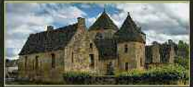
Les Chambres du Château A partir de 90€ la nuit