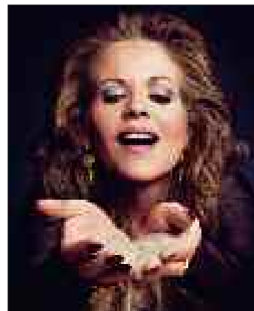
Renée Fleming

Le samedi 1 er mai à 19 h, le cinéma Rex propose, en direct du Metropolitan Opera de New York, la retransmission de l'opéra en cinq actes de Gioachino Rossini, "Armida", sur un livret de Giovanni Shimdt.