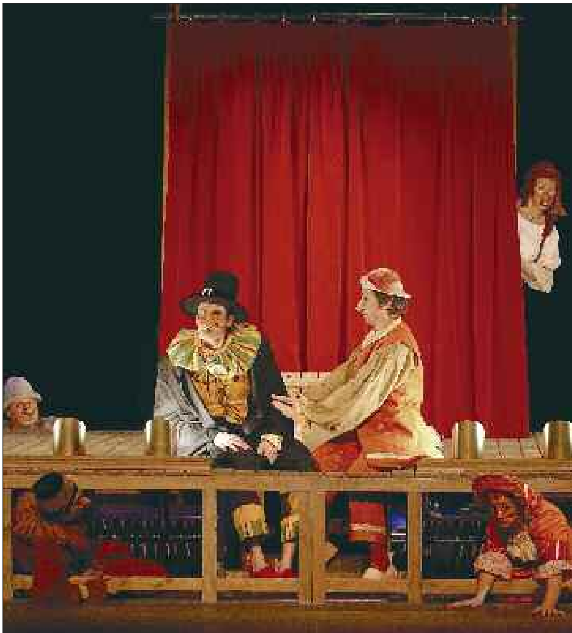
"Le Médecin malgré lui", de Molière, sera joué le 3 août au jardin du Plantier