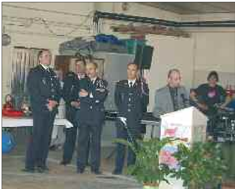
L'intervention du maire