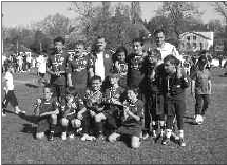
L'équipe des U13

Seniors A. Honneur. FCSM : 3 - Saint-Médard-en-Jalles : 1. Buts d'Alex Da Costa (2) et de Perez.