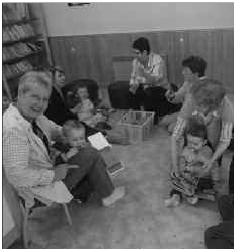
Lors de la deuxième séance

Les bébés lecteurs étaient de nouveau réunis à la bibliothèque le jeudi 15 avril en matinée. Cette heureuse initiative est un succès complet.