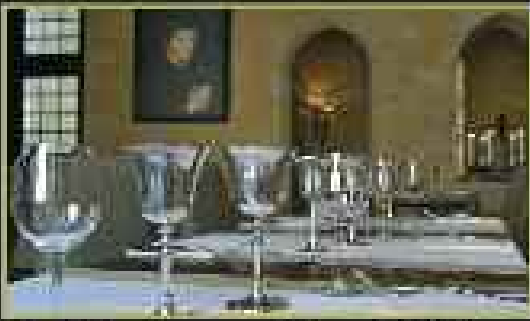
Le Restaurant du Château Carte de 8€ à 25€