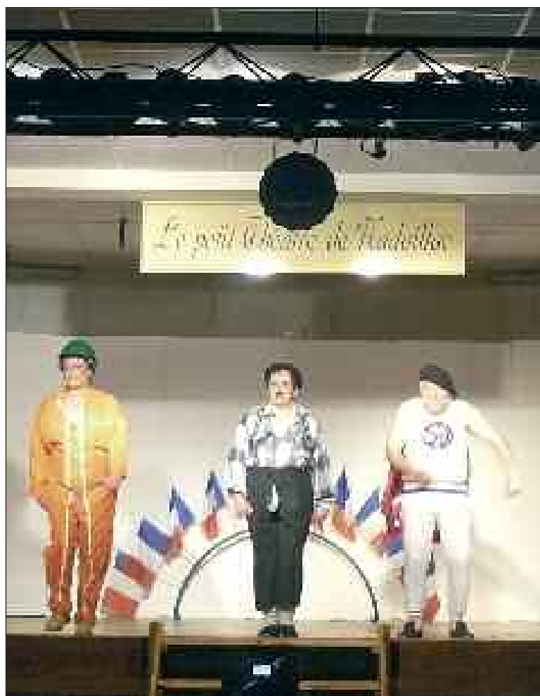
Rire et décontraction