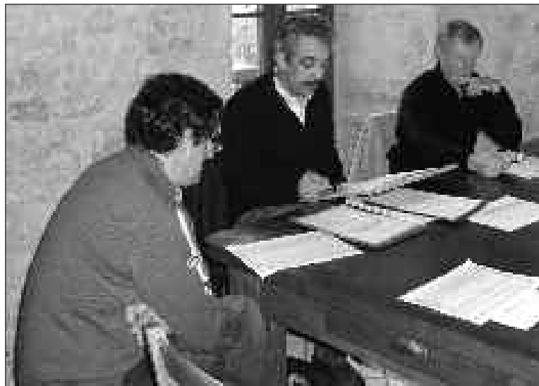
Le maire et ses adjoints lors de la délibération