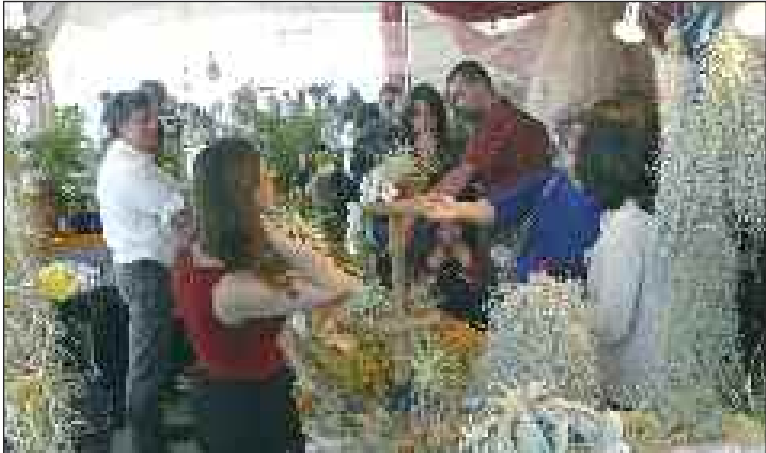
Orchidées et tillandsias