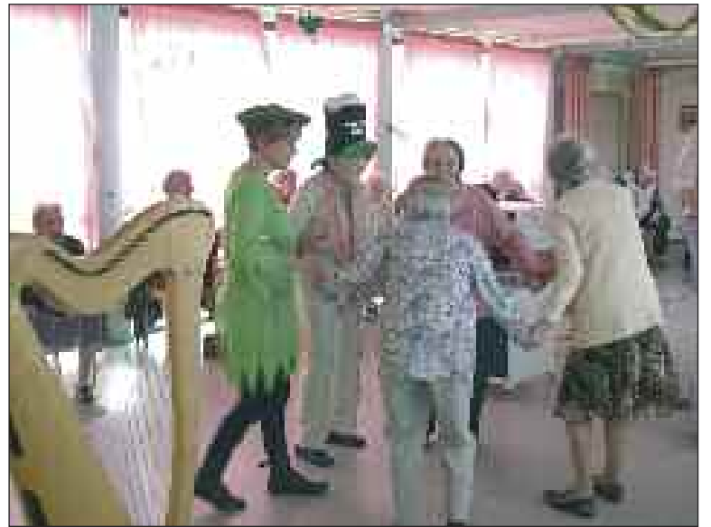
Entrez dans la danse...