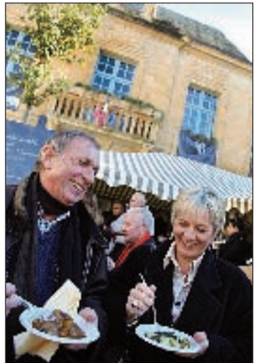
Les croustous à la truffe et au foie gras : une appellation qui a été déposée par la mairie il y a quelques mois. Les amateurs pourront les déguster samedi et dimanche à 11 h 30 place de la Liberté

La Fête de la truffe, ce sera cette année trois événements qui se dérouleront sur un week-end et qui mettront Sarlat sous le feu des projecteurs. "Une vingtaine de journalistes nationaux sont annoncés", avance le coordinateur. Ils ne seront pas les seuls amateurs de gastronomie à venir de toute la France,