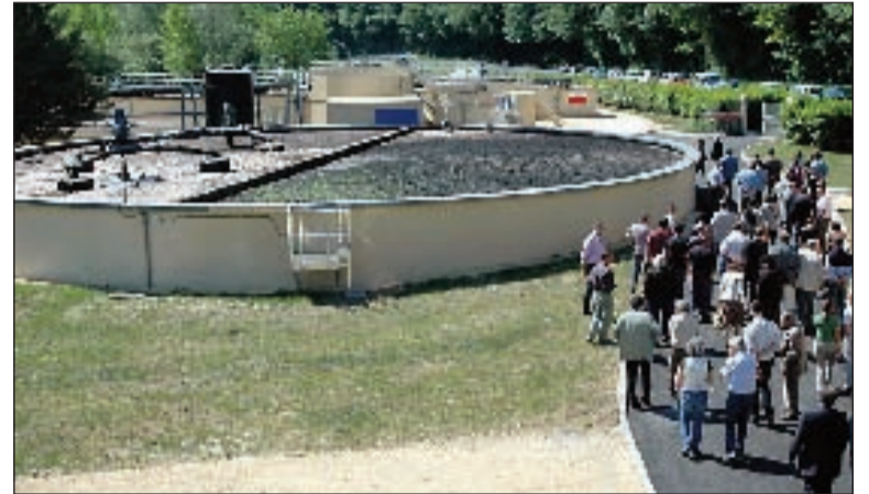
En mai, la nouvelle station d'épuration de Sarlat a été inaugurée. Sous délégation de service public, elle doit améliorer le traitement des eaux usées