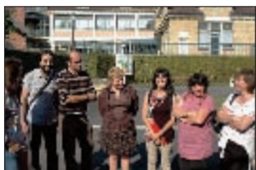
Des élèves du collège La Boétie restent sans professeurs de français et d'espagnol pendant presque un mois. Parents et enseignants protestent