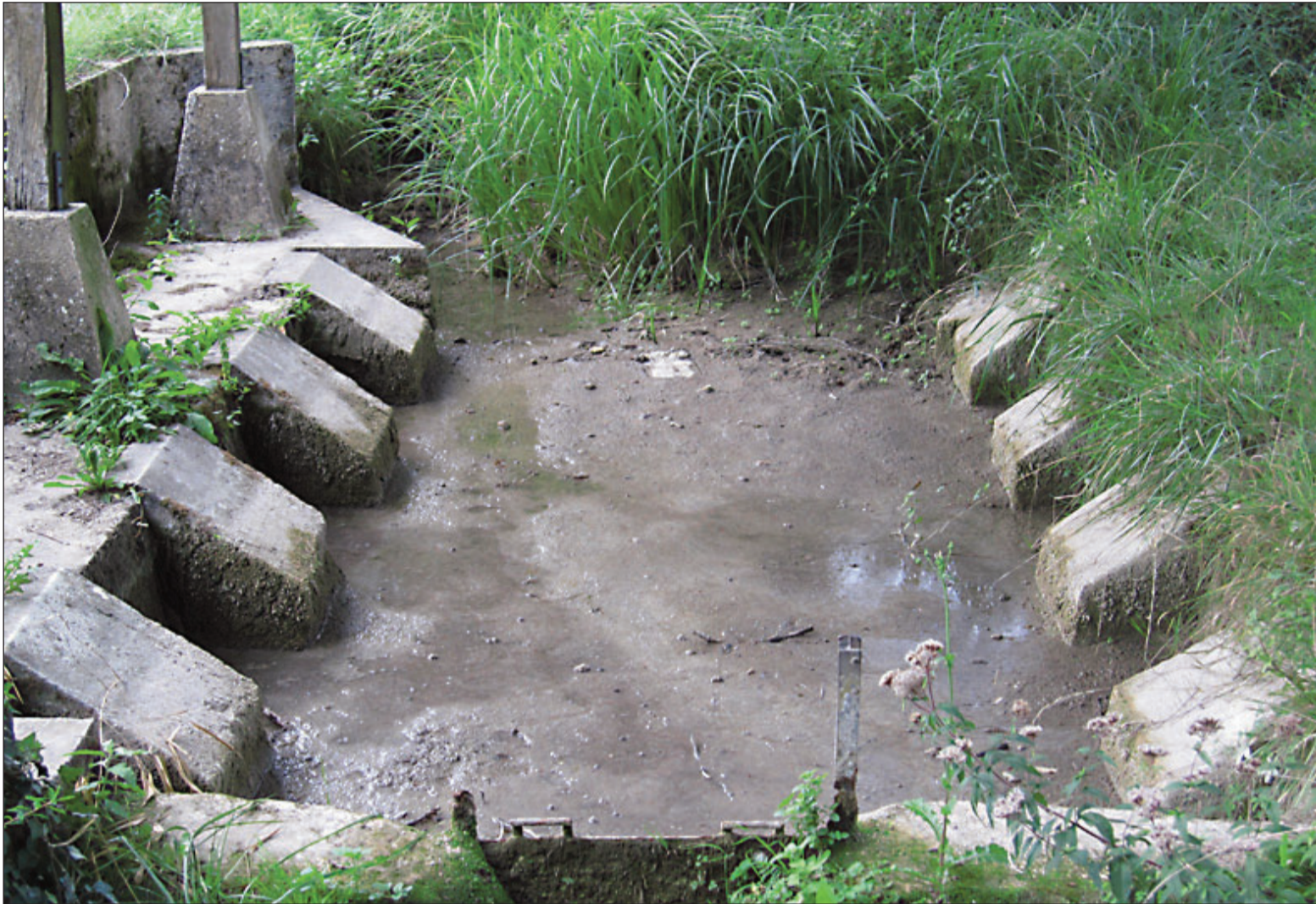
Le lavoir est à sec