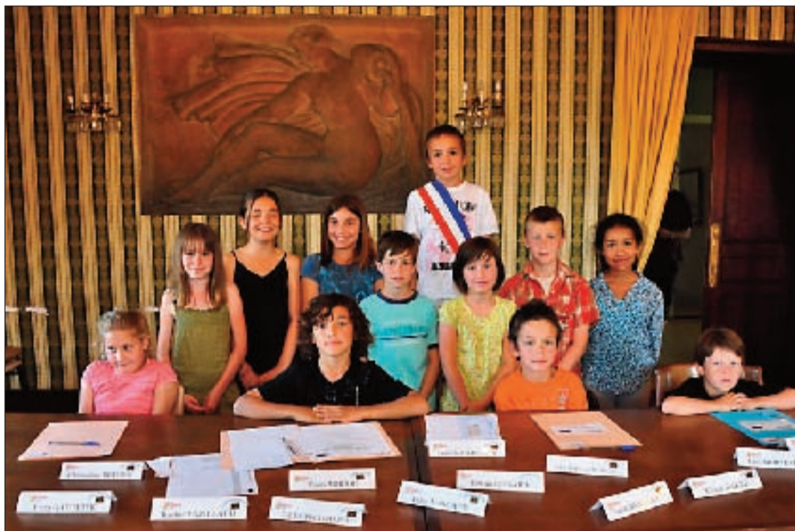
Le conseil municipal des jeunes

En termes d'entreprise et d'emploi, 2011 a vu la création de l'Association interprofessionnelle du Montignacois (AIM), regroupant quarante entreprises et ayant pour but la mutua-