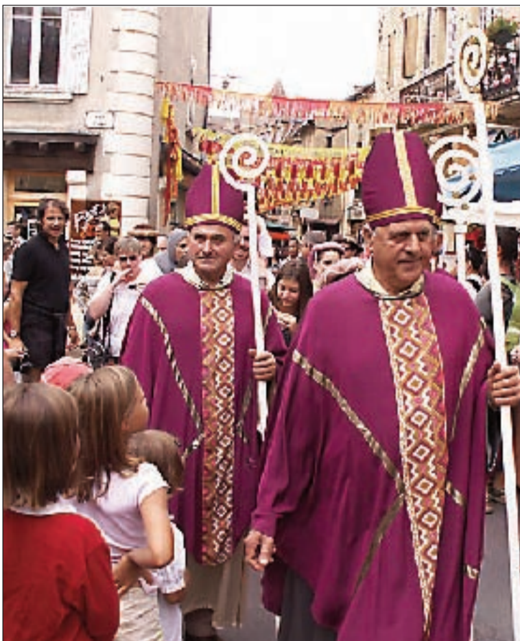
Le maire fait partie du cortège des prélats

En avril, la commune sera de nouveau la capitale française de l'ultramarathon. La 34 e édition des 100 km du Périgord Noir sera le support des championnats de France de la discipline et des championnats d'Aquitaine. L'équipe de Jean-Pierre Sinico est parfaitement rodée à ce type de manifestation, et c'est avec un groupe légèrement remanié qu'elle s'apprête à recevoir un millier de participants. On a même évoqué un moment l'organisation du Mondial, mais cela s'avère plus difficile compte tenu des structures qu'il faut avoir.