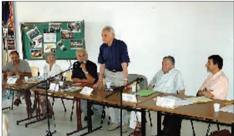
Fin juin, l'ADPAEI du Périgord Noir se mue en Apajh du Périgord Noir. Face aux nouveaux besoins, l'association connaît des difficultés financières et manque de l'encadrement nécessaire. Elle tire la sonnette d'alarme