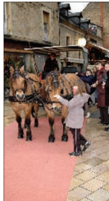
Un temps parfois pluvieux vient contrecarrer les plans des promeneurs, mais n'empêche pas le marché de Noël de Sarlat d'être un succès. Le commerce reste très correct en général. La calèche ne désemplit pas et les animations resteront dans les mémoires, notamment la venue des dromadaires !