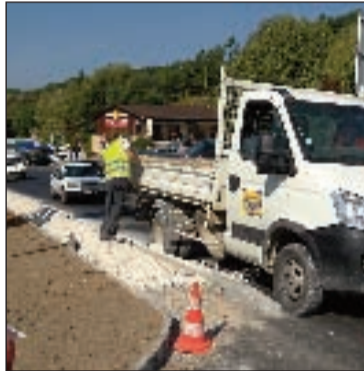
En mai et juin, l'avenue de la Dordogne et le Pontet à Sarlat, ont été le théâtre de travaux importants qui ont amélioré la circulation des piétons et des voitures, mais ont aussi provoqué le mécontentement de certains commerçants