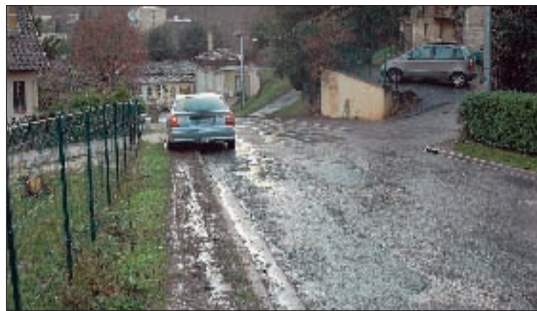
Les riverains ont pris l'habitude de rouler sur les bas-côtés pour éviter certains trous profonds de plusieurs centimètres. Piètre solution...

L'état de la route : une conséquence du manque de dialogue entre les parties dans le passé