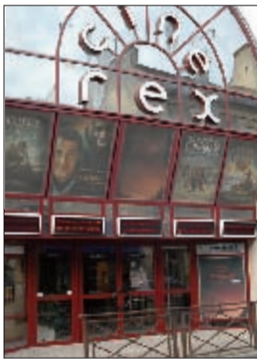
En novembre, dans la foulée du Festival du film, le conseil municipal de Sarlat vote à l'unanimité une subvention pour soutenir le cinéma Rex dans son projet de modernisation et d'agrandissement