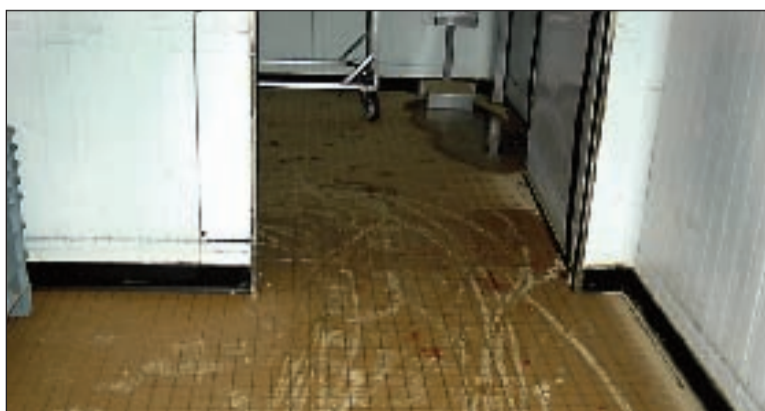
Le mardi 2 août, de violentes intempéries provoquent de sérieux dégâts à Sarlat. La Cuze déborde à plusieurs endroits et nombre de commerces et d'entreprises (ici la coopérative Sarlat Périgord foie gras) passeront les jours suivants à nettoyer. Sans parler des particuliers...