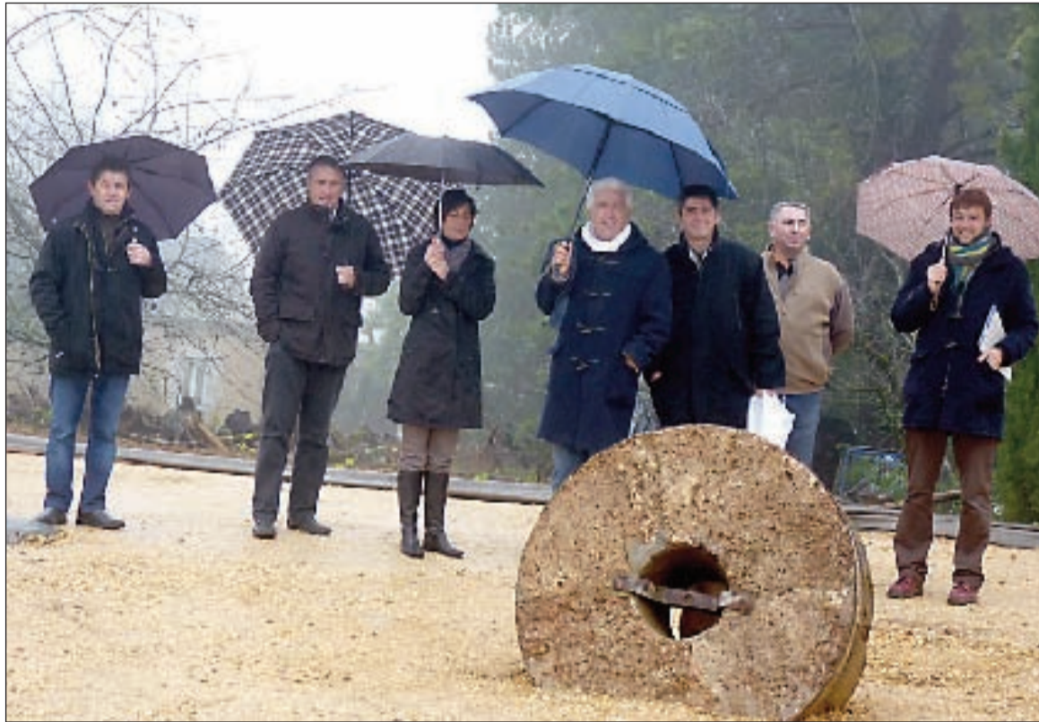
Le chemin a conservé des traces du patrimoine et de la mémoire du passé