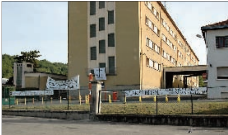
Fin juin, l'usine de France-Tabac de Sarlat annonce un plan de sauvegarde de l'emploi. Près de cinquante salariés sont touchés. Les tabaculteurs supplient l'Etat de leur venir en aide