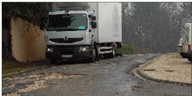
Plusieurs centaines de passages de véhicules, dont des camions, se font chaque semaine sur cette chaussée en piteux état

Privée, la voie de la résidence Vigneras n'apparaît pas sur la carte de la commune. Lâssée à l'abandon, elle est aujourd'hui dangereuse