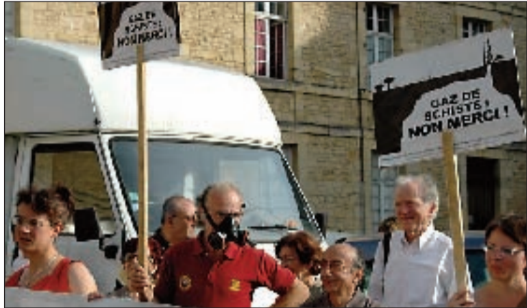
Les opposants au gaz de schiste se sont mobilisés de diverses manières : projection du film "Gasland", manifestations, réalisation d'un site Web, délibérations dans les conseils municipaux, banderoles...