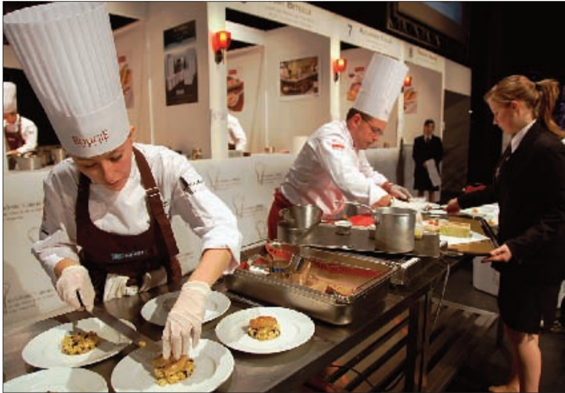
Les candidats au Trophée Jean-Rougié à l'œuvre, en janvier 2011

Trois événements se dérouleront le week-end des 14 et 15 janvier