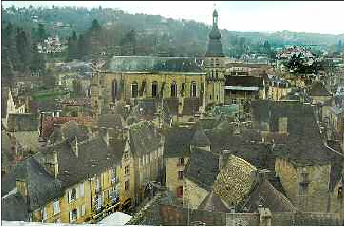
Vue de la cathédrale Saint-Sacerdos et du quartier est de Sarlat depuis le sommet de l'ascenseur panoramique. Les parois de l'équipement sont vitrées