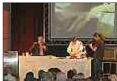
Les démonstrations de cuisine par des chefs du Périgord Noir ont fait salle comble à l'Ancien Evêché. Une seconde salle a été ouverte, où le public a pu suivre par écrans interposés les performances des cuisiniers