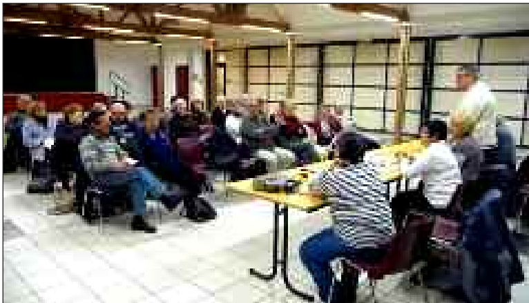
Lors de l'assemblée