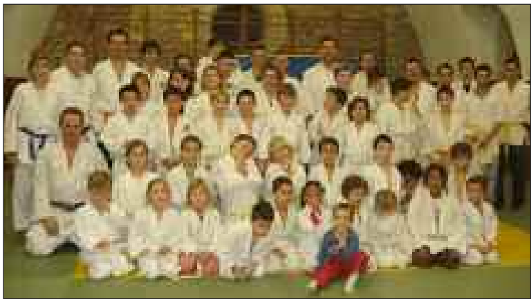
Enfants et parents réunis au dojo