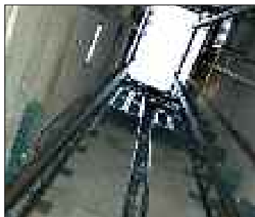
La cage de l'ascenseur

Haute saison : 5 € (tarif plein) et 4 € (tarif réduit) ; basse saison : 4 € (tarif plein), 3 € (tarif réduit). Avec mise à disposition d'un Audioguide.