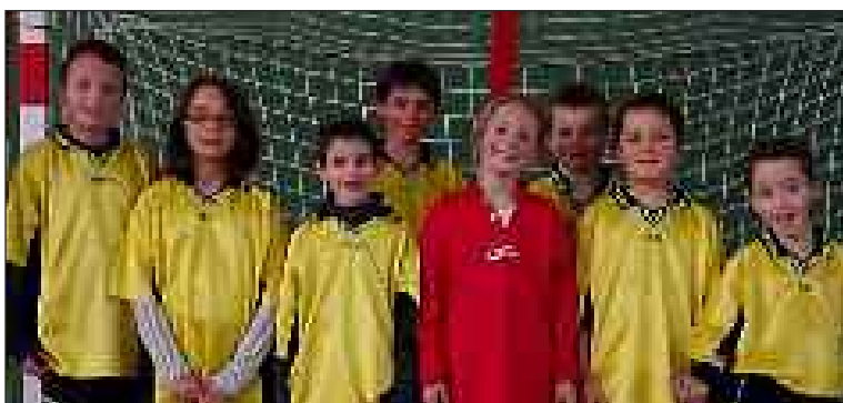
Les moins de 11 ans