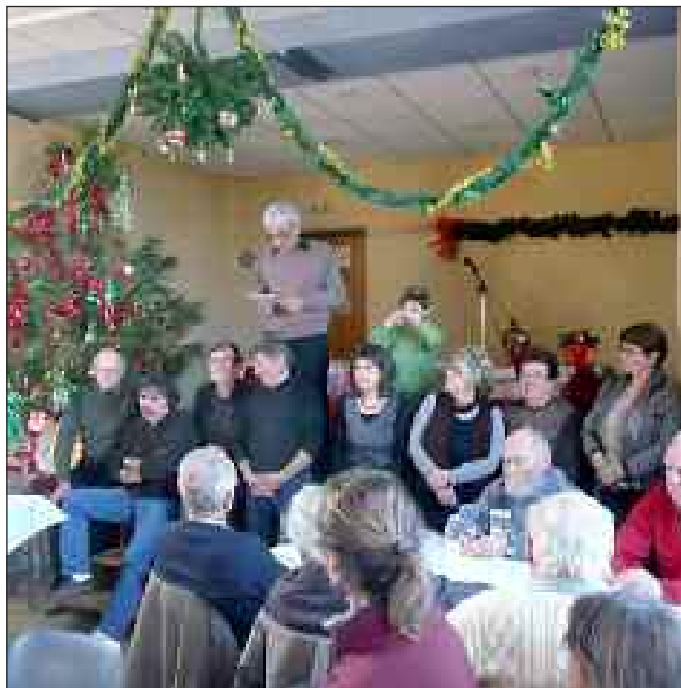
L'équipe municipale lors de l'allocution du maire

Comme tous les ans, la population était conviée à un après-midi de rencontres et d'échanges. L'occasion, à l'orée d'une nouvelle année, de faire le point sur la vie communale et les projets.