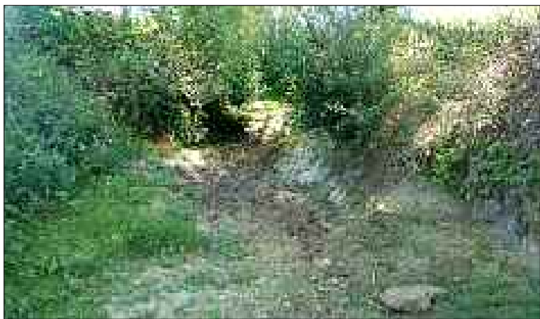
A Liorac-sur-Louyre, la Louyre fut à l'étiage sévère de début juin jusqu'au mois d'octobre. "L'étiage sévère, cela correspond au débit exceptionnellement faible d'un cours d'eau. Cela peut conduire à la rupture du continuum écologique aquatique, explique Hélène Moronval, technicienne à Epidor. Par exemple, la circulation des poissons ne peut plus se faire. Cette expression englobe les cours d'eau qui ont un débit extrêmement faible et les cours d'eau en rupture d'écoulement ou à secs."

Et si l'accès à l'eau devenait difficile, même en Europe ? Certains pensent cette menace fondée. Ils invitent à venir s'informer et à en débattre