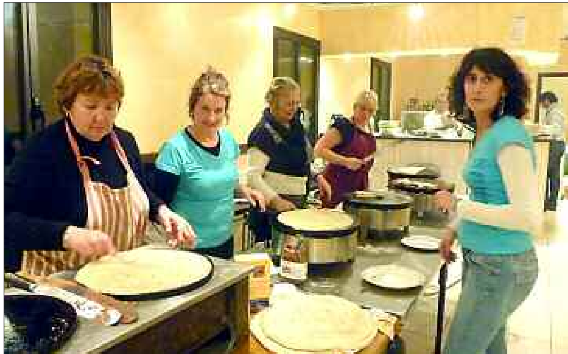
Les crêpières à l'œuvre