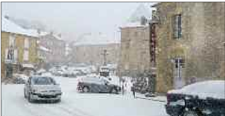
La Bouquerie sous la neige, dimanche 5 février

Il n'a pas fallu longtemps à la neige pour accomplir son œuvre. Dimanche 5 février vers 7 h, de petits flocons commençaient à tomber sur la cité de La Boétie. Les chaussées n'étaient encore recouvertes que d'un voile blanc, qui disparaissait au passage d'un pied ou d'une voiture. Ce voile fut remplacé en moins d'une heure par la neige, qui a étendu son blanc manteau sur tout le Périgord.