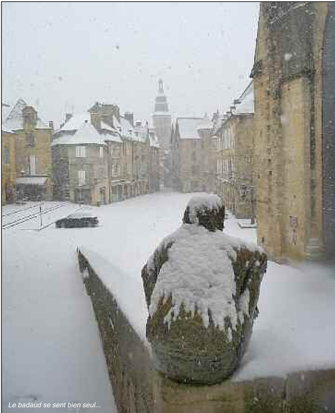
Le badaud se sent bien seul...

D imanche 5 février, la neige est tombée sur le Sarladais. Difficultés pour circuler, transports scolaires annulés, canalisations d'eau ou de gaz qui gèlent... Le froid se maintient et la neige n'est pas encore partie.