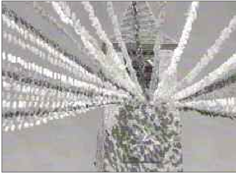
Le beffroi avait fière allure durant tout l'été