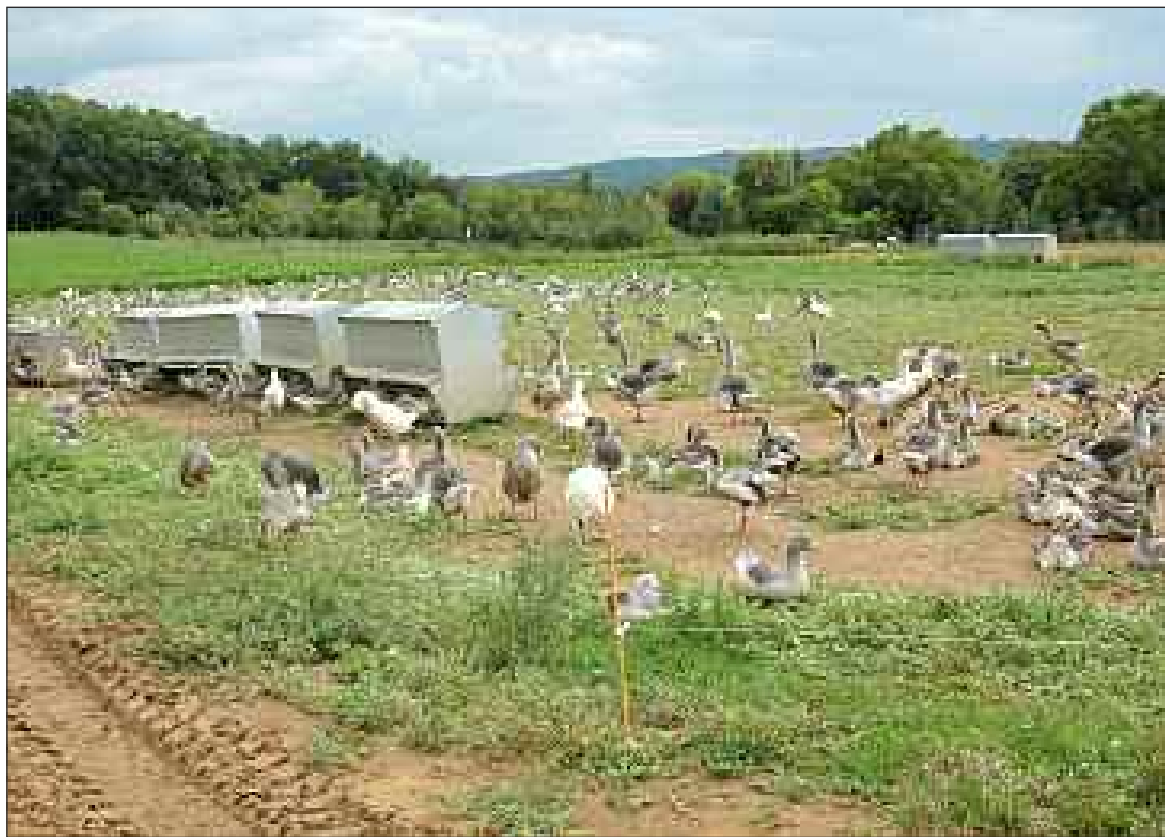
En juillet 2011, les oies de l'exploitation de Jean-Sylvain Thomas, éleveur à Prats-de-Carlux