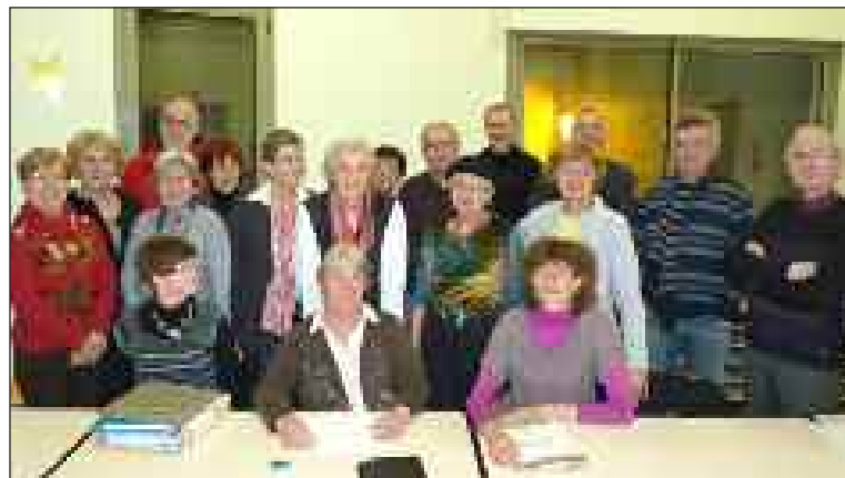
Des randonneurs au cœur gai