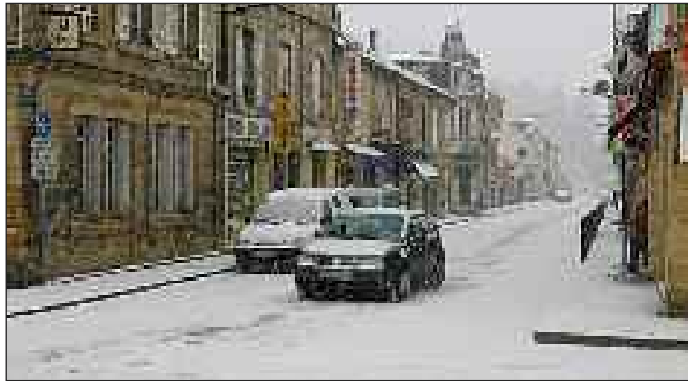
En une heure, dimanche matin, le centre de Sarlat a été recouvert de neige, comme ici avenue Thiers

Pendant la nuit du dimanche au lundi, la neige a durci avant de devenir glissante au petit matin. Des