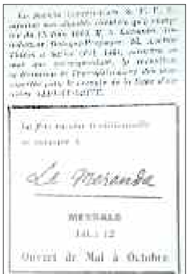
En lisant L'Essor Sarladais de l'époque...

L'association France Alzheimer Dordogne assure à Sarlat une permanence à l'Accueil de jour autonome d'Adrienne, au Colombier, rue Gaubert, le dernier mercredi du mois, de 10 h à 12 h. Tél. 05 53 27 30 34.