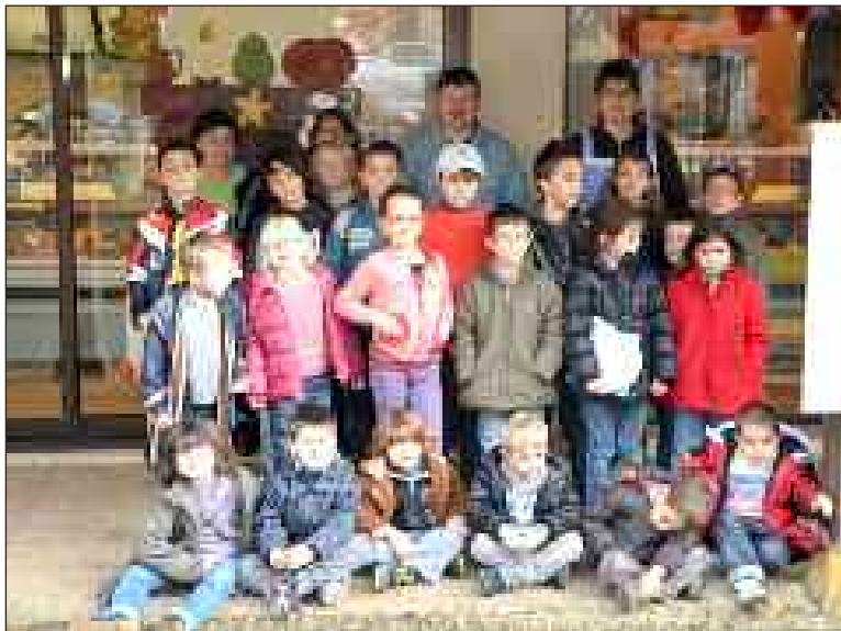
Découverte des métiers. Ici, les enfants chez le boucher à Castelnaud

Dans le cadre des traditionnelles rencontres intergénérationnelles, mardi 21 février les enfants de l'Accueil de loisirs de Saint-Rome, à Carsac-Aillac, fêtaient carnaval à la maison de retraite avec les résidents. Les enfants avaient préparé leurs masques et pris des cours de salsa, ainsi ont-ils pu donner un ton festif à la rencontre. Avec les animateurs, ils ont découvert aussi trois célèbres carnivals : Dunkerque, Venise et Rio.