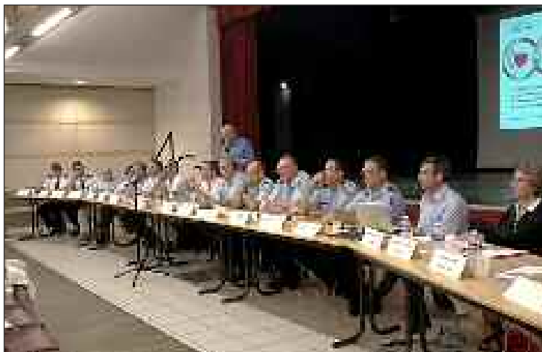
Lors du lancement en septembre