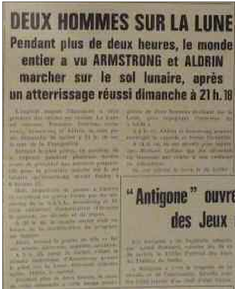
En juillet 1969, L'Information sarladaise annonce que deux Américains ont marché sur la Lune

Le 6 juin, L'ES annonce les résultats du premier tour. Parallèlement, la vie locale suit son cours. On apprend que l'institut médico-péda-