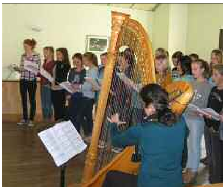
Un échange d'une grande intensité