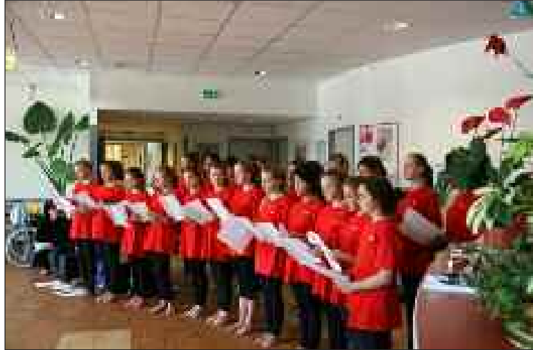
Les jeunes Anglaises lors de leur prestation