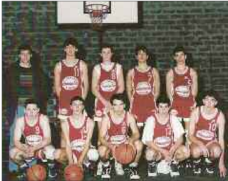
Minimes garçons 1994