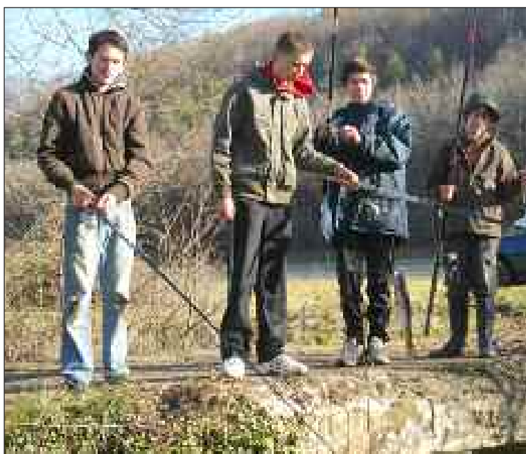
Du pont, les jeunes pêcheurs sortent les premières truites

Qui pourrait empêcher un pêcheur de faire l'ouverture ? Personne, et de plus ce samedi 10 mars le temps était de la partie avec un soleil généreux.