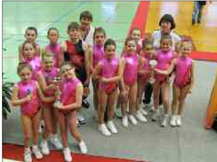
L'équipe 1 des poussines

Samedi 10 mars, les enfants de l'aérobic se sont rendus à Biganos, en Gironde, pour participer aux championnats de la zone Sud-Ouest.