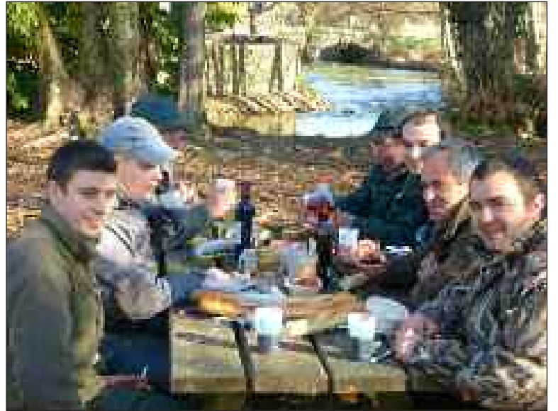
Les berges de la Nauze se prêtent aux pauses casse-croûte