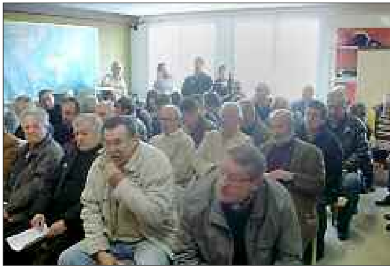
Une assemblée nombreuse et attentive

Début mars, comme tous les ans depuis plus d'un demi-siècle, l'Aéro-club du Sarladais (ACS) a tenu son assemblée générale.