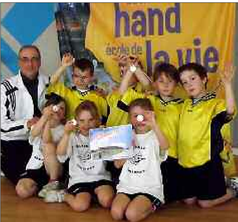
A Lalinde, les moins de 9 ans se sont bien défendus