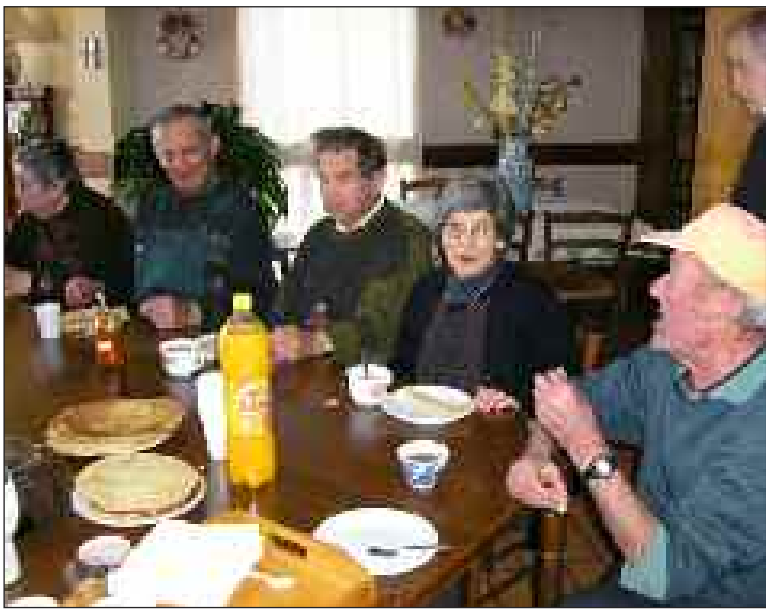
Les journées à thème permettent la réunion de tous ou presque tous les résidents