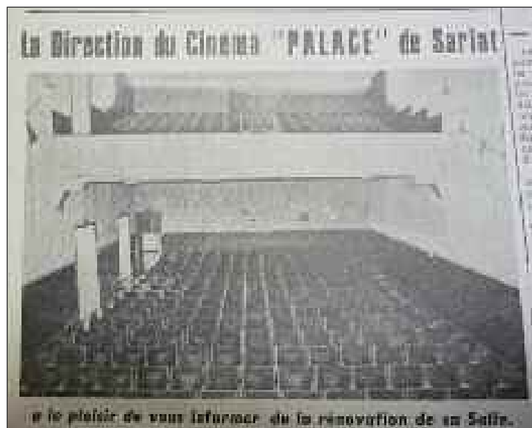
A cette époque, il passait encore des films coquins au Palace, boulevard Eugène-Le Roy à Sarlat

A Domme, le comité de soutien à François Mitterrand souligne que le candidat du PS est en tête dans huit des treize communes du canton. Le vendredi 8 mai, en plus des appels à voter Mitterrand, la Une de L'ES présente une photo de la nouvelle salle du cinéma Palace, rénovée.