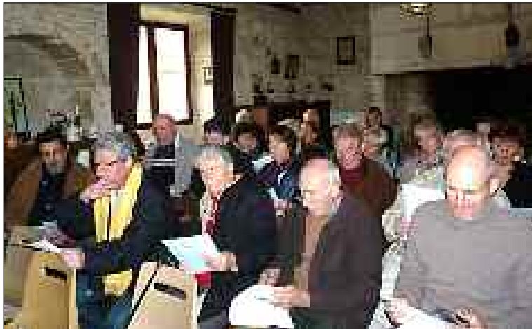
L'assemblée générale s'est déroulée dans la bonne humeur

L'association le Sentier des fontaines du village d'Eyvignes a tenu son assemblée générale le dimanche 4 mars.