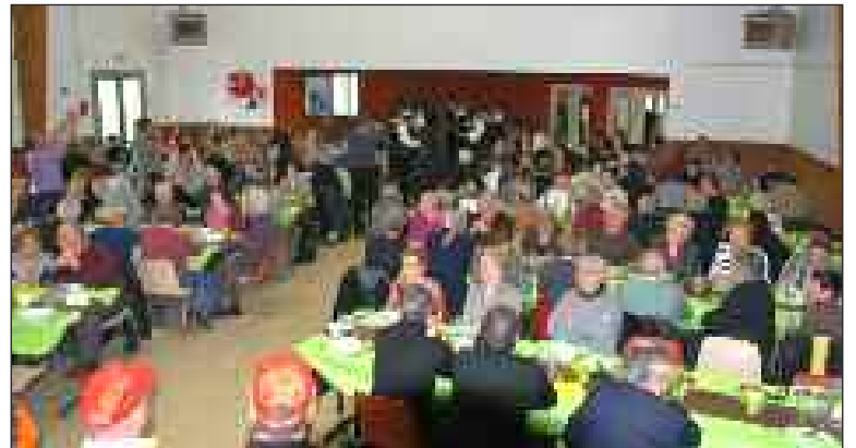
Les sonneurs des Echos du Pays d'Olt