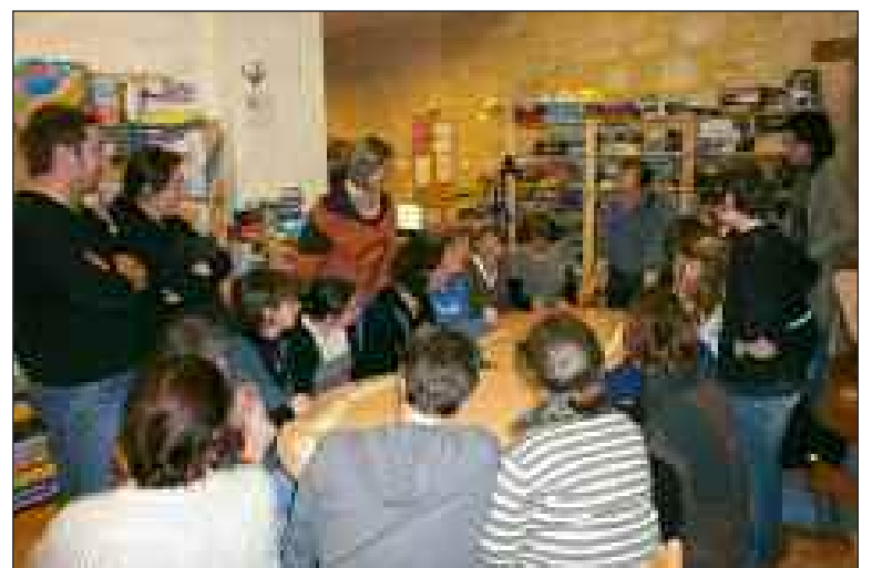
Tous les regards convergent vers le créateur de jeux