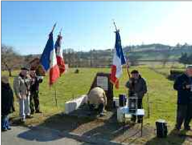
Dépôt de gerbe