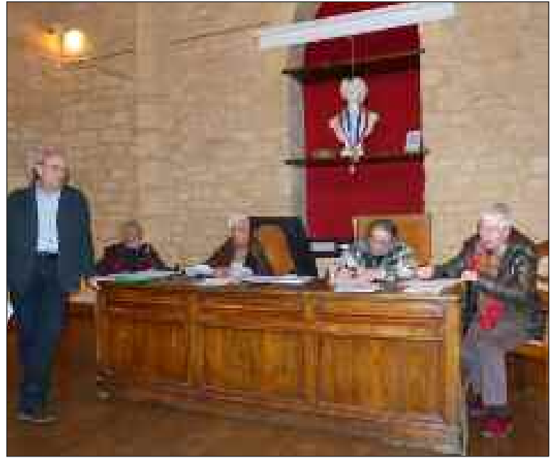
Le président, debout, et son bureau présentant le bilan

Vendredi 9 mars, l'association Les Musées de Belvès a tenu son assemblée générale et le lundi 12 son premier conseil d'administration de la nouvelle saison.