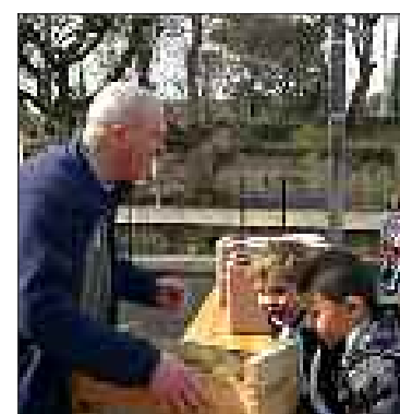
Petits pains et pomme pour le repas. Quant aux chocolatinnes du goûter, elles ont été d'autant plus appréciées

Pain, pain, pomme... Cela sonne comme une invitation. C'en était une pour les enfants du catéchisme de l'Ensemble pastoral du Périgord Noir conviés, le mercredi 7 mars, à participer à une journée d'animation de carême préparée par l'abbé Demoures.