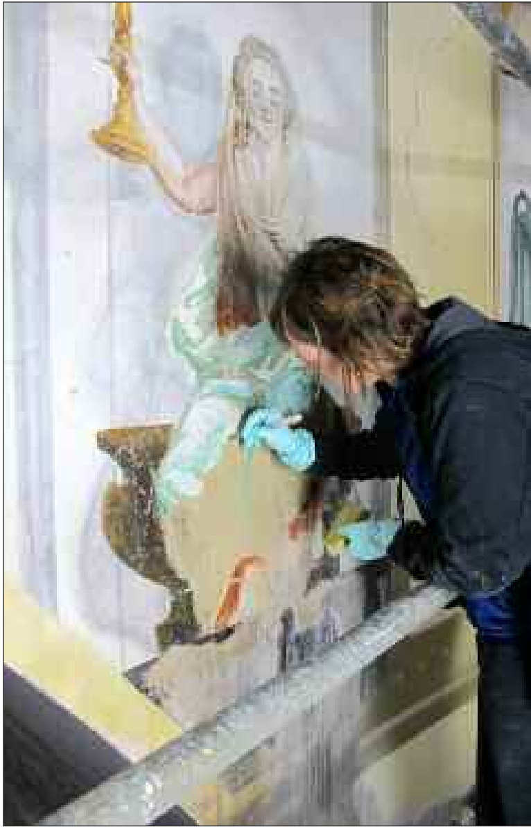
Les fresques sont en cours de restauration