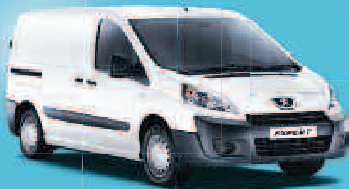
EXPERT HDi 90