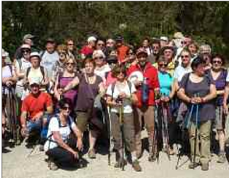
Belvésois et Aveyronnais réunis pour la photo souvenir

Surprise pour les quarante marcheurs des Sentiers d'Antan en arrivant dimanche 1 er avril sur le parking de Castelnaud : il y avait un groupe de randonneurs venus de Rodez. Après avoir marché la veille dans le secteur de Saint-Vincent-Le Paluel et passé une nuit réparatrice dans un gîte, ils avaient programmé la