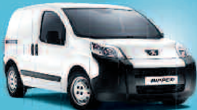
BIPPER HDi 70