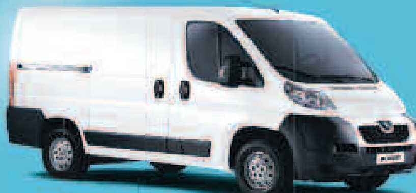
BOXER HDi 100