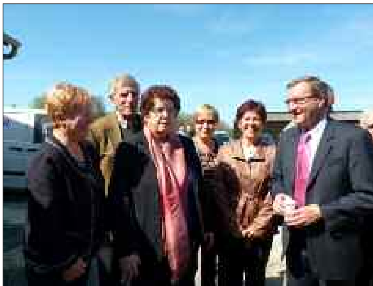
Le député Germinal Peiro est venu soutenir les revendications des retraités