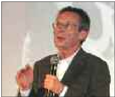
Patrice Leconte