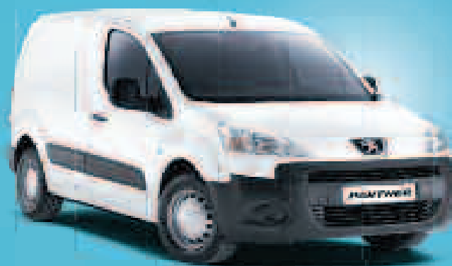
PARTNER HDi 75