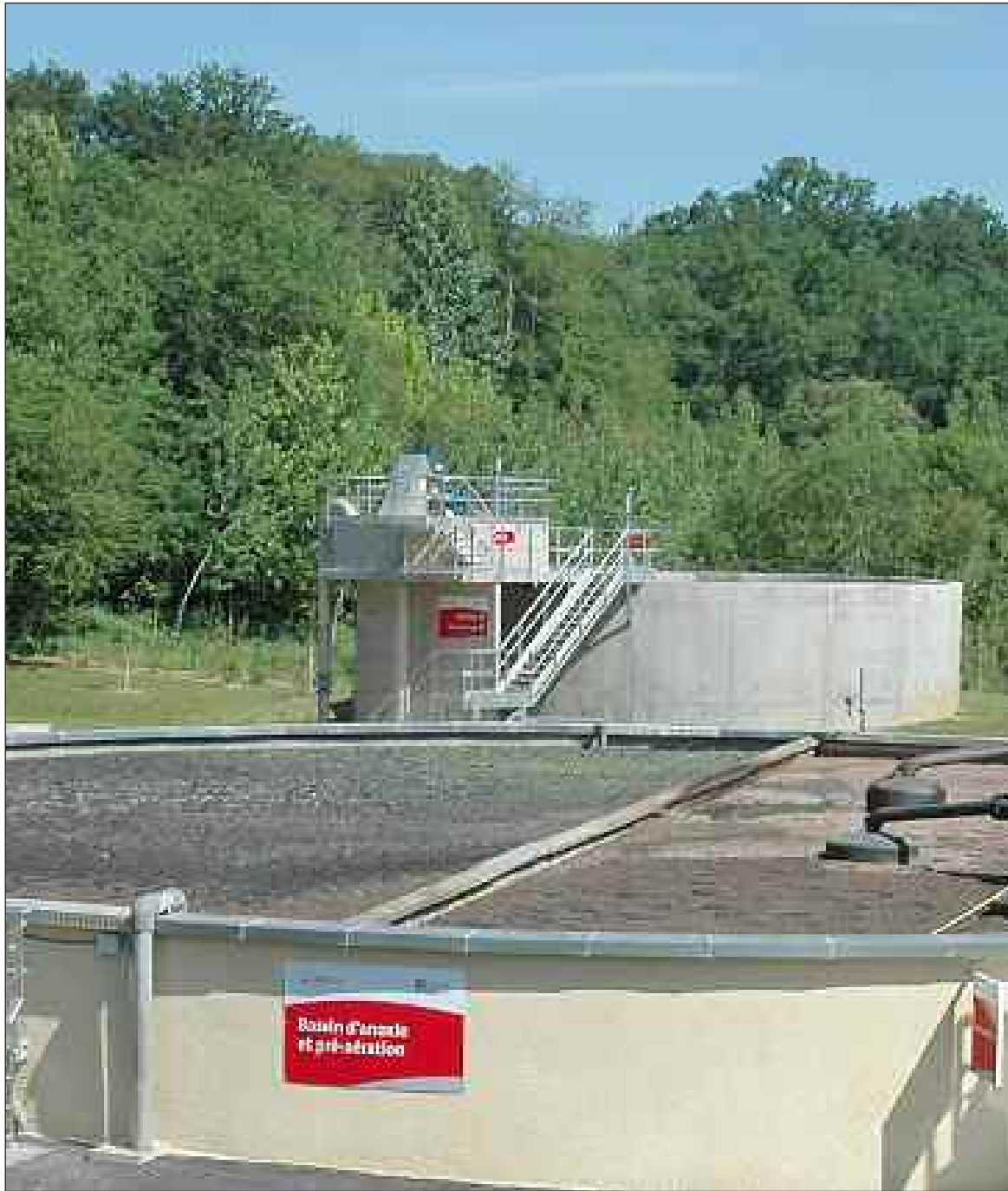
La modernisation de l'unité de dépollution des eaux située route de Vitrac a été accomplie en 2010. Les travaux ont été pris en charge par la commune et d'autres collectivités locales

Le conseil municipal de Sarlat a décidé de maintenir sa confiance à Veolia. Les débats furent vifs en séance. L'opposition s'appuie sur le récent rapport de la chambre des comptes pour critiquer fermement la gestion actuelle Lire page 3