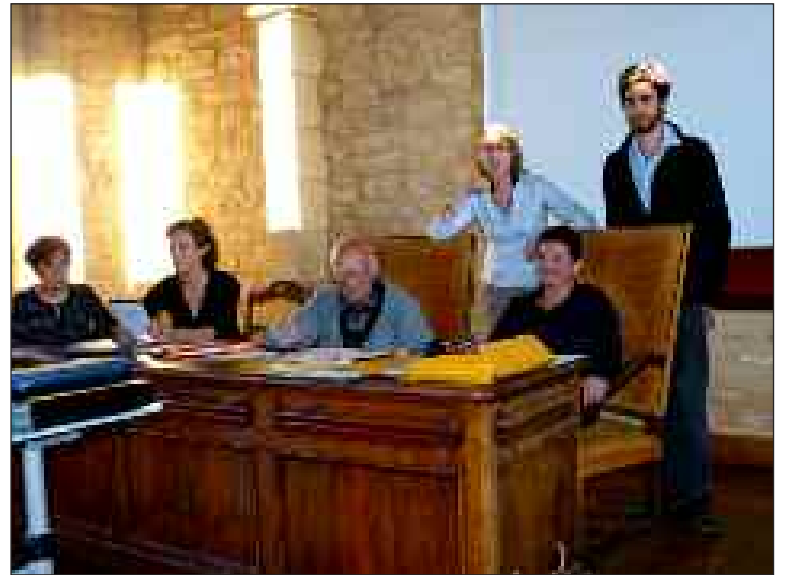
Les membres du bureau