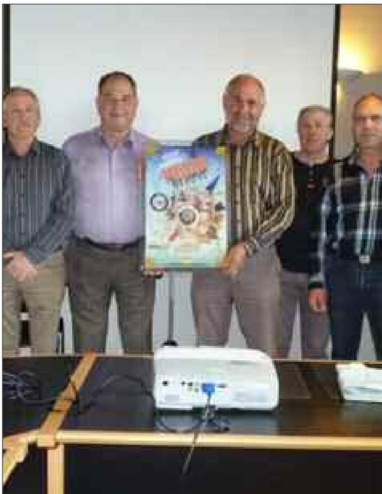
Le trophée présenté par les conseillers généraux est conservé par la municipalité toute l'année, de petites reproductions seront offertes aux vainqueurs