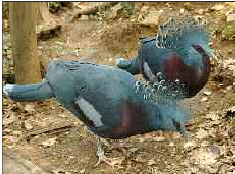
Voici Gougou et son acolyte, de l'espèce Goura de Victoria qu'il est possible d'admirer à la réserve