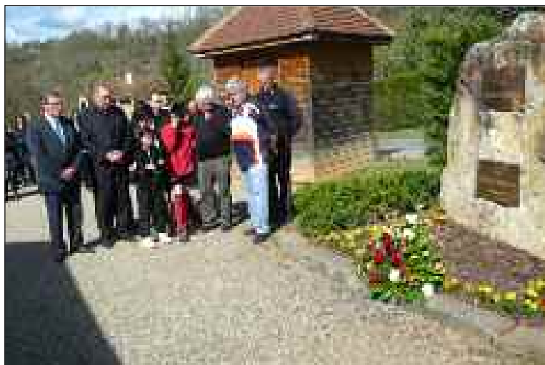
Lors de la cérémonie