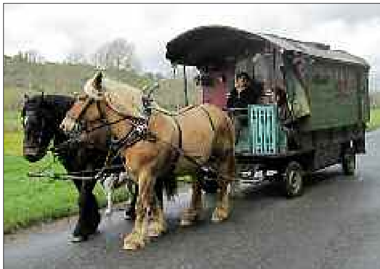
C'est parti pour la prochaine étape !