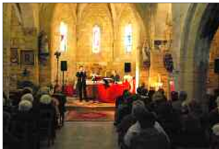
Tony Bram's interprétant l'"Ave Maria" de Gounod