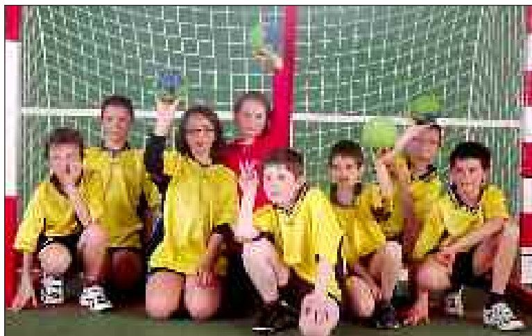
Les moins de 11 ans