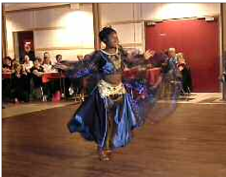
Démonstration de danse orientale