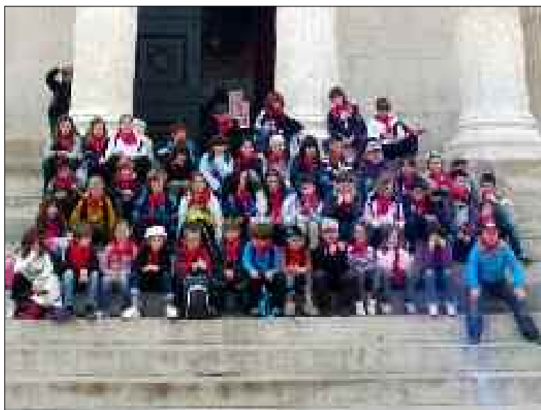
Les enfants devant la Maison carré, à Nîmes

Les écoliers ont effectué un séjour en Provence du 2 au 6 avril. Les thèmes au programme de la semaine étaient l'époque gallo-romaine, la littérature autour de Daudet et de Pagnol, ainsi que l'art avec la peinture de Van Gogh.