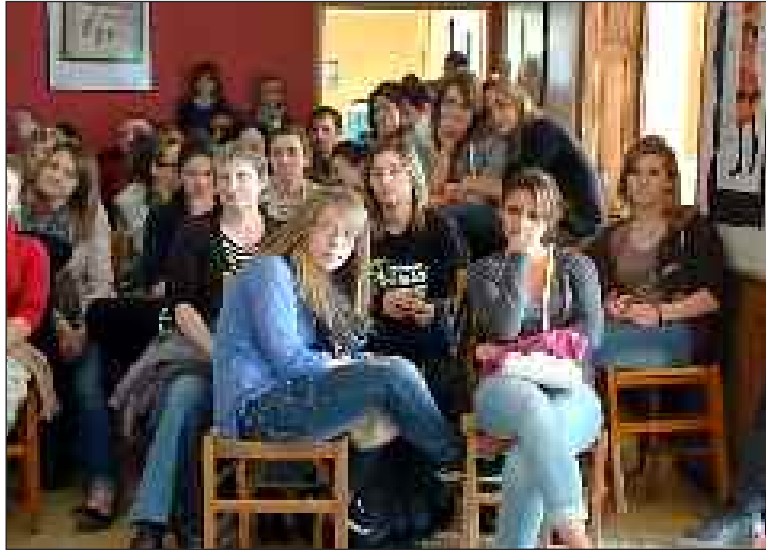
Les élèves et leurs familles réunies pour un compte rendu dynamique