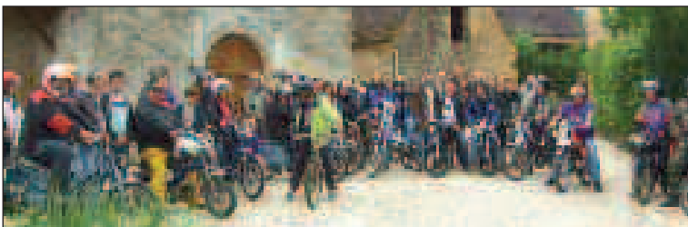
Une pause sur la place d'Orliac