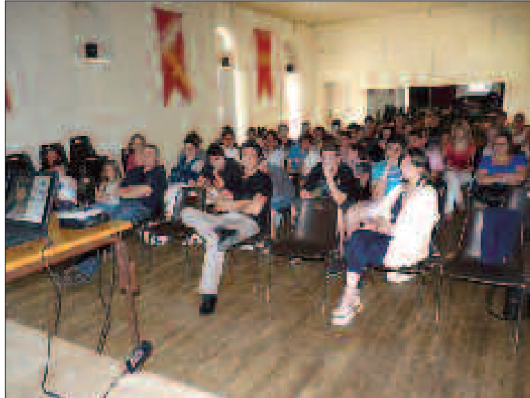
Facebook, les réseaux sociaux et le Web au cœur de la conférence de prévention