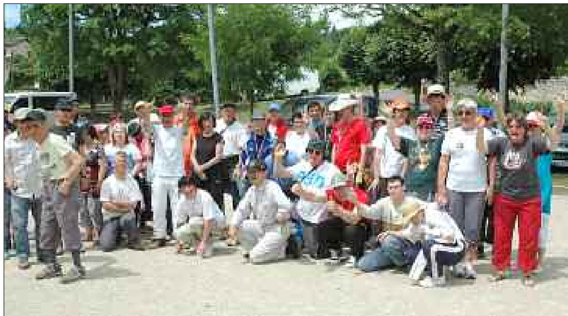
Les participants à la rencontre interétablissements après la remise des médailles

Une rencontre a réuni des établissements médico-sociaux venus de toute la Dordogne, mardi 5 juin au boulodrome de Sarlat