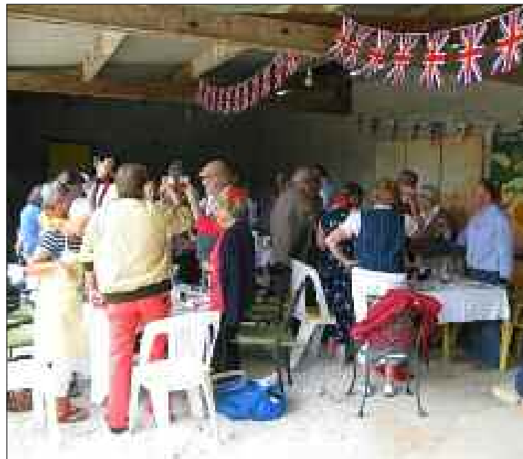
Les convives entonnant le "God save the Queen"