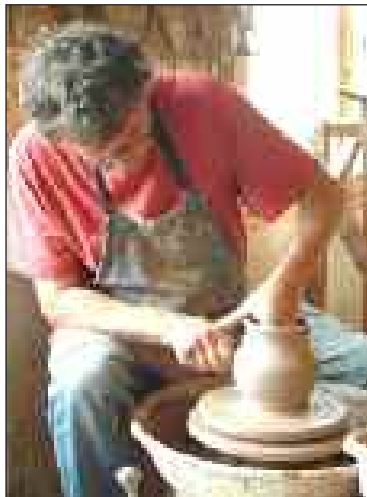
Tout est dans le geste !