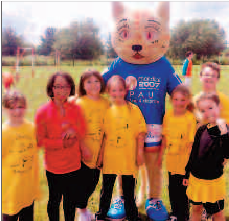
Les enfants de l'école de handball en présence de la mascotte Chabala

Dimanche 3 juin, une équipe mixte composée de trois moins de 9 ans et de quatre moins de 11 ans se déplaçait à Montpon-Ménéstérol pour disputer un tournoi amical de fin de saison.