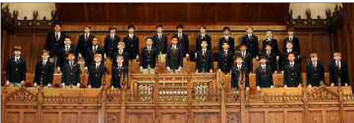
Le chœur de garçons de Fort Bend

Le Fort Bend Boys Choir du Texas, Etats-Unis, se produira en concert à la cathédrale Saint-Sacerdos le dimanche 17 juin à 17 h.