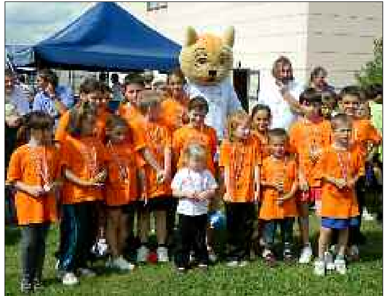
Les jeunes Belvésois en compagnie de la mascotte

Dimanche 3 juin, le Handball-club Pays de Belvès a été représenté par trois équipes au tournoi sur herbe Viens jouer avec nous organisé à Montpon-Ménéstérol.