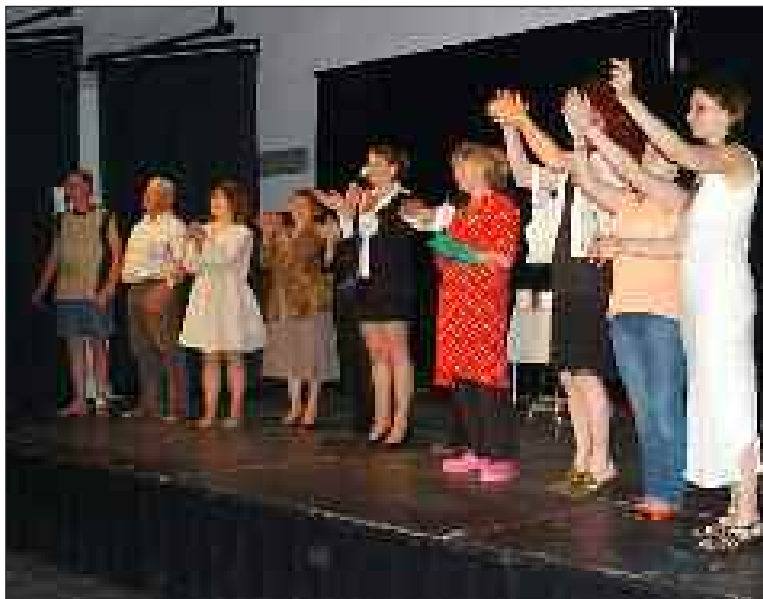
Les artistes sous les applaudissements

La troupe des Arpets de l'Amicale laïque montera de nouveau sur scène le samedi 9 juin à 20 h 30, dans le cadre du Pôle intergénérationnel. Si vous avez manqué la première représentation samedi 2 juin, vous pourrez donc bénéficier de cette séance de rattrapage !