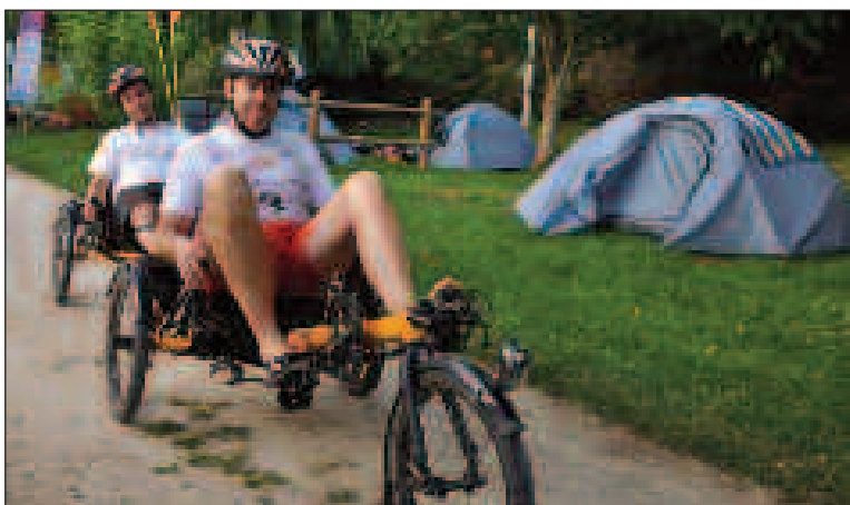
Tandem à cinq roues