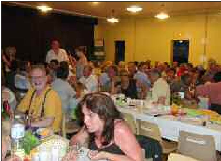
La salle se garnit peu à peu