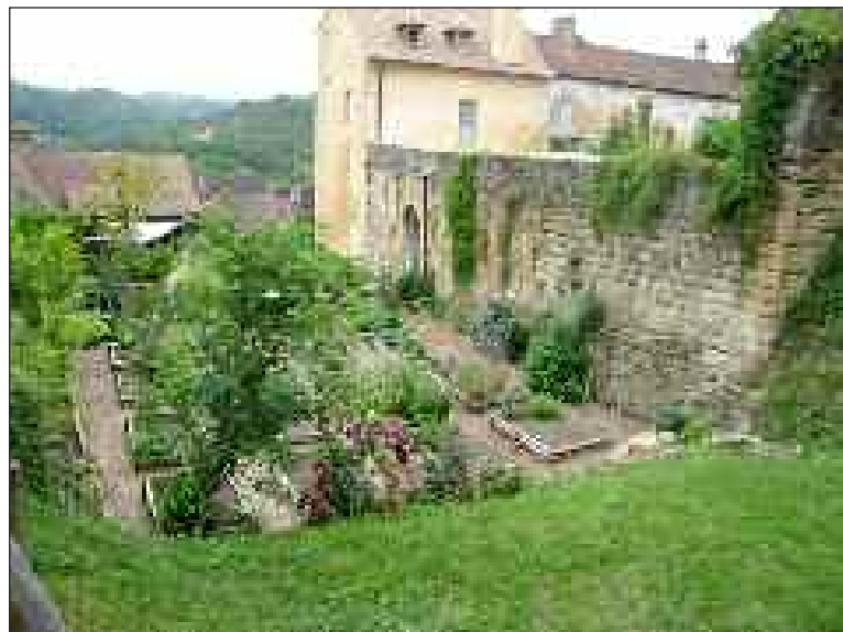
Possibilité de visiter le jardin médiéval