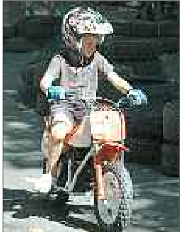
Un garçon sur une minimoto sur le circuit du Moto-club sarladais