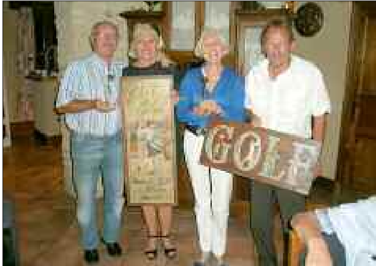
Les gagnants du trophée au cours de la soirée qui a suivi