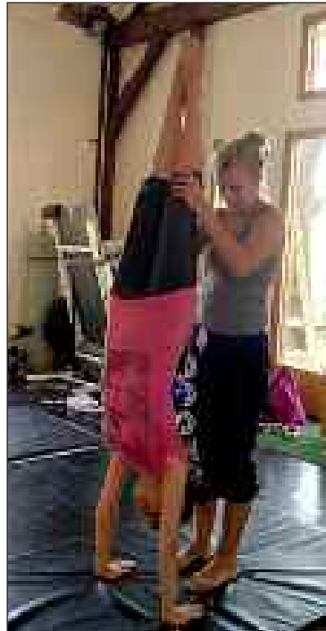
Lors du dernier stage ados

Basée à Alles-sur-Dordogne, la compagnie de cirque Generating Company (GC) propose des cours en direction de différents publics. De septembre à juin, pour les jeunes artistes de cirque, les mercredis de 14 h à 15 h 30 pour les sept-onze ans et de 15 h 45 à 18 h pour les douze-seize ans.