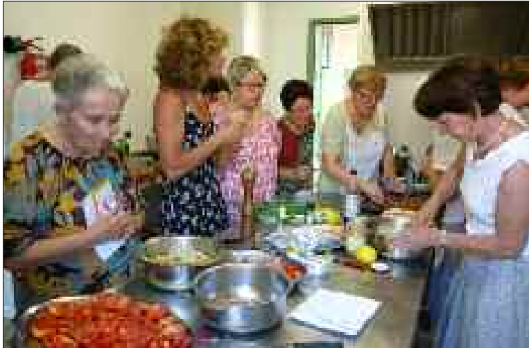
Les "Pourelècheres apéritives" se préparent gaiement

Le week-end consacré à la rencontre des géographes, initiée par l'association Associations des géographes du Pays de Salignac (AGPS), est désormais un rendez-vous incontournable pour les géographes, les producteurs locaux, tous les acteurs du terroir et ceux qui, en simples consommateurs, s'intéressent à ces sujets.