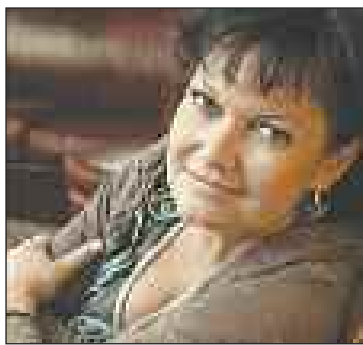
Maurane sera salle Paul-Éluard le 12 octobre