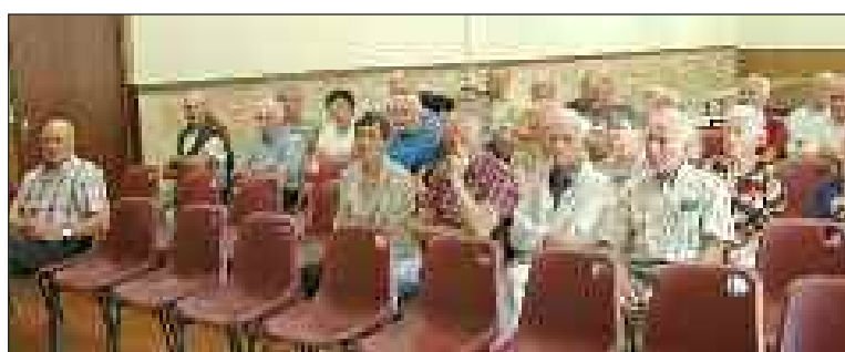
Les retraités agricoles rassemblés à la salle des fêtes de Vézac

Les retraités agricoles du canton de Sarlat se sont réunis à Vézac. Leurs revendications : la hausse des pensions et la parité hommes-femmes