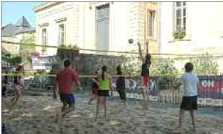
Une partie de beach-volley devant le Palais de justice