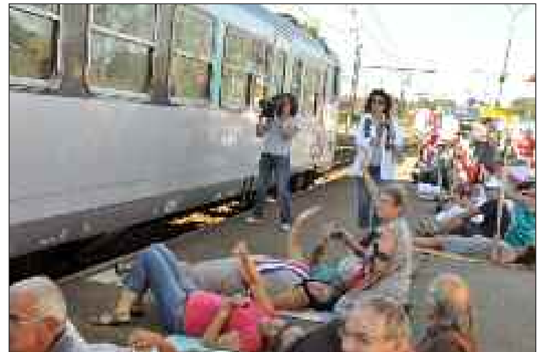
Des manifestants couchés sur le quai ; quelques élus étaient présents

A l'appel de l'association Tous ensemble pour les gares de Gourdon et Souillac, quelque cent quarante manifestants se sont retrouvés le vendredi 7 septembre sur le quai, dans la bonne humeur et, pour certains, dans la joie des retrouvailles, debout, assis, couchés sur le ventre, sur le dos ou sur le côté, vivants, morts-vivants, parfois le tout à la fois. Ils ont vu s'arrêter le TER Cahors-Brive et les deux intercitys dont l'existence pour le premier et l'arrêt pour les deux autres ont été arrachés à la SNCF par l'action de l'association. A noter la présence