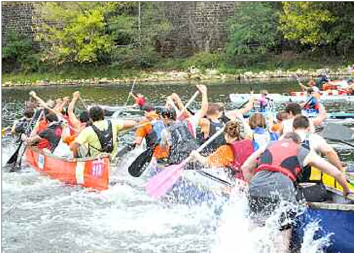
Lors du Marathon 2011

Du monde est attendu sur la rivière les 22 et 23 septembre entre Saint-Julien-de-Lampon et Castelnau-La Chapelle.