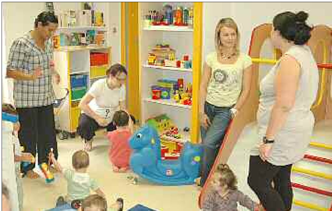
Au local d'1, 2, 3... Soleil, les enfants et leurs parents sont accueillis