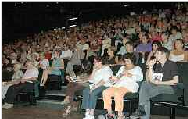
De nombreux amateurs de culture se sont déplacés pour assister à la présentation de la saison

Le Centre culturel fait sa rentrée en accueillant Mino Mushi, spectacle pour les scolaires, le 9 octobre, puis Maurane, le 12 octobre