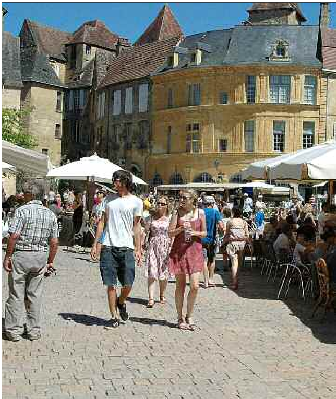
Place de la Liberté, à Sarlat, fin juillet 2012