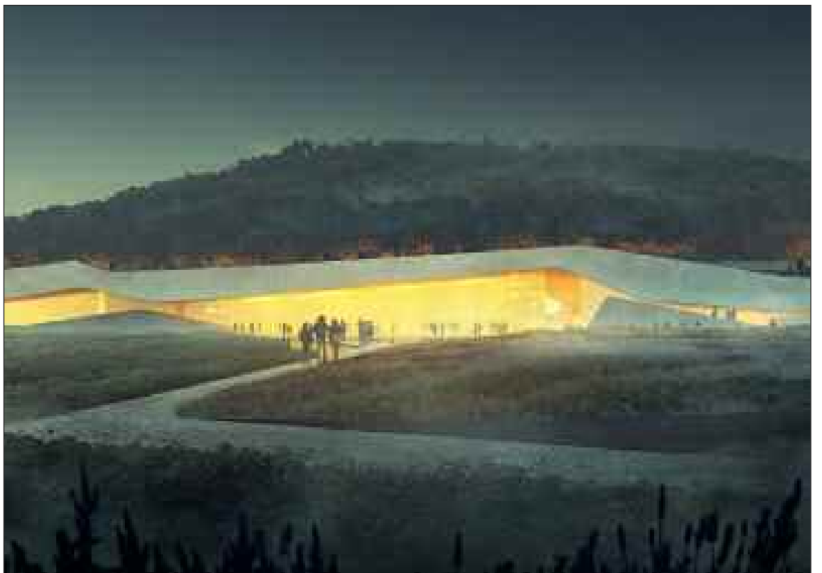
Un aperçu du projet retenu