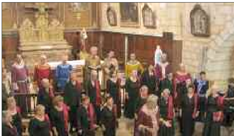
Chœur d'hommes Saint-Jean-de-Rila avec le chœur de femmes Si on chantait en l'église de Domme le 13 août