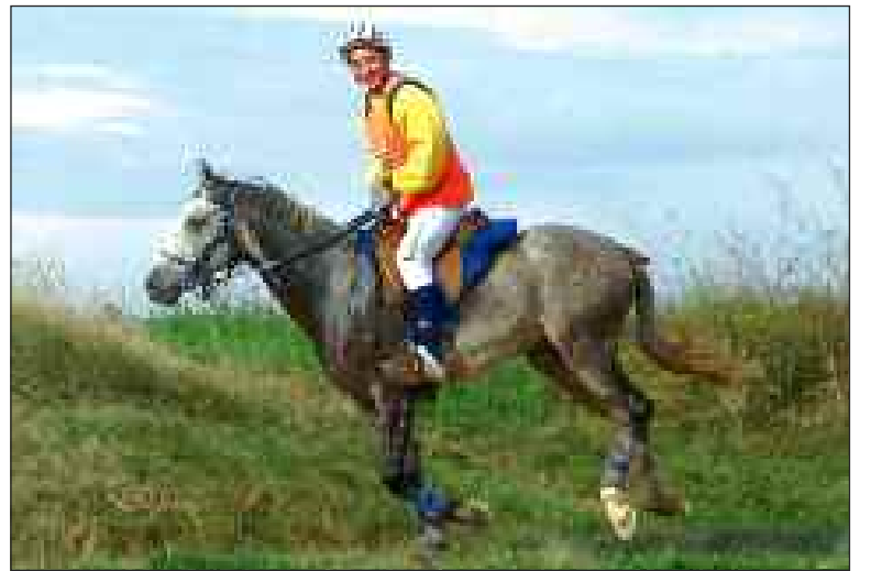
Alexis sur Danseur, excellents

Trois cavaliers du centre équestre de Castelnaud-La Chapelle ont disputé le championnat de France d'endurance jeunes chevaux à Uzès, dans le Gard. Ils concouraient parmi huit cents cavaliers venus de tout l'Hexagone. Le site réunissant six mille personnes.