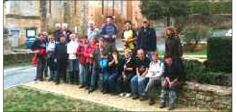
Le groupe devant l'abbatiale de Paunat