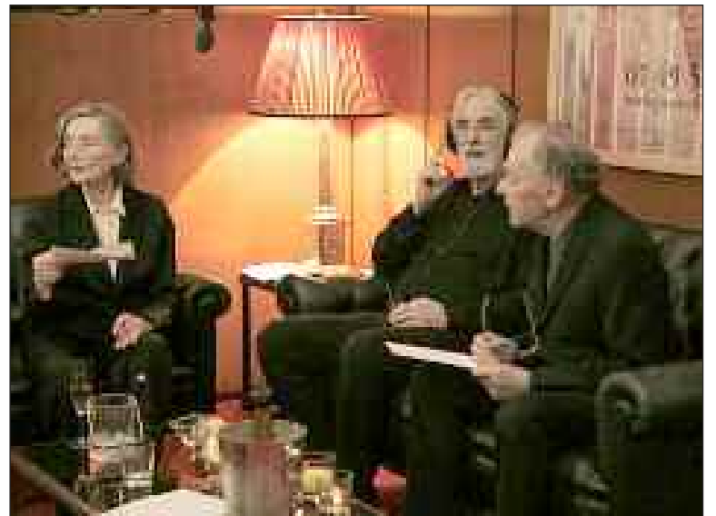
Emmanuelle Riva, Michael Haneke et Jean-Louis Trintignant

Les Amis du cinéma présentent, mercredi 31 octobre à 19 h au cinéma Rex, le film de Michael Haneke : "Amour".