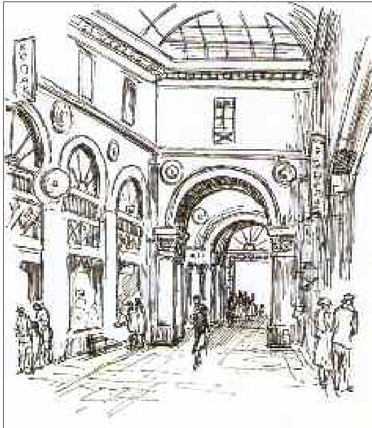
Gironde. Bordeaux. Intérieur des galeries bordelaises

Ces croquis ont en effet été réalisés par Lucien de Maleville dans le cadre de ses fonctions de recenseur des Monuments historiques de l'Aquitaine de 1942 à 1963, région où il a réalisé près de 1 300 croquis