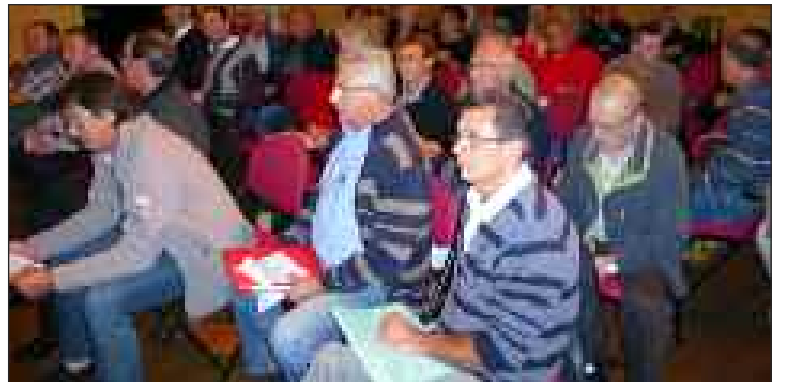
Tous les responsables des différents secteurs de l'organisation étaient présents

Vendredi 19 octobre, le Club athlétique belvésois (CAB), organisateur des 100 km du Périgord Noir, a tenu son assemblée générale.