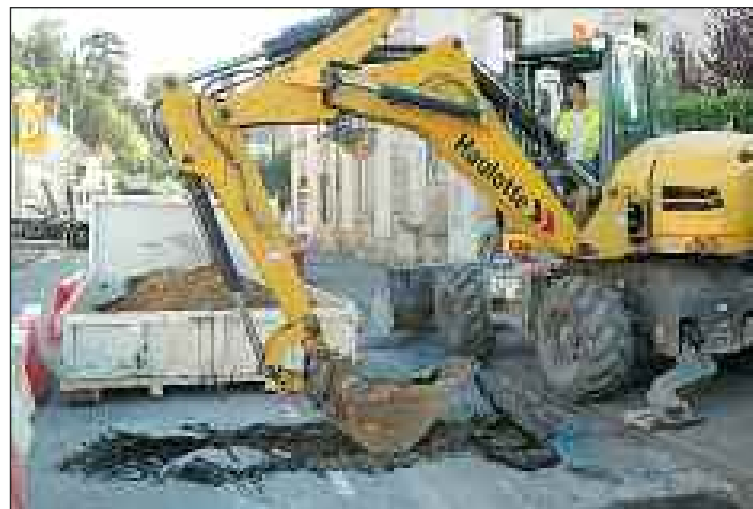
Pendant les travaux de requalification urbaine des avenues Aristide-Briand et Thiers, les entreprises veillent à ne pas entraver la circulation...