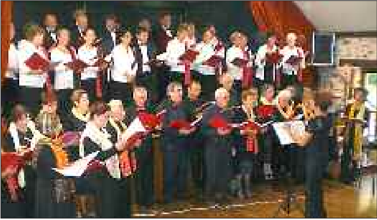
Lors de sa prestation à Vigeois, en Corrèze