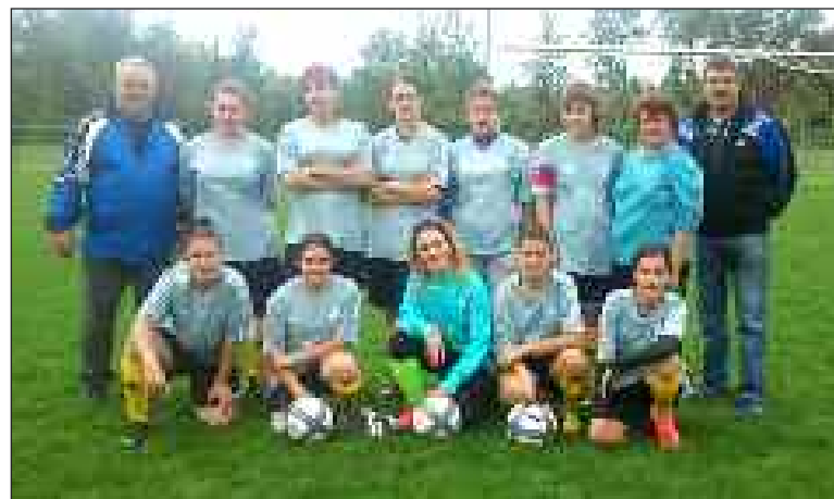
L'équipe féminine mérite d'être encouragée