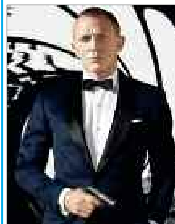
SKYFALL James Bond 007