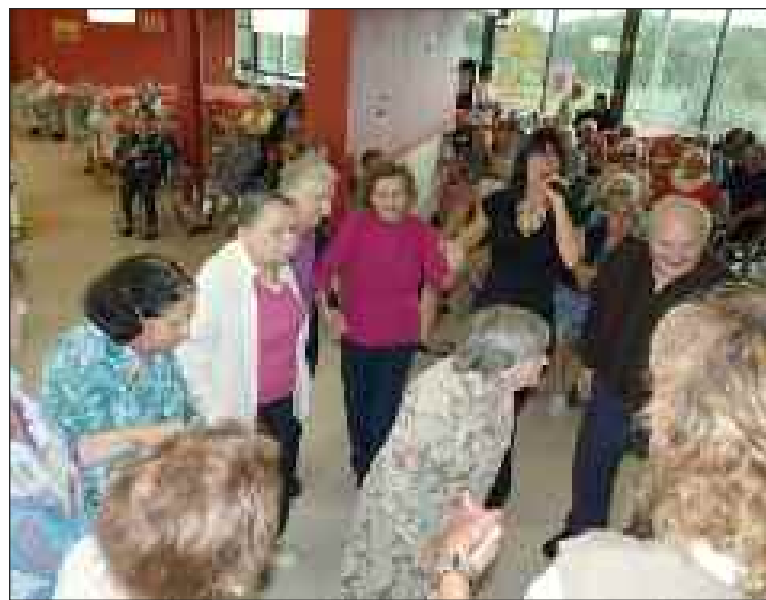
Les résidents ont aimé chanter et danser