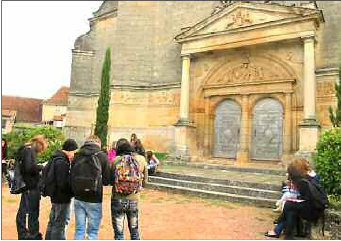
Les lycéens devant le portail d'entrée de l'église