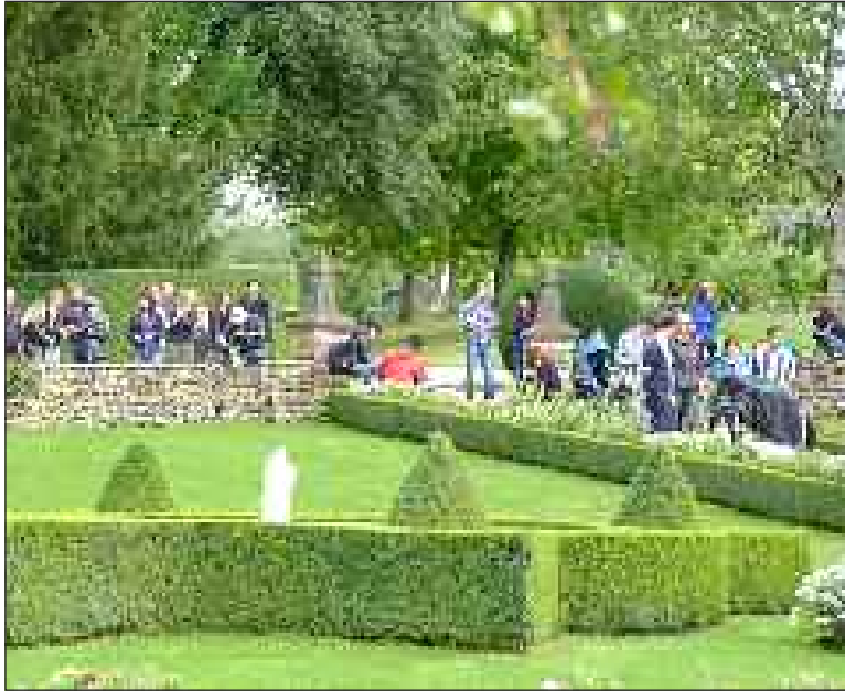
Le public a pu assister au tournage