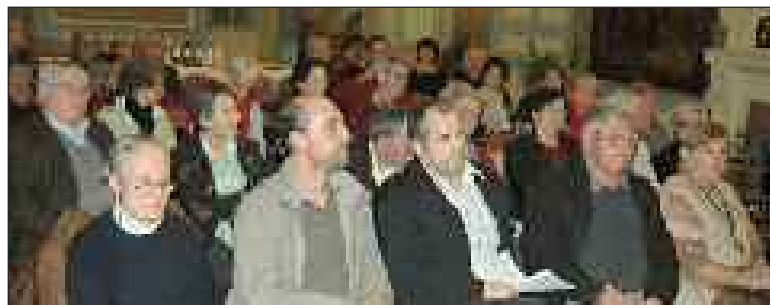
Les participants à l'assemblée générale, parmi lesquels les adhérents, qui contribuent au bon fonctionnement du Festival

L'assemblée générale a eu lieu le 19 novembre