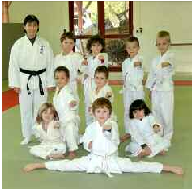
Les enfants sont initiés depuis le mois de septembre