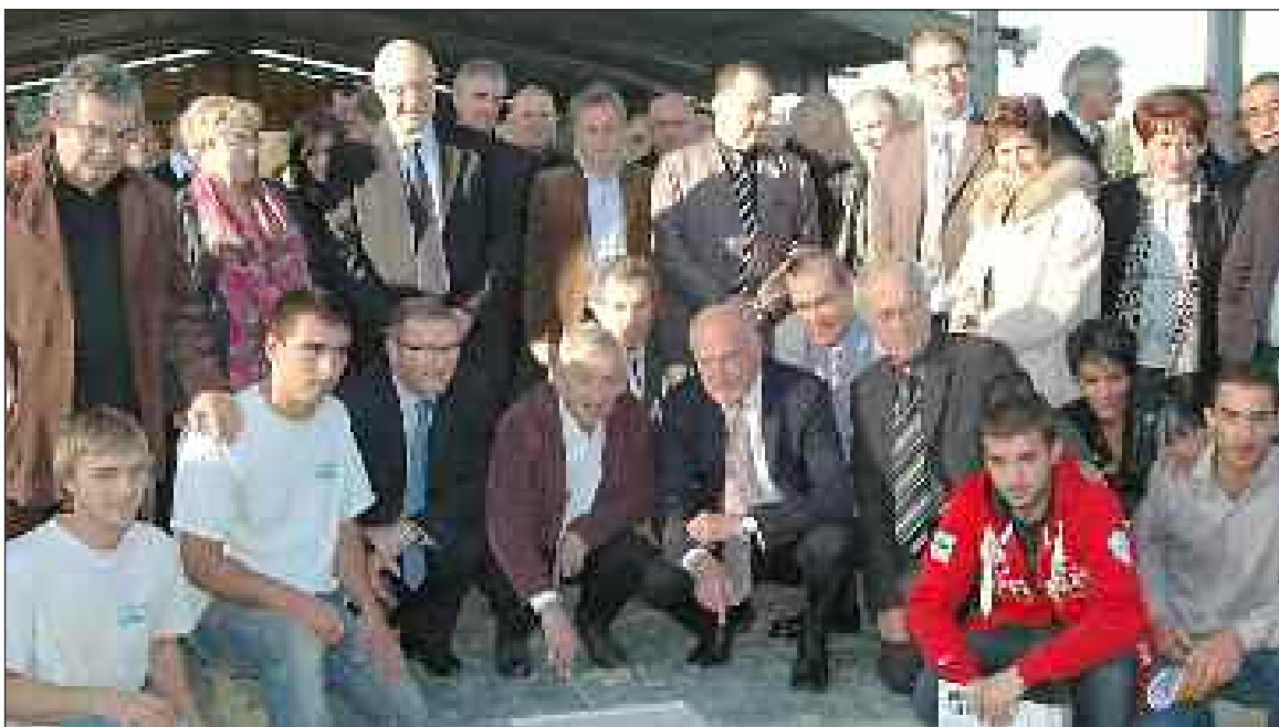
Jean-Jacques de Peretti et Alain Rousset ont symboliquement posé la première pierre, entourés d'élus, de représentants de l'État, des patrons et des premiers stagiaires du titre professionnel Maçon du bâti ancien

Le président de Région a posé la première pierre le 16 novembre