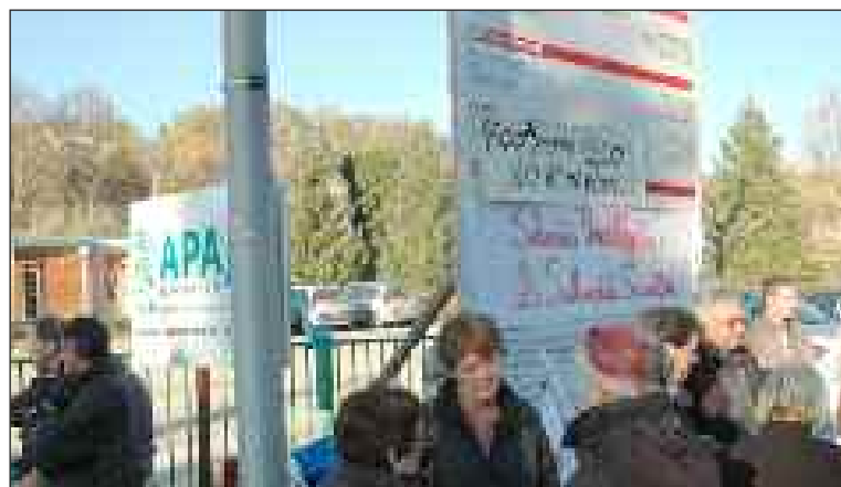
Le 22 novembre, environ quatre-vingts personnes se sont retrouvées devant le siège de l'Apajh