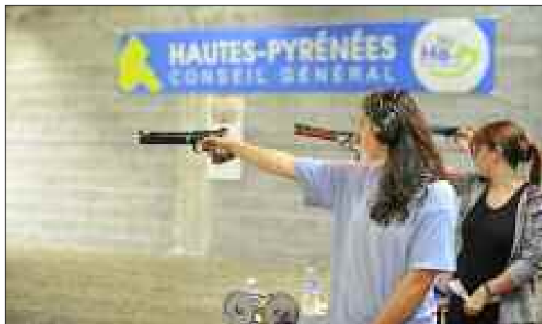
ISSF circuit national : les Cigognes, Tarbes