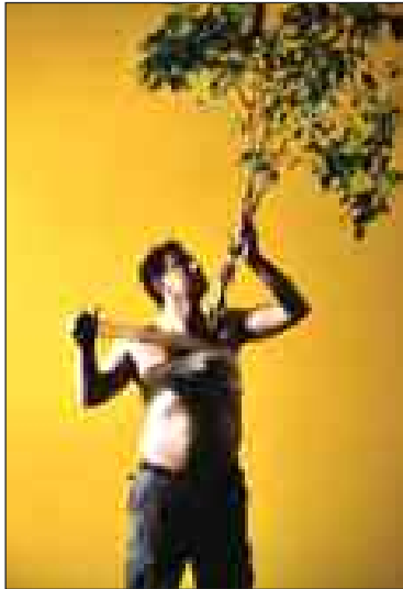
"Scènes de chasse au sanglier"

Ce festival de cinéma documentaire se déroulera du 30 novembre au 2 décembre.