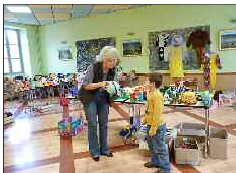
Les enfants ont eux aussi fait des achats !

Les colis alimentaires sont également distribués aux personnes en difficulté les deuxième et quatrième mercredis du mois au Pôle des services publics. Ces mercredis sont aussi ouverts aux personnes qui veulent faire des dons tout au long de l'année.