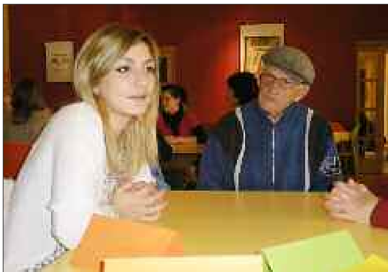
Un échange qui crée du lien