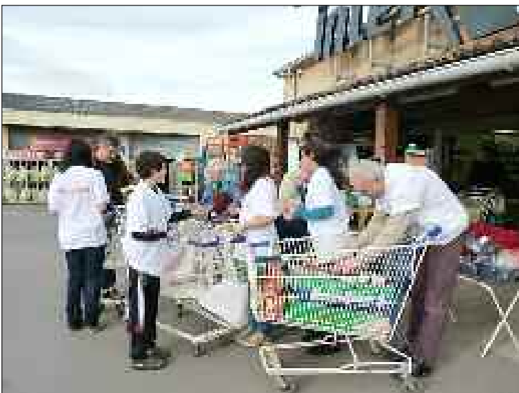
Des jeunes très motivés