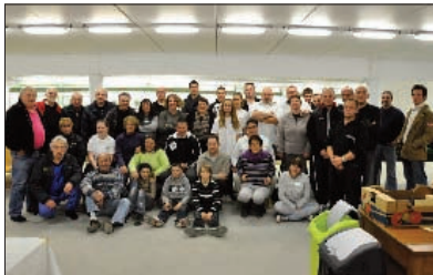
Les tireurs de Dordogne : STPN, STHT, ATS, STP et ATB

Dimanche 25 novembre, les membres du Sarlat tir Périgord Noir participent au championnat départemental des clubs ISSF 10 m pistolet et carabine à Tourtoirac.