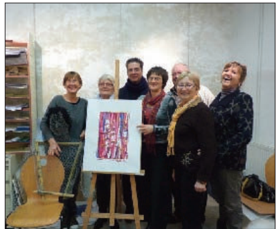
Les joyeux artistes de l'atelier