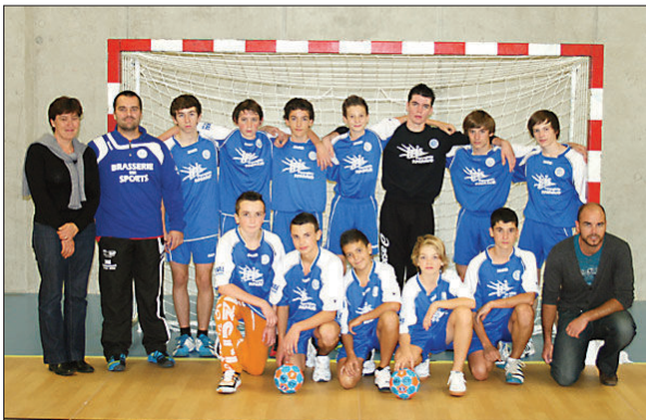
L'équipe des moins de 15 ans

Durant la seconde partie, les bleus restent concentrés et ne cessent de communiquer entre eux pour trouver la meilleure stratégie à adopter. Les marquages sont à égalité