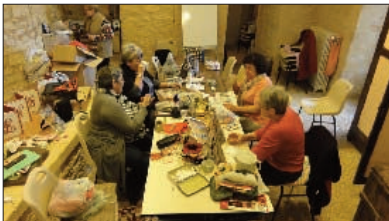
Pendant les ateliers de l'Hyronde grosse activité rime avec détente et convivialité

Les préparatifs vont bon train à l'association l'Hyronde pour organiser le Téléthon les 8 et 9 décembre.