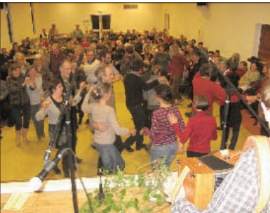
Tout le monde est entré dans la danse