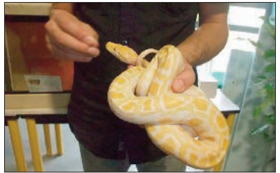
Un python moulure albino