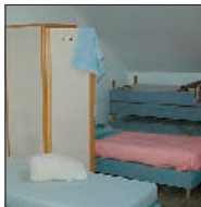
Le docteur des hommes se situe à l'étage

Les locaux sont mis à disposition par la commune, qui paie aussi les frais en énergie. L'Atelier devrait déboursé 60 000 € pour assurer le fonctionnement du centre cet hiver. L'association est aidée financièrement par l'Etat et des collectivités. GB