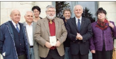
Les membres du jury du grand prix Périgord de littérature

A Archignac, l'aventure des rencontres avec les auteurs périgourds, commencée en 1999 par l'équipe du Foyer rural, se poursuit.