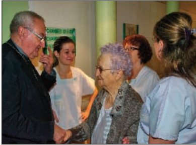
Une résidente âgée de 99 ans a invité l'évêque à venir fêter son centième anniversaire