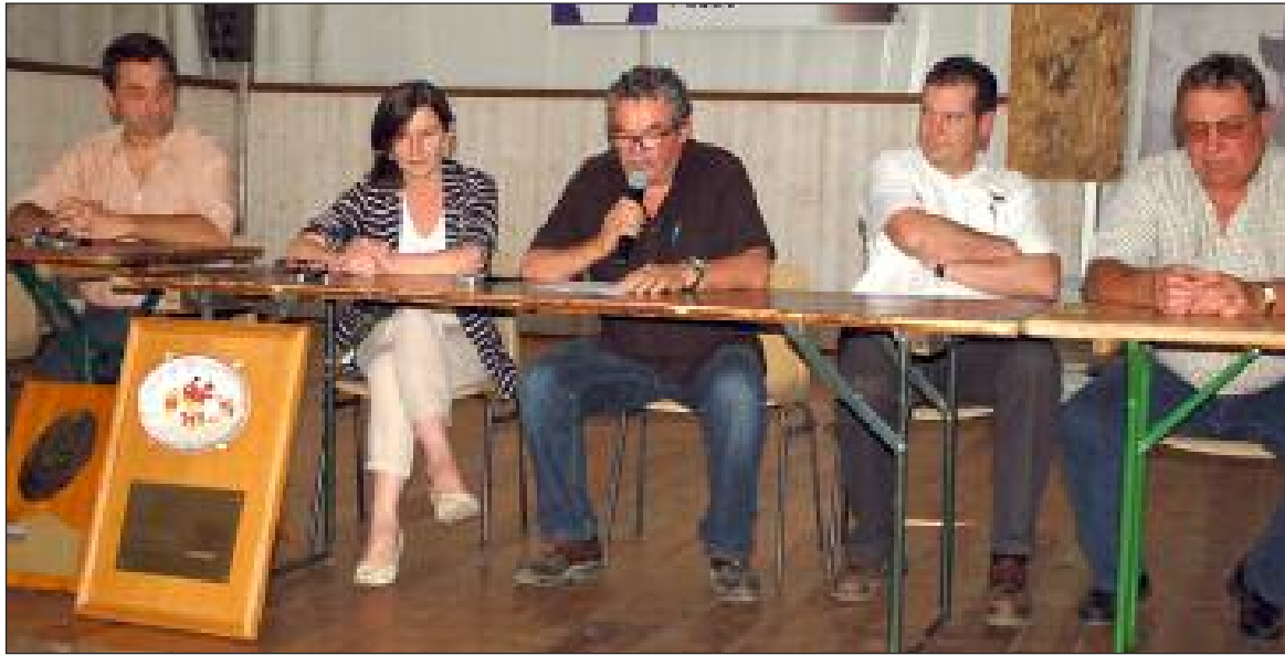
Une vue de la tribune