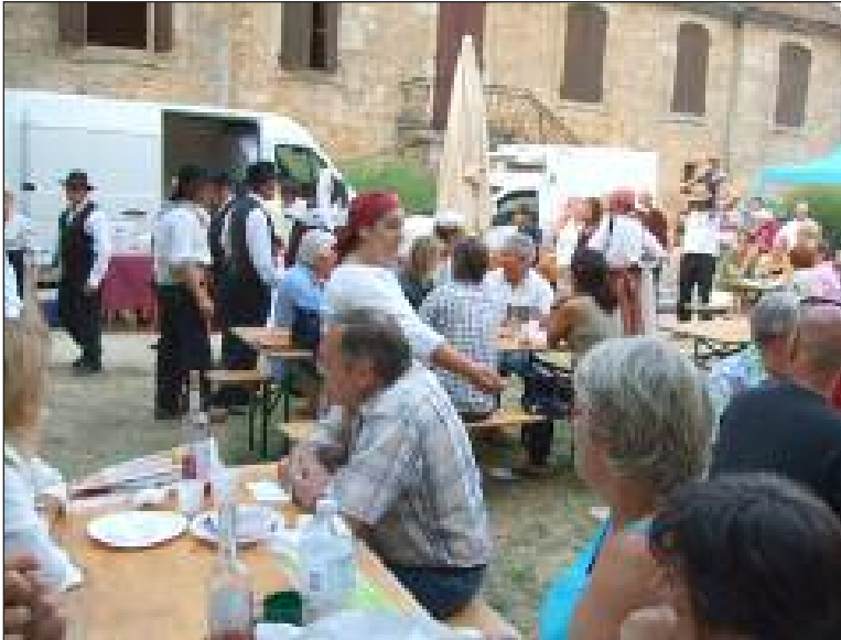
Un rendez-vous qui attire du monde