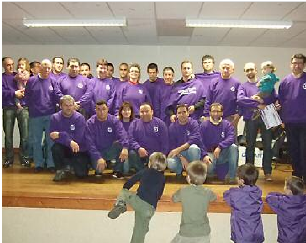
Une équipe de dirigeants pour préparer la prochaine saison