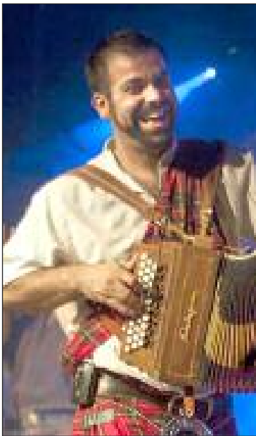
Uberet sur scène, une envie folle de taper des pieds et des mains

La musique celtique est universelle, elle est un peu la mère de tous les styles, elle ne peut que toucher les gens car elle a une âme, quelque chose de ressenti par les gens. Ce mélange en pays d'oc correspond bien à la démarche de brassage des cultures prônée par l'Amicale laïque andrésienne qui proposera ainsi sa deuxième Nuit celtique le samedi 20 juillet.