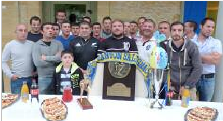
Une équipe solide qui récolte les fruits de son plaisir et de ses efforts