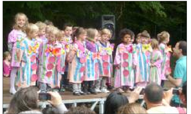
Les enfants de la maternelle