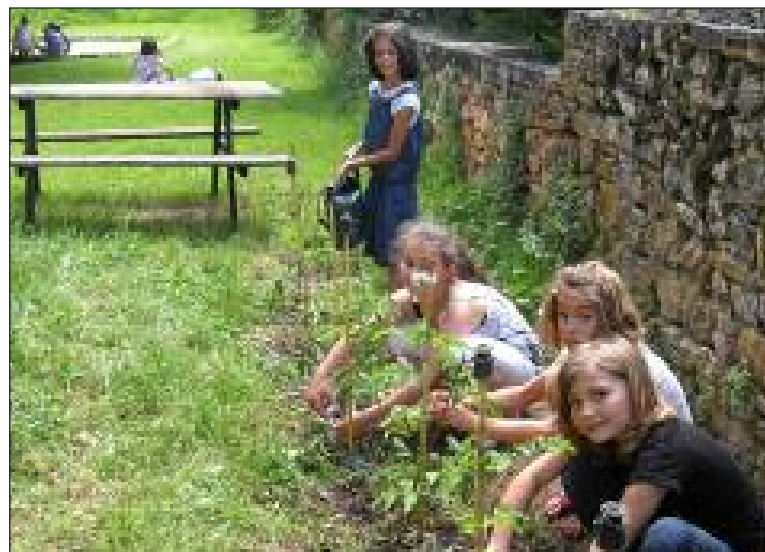
Les plants demandent beaucoup de soins...

Finalement, tous ces enfants ont hâte du résultat et des retrouvailles. Vivement la rentrée !