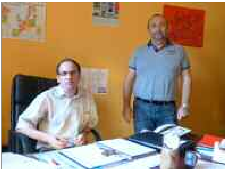
MM. Taulu et Maradènes

Lundi 2 septembre, principal et principal adjoint ont fait leur première rentrée à Pierre-Fanlac. Tous deux sont des Périgourdiens, il s'agit donc d'une équipe de pays qui connaît bien le terrain.