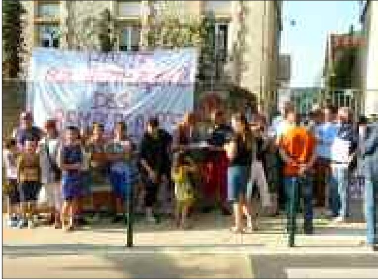
Les parents se sont rassemblés devant l'école et ont signé une pétition

Depuis le mois de juin, les parents d'élèves n'ont cessé de se battre pour dénoncer un dysfonctionnement dans les règles de mutations des remplaçants ; une action pour protéger le bon fonctionnement de leur école mais qui se veut beaucoup plus large. Au départ il s'agit de l'affectation dans une autre école d'un professeur d'école, qui, en remplacement d'une collègue titulaire en congé de longue durée, a exercé l'année écoulée à Siorac et, s'étant investie dans le projet d'école et donnant une grande satisfaction