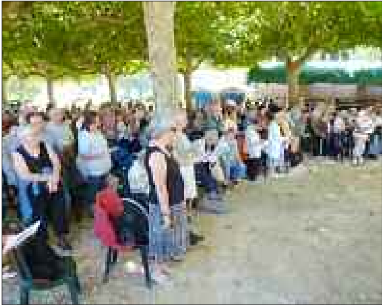
Une foule dense bien regroupée sous les ombrages

La neuvaine du pèlerinage diocésain de Notre-Dame de Capelou a débuté le 2 septembre.