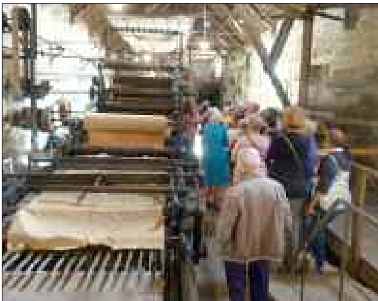
Les visiteurs très intéressés par la fabrication du papier à la papeterie de Vaux

Toutes les conditions étaient réunies ce dimanche 1 er septembre pour une belle sortie découverte : le beau temps, des sites magnifiques, un bon repas et bien sûr la bonne humeur.