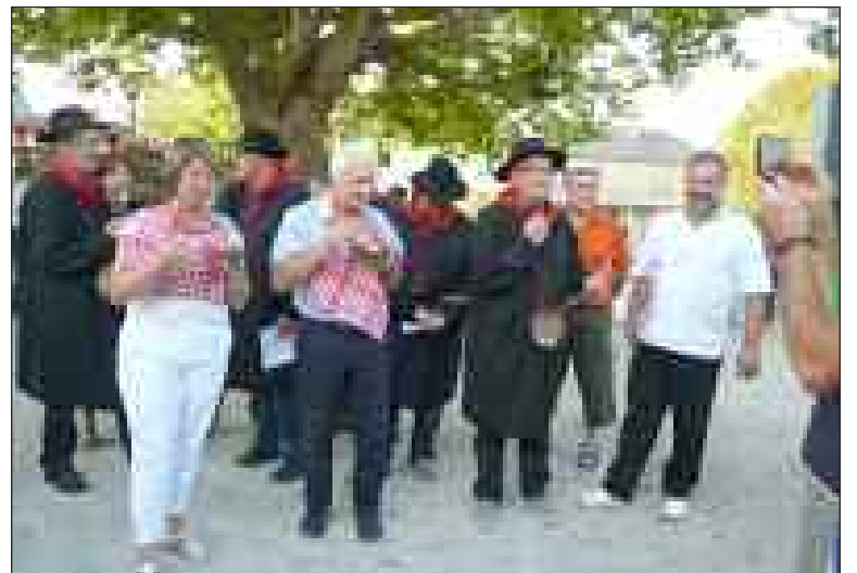
Le chabrol a donné au marché un petit air automnal de rentrée