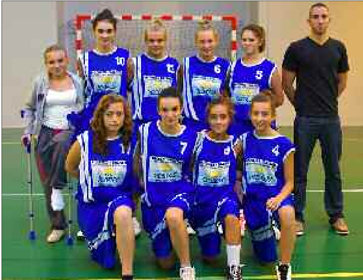
L'équipe des minimes