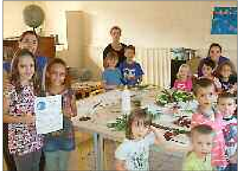
Les enfants de l'accueil de loisirs