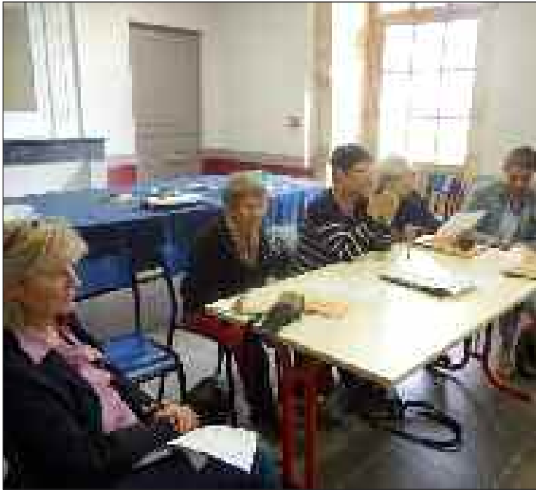
Parmi les responsables du club