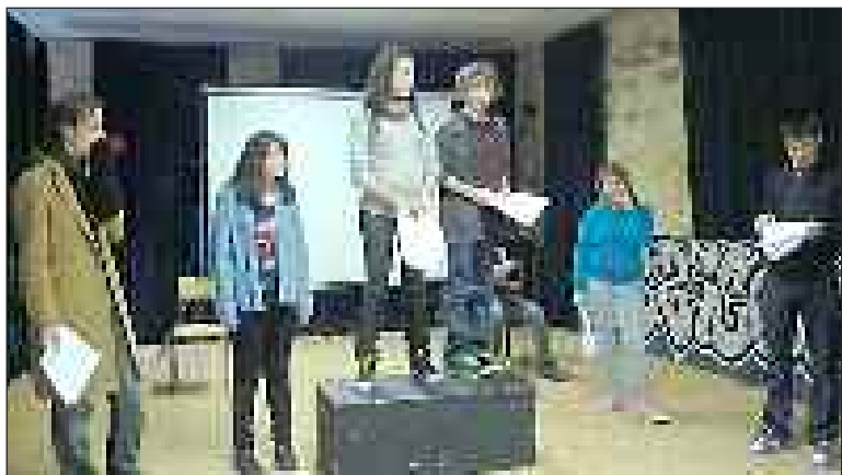
Les cours destinés aux enfants et aux adolescents ont déjà débuté

Au cours de cet atelier, chaque participant découvrira la richesse du monde du théâtre, la prise de conscience et la maîtrise de son corps, la voix de l'acteur (l'efficacité du porté de voix), la confiance en soi, le lâcher prise, le jeu d'acteur... Toutes ces notions seront abordées à travers des jeux, des exercices techniques, le développement du sens de l'écoute, de l'observation et de la réaction aux autres.