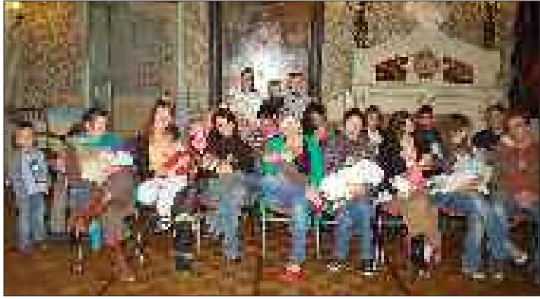
En raison du mauvais temps, la réunion s'est faite dans la salle du conseil municipal de la mairie

Grande Tétée, le 13 octobre. En tout, cinquante-cinq personnes étaient présentes. Objectif : promouvoir l'allaitement maternel.