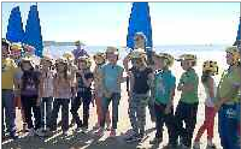
Un petit air de vacances pendant les cours de char à voile

Samedi 28 septembre, les élèves de cycle 3 sont revenus de leur classe de découverte qui a duré cinq jours à Saint-Georges-de-Didonne (Charente-Maritime). Ils sont malheureusement une des dernières classes à profiter de ce centre qui sera vendu par le conseil général fin 2013.