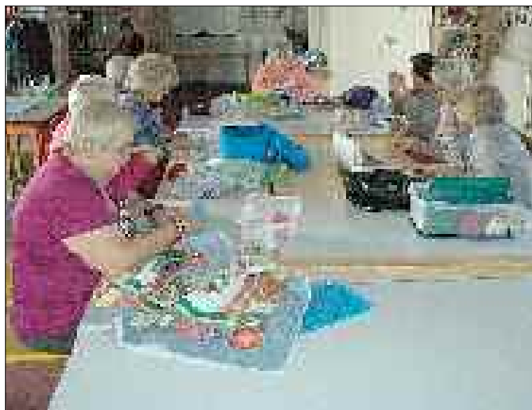
Les membres travaillent sur leurs projets tout en se conseillant les unes les autres