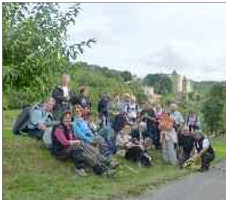
Lors de la dernière sortie