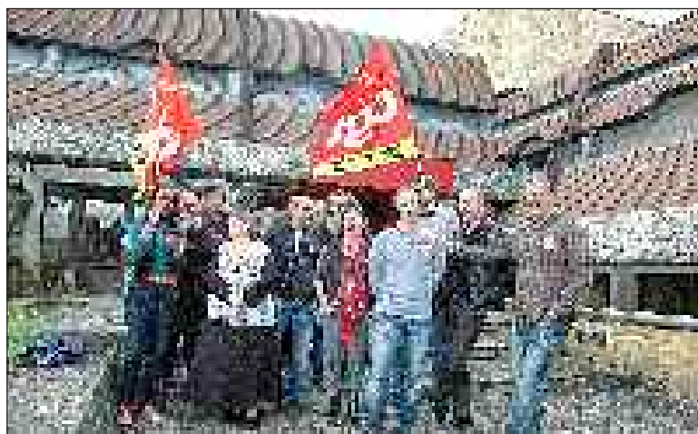
Les agents du Centre des finances publiques de Sarlat ont tenu une conférence de presse lundi 14 octobre

Situé avenue de Selves, le Centre des finances publiques de Sarlat a été construit et inauguré en 1989. Au départ propriété de la commune, il a été rétrocédé au ministère des Finances en 2008 pour l'euro symbolique. Environ soixante-dix personnes travaillent dans le site, au sein de trois services : impôts des entreprises, des particuliers et de la publicité foncière (ex-conservation des hypothèques).