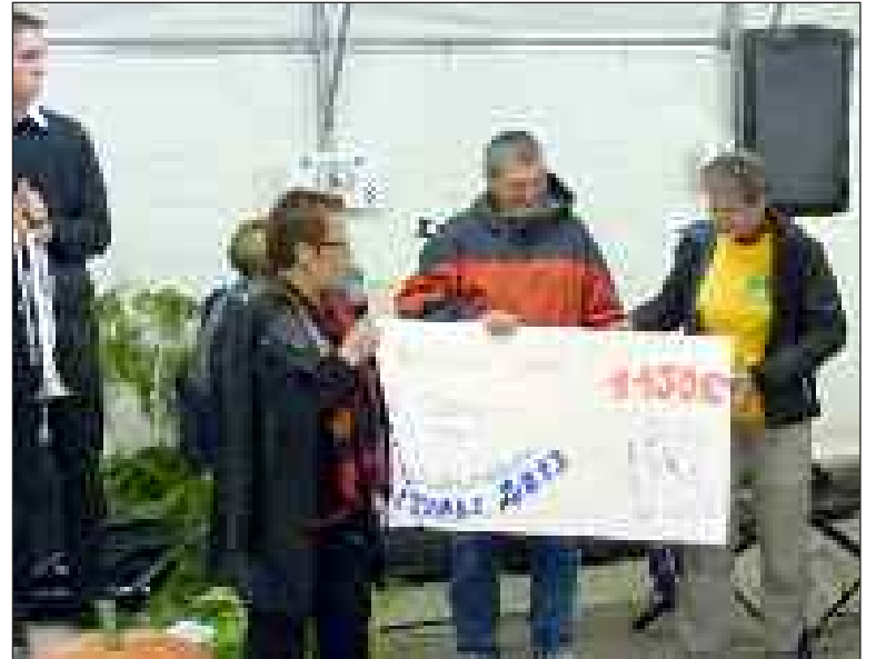
La remise du chèque à la Ligue contre le cancer