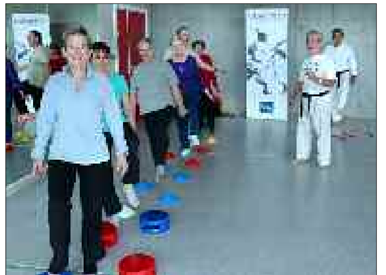
Durant la journée Seniors soyez sport

Après avoir présenté ses activités au Rendez-vous des seniors à Sarlat les 4 et 5 octobre, la section Karaté santé-Sport adapté de Sarlat était présente à Trélissac pour la journée Seniors soyez sport organisée par le conseil général de la Dordogne.