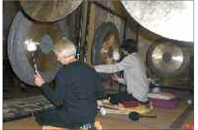
Derrière les gongs lors du final