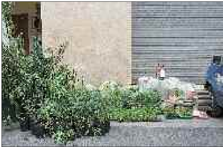
Une partie des éléments saisis

Récemment, les gendarmes sarladais apprennent que dans une maison située dans le quartier de la gare a été vu du cannabis dépassant d'une serre. Cette information les a conduits à perquisitionner cette habitation le 7 octobre après-midi. Ils découvrent que le propriétaire produisait du cannabis. Plus de 22 kg sont saisis, dont 20 kg de matière sèche consommable.