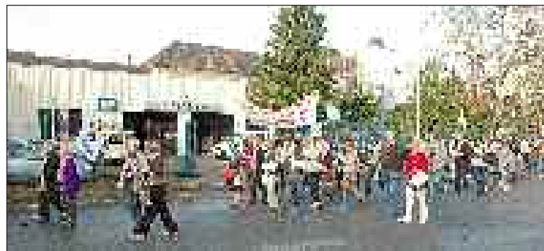
Lors du défilé du 26 octobre

Au matin du 6 novembre, elle avait récolté autour de 400 signatures.