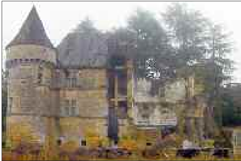
Le château du Sirey avant la restauration... Quelques années avant qu'il n'acquière la bâtisse, Etienne Cluzel avait bâché le faitage de l'édifice pour le compte du propriétaire de l'époque

Après avoir été en partie détruit par une explosion due à une fuite de gaz