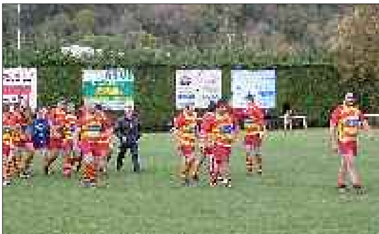
La joie après la victoire

Dès le coup d'envoi, les Vernois se mettent à l'ouvrage, ils poussent les sang et or à la faute et mènent 3 à 0 à la 4 e minute. Leur domination se poursuit et, suite à plusieurs placages manqués, leur troisième ligne s'échappe et aplatit entre les poteaux. Avec la transformation Vergt mène 10 à 0 à l'issue du premier quart d'heure. Le jeu s'équilibre ensuite jusqu'à la 25 e où, sur une contre-attaque cypriote rondement menée, le deuxième ligne Bardou pointe en but, l'essai ne sera pas transformé, 10 à 5. Les vert et blanc ont la possibilité d'aggraver la marque mais ils ratent une pénalité à la 30 e . Au contraire, suite à une quille montée par des locaux dominateurs, le demi de mêlée cypriote Gauchez effectue un arrêt de volée. Sur le dégagement qui suit, une montée défensive de ses coéquipiers permet à l'arrière de s'emparer du ballon et de percer plein champ. Apercevant deux joueurs venir à hauteur sur sa gauche, il s'aligne et, deux passes plus tard, Joinel plonge dans l'en-but pour le second essai, transformé par Cuevas. Le score est de 10 à 12 en faveur des Cypriotes à la 36 e mi-