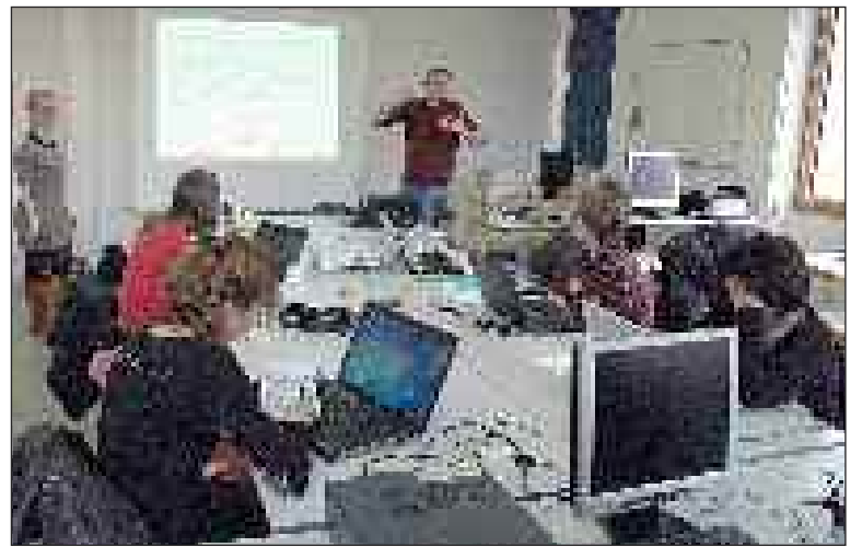
Lors de l'atelier le 5 novembre

Gérer des avis de clients négatifs sur le Web : un problème sérieux pour les professionnels