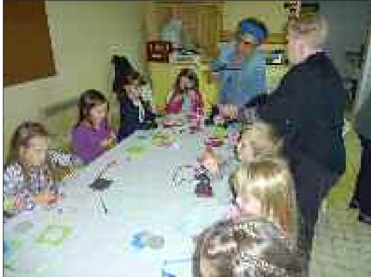
Les enfants se sont régalés de pouvoir donner libre cours à leur imagination

Pendant les vacances de Toussaint, sur l'initiative de l'Amicale laïque et en partenariat avec celle de Proissans, dix-neuf enfants ont pu développer leur créativité sous la houlette de Christine Pein et de plusieurs bénévoles en réalisant un très bel objet : un porte-crayon en forme de cœur ou de fleur, un objet original et décoratif. L'après-midi récréatif s'est terminé par un goûter toujours très apprécié de tous.