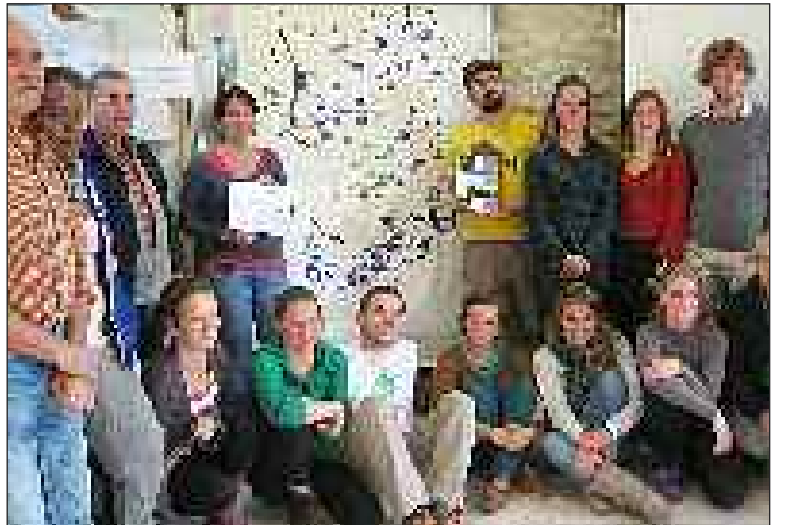
Les étudiants lors de leur présentation aux élus et acteurs locaux