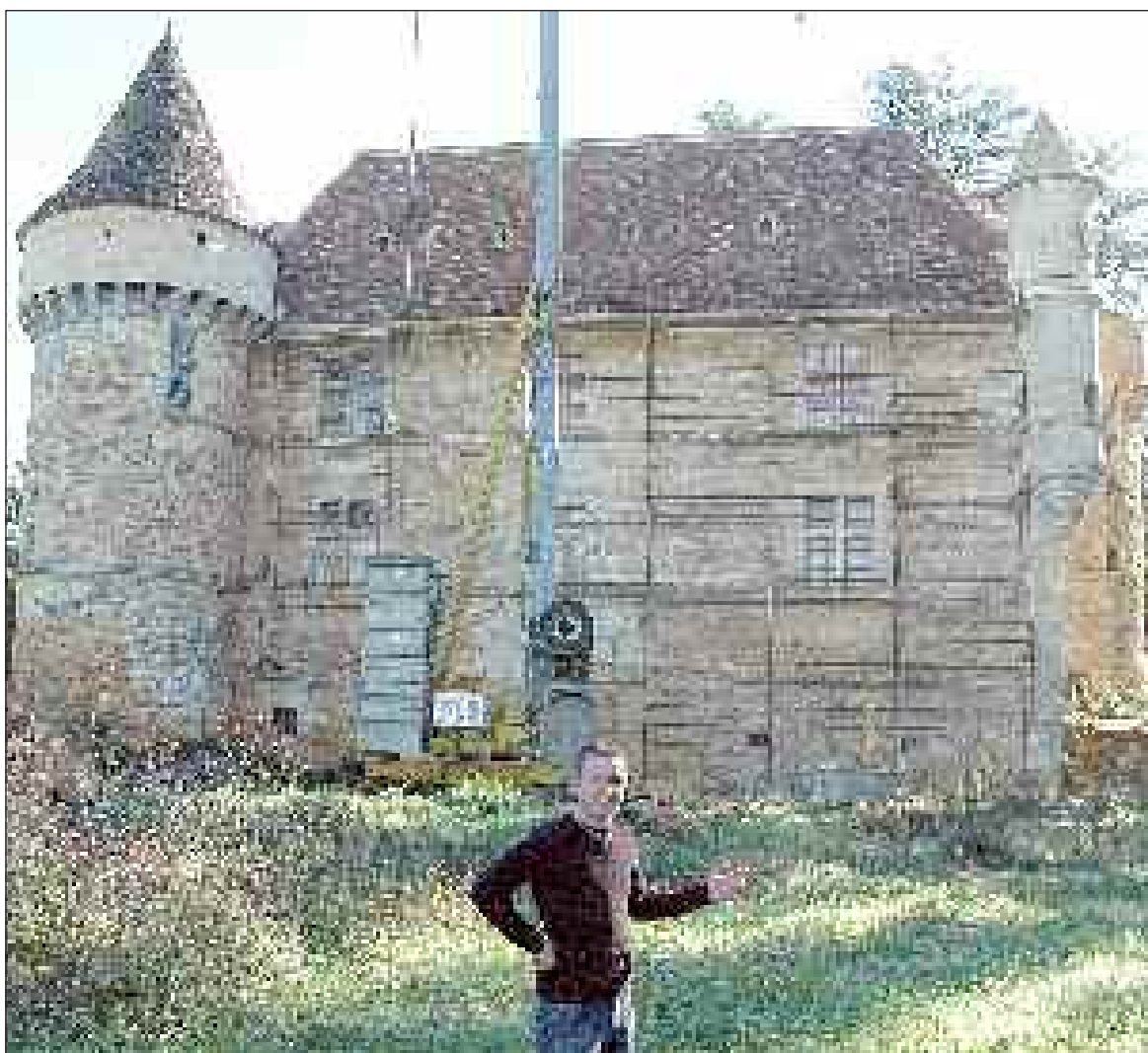
Et voici le résultat après le travail accompli pendant trois années

Renseignements au 05 53 31 45 45 ou à ant@sarlat-tourisme.com