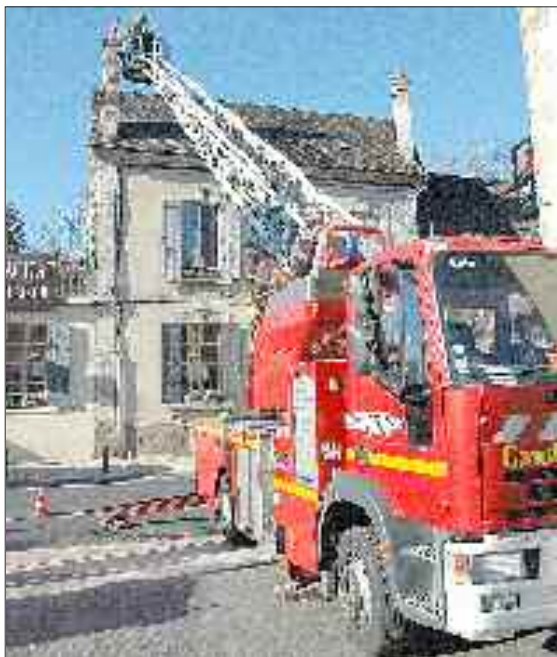
La grande échelle installée de manière à ne pas gêner la circulation