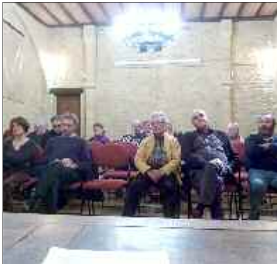
Une salle quasiment vide