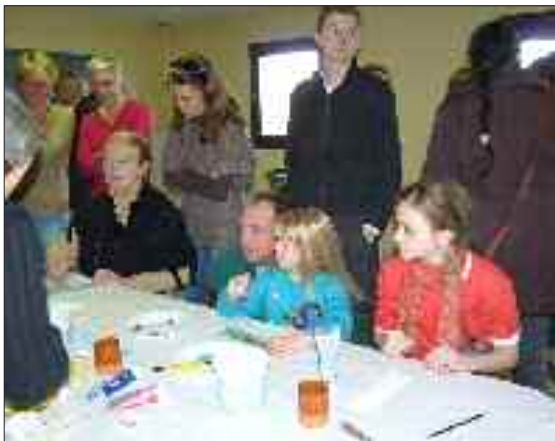
Les enfants, eux aussi, ont peint leur cadeau