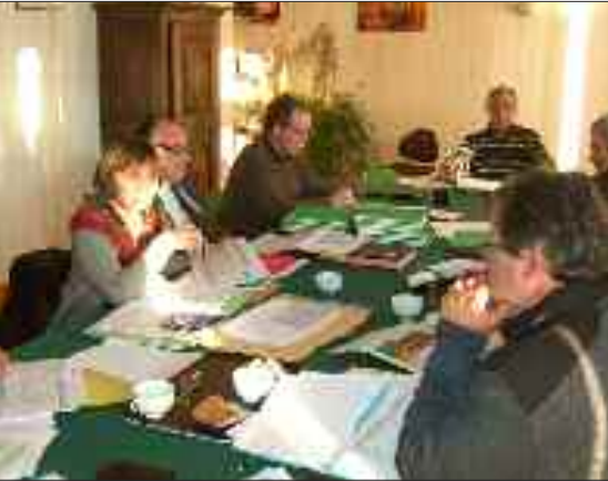
Le conseiller général au centre des débats