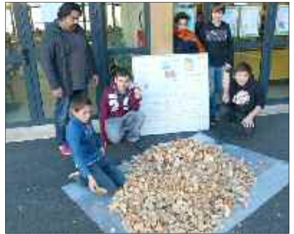
Vendredi 29 novembre, les élèves ont constaté l'important volume de pain gaspillé en une semaine

Après ces divers échanges tout au long de la semaine, ils ont pu