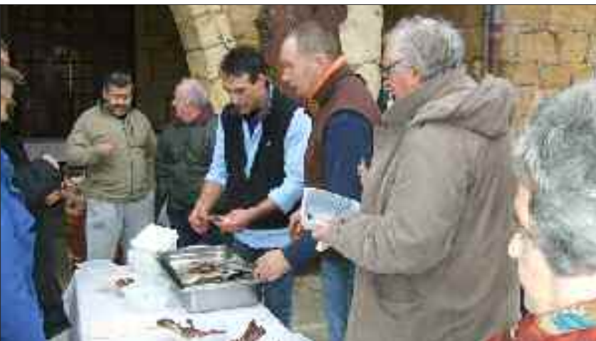
Dégustation de carcasses