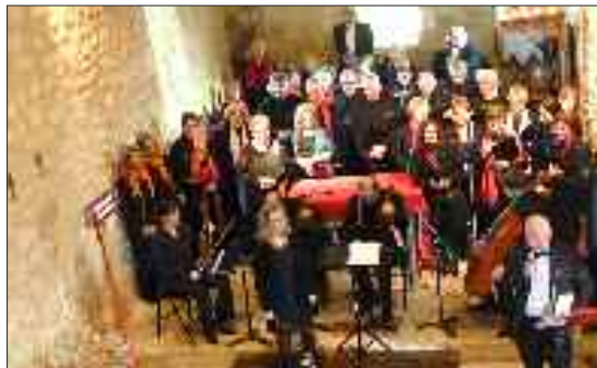
Le concert de Noël est devenu un moment attendu par le public

C'est désormais une tradition, tous les ans l'association Le Sentier des fontaines propose un concert de Noël en l'église d'Eyvignes. Rendez-vous dimanche 15 décembre à 15 h. Comme de coutume, il sera suivi du partage d'une boisson chaude et de pâtisseries, un moment convivial qui fait la différence.