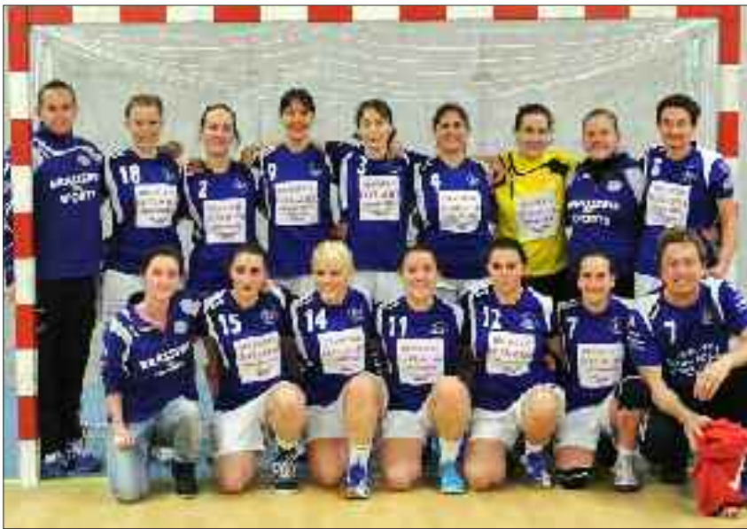
Les seniors filles

Vendredi 29 novembre en soirée, l'équipe loisirs du Sarlat handball Périgord Noir a effectué un difficile déplacement à Brive et s'est inclinée 28 à 23 au terme d'un match où le premier tiers temps lui a été fatidique (7-1). Les deuxième et troisième sonnent le réveil tardif des Sarladaises qui se mettent enfin à jouer. Même si dans cette catégorie la victoire importe peu, dommage de n'avoir commencé à jouer que sur deux tiers de la rencontre. Il leur faudra être plus présents pour la réception de Varetz, ne pas attendre d'être menés au score pour réagir et se faire plaisir dans des actions offensives et défensives de bonne facture.