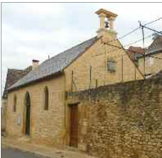
Le pignon restauré de la chapelle