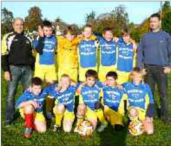
L'équipe des U12-U13

Vendredi 29 novembre en soirée, sur le terrain de Vergt, les vétérans ont rencontré les anciens Vernois.