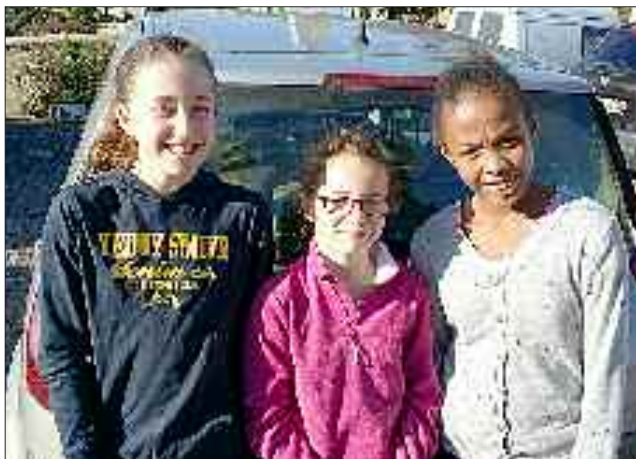
Le trio des benjamines en détection au Comité