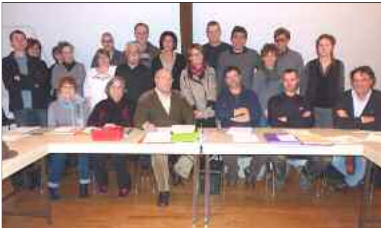
Avant le repas, dernier mot du président : « A chacun ses responsabilités avec l'aide de tous »