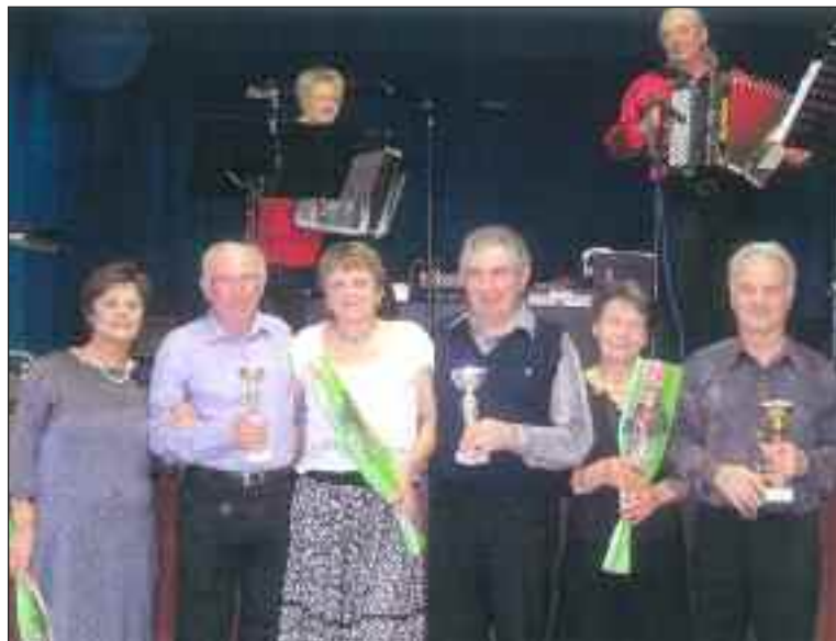
Les meilleurs danseurs

Le dimanche 16 février, le thé dansant animé par l'orchestre Mado Musette et organisé par le groupe Los Reipetits a connu un grand succès. De nombreux adeptes de l'accordéon y ont participé dans une ambiance conviviale.