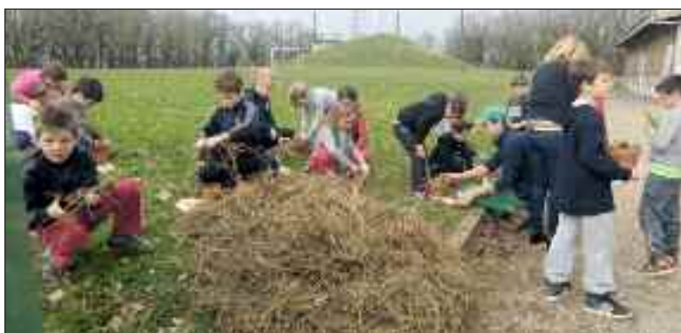
Fabrication de nichoirs à insectes