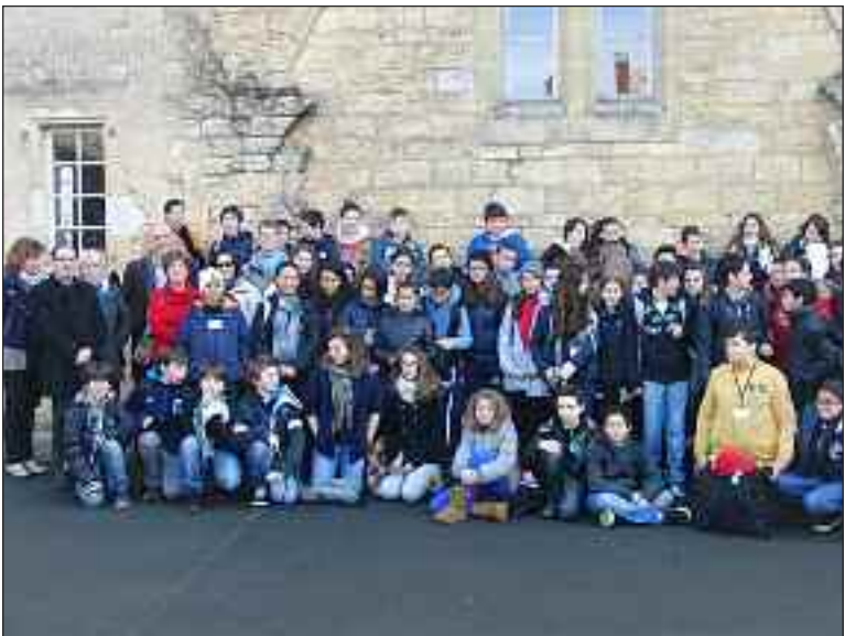
L'ensemble des collégiens réunis devant la mairie