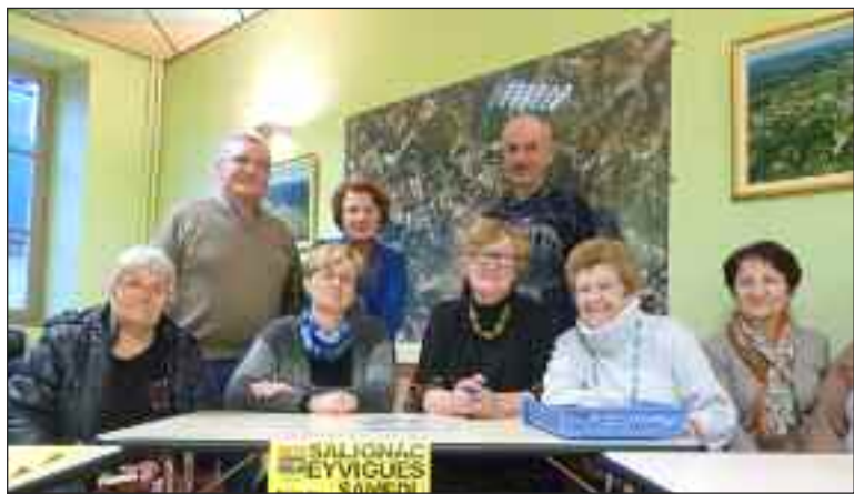
Les bénévoles de l'antenne salignacoise prêts pour les différentes manifestations du printemps