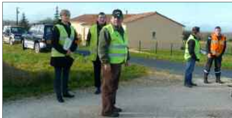
Un entraînement accompli avec sérieux