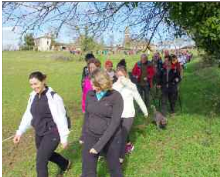
Un serpent de randonneurs dans la nature