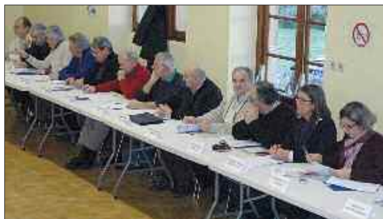
Les délégués ont étudié les derniers dossiers avant le renouvellement des élus consécutif au scrutin municipal

En 2014, 33 alternants et 145 stagiaires seront accueillis dans les locaux pour des formations liées au secteur du bâtiment. Une formation