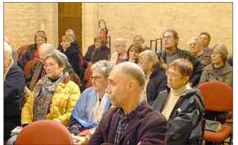
Un public qui tient à conserver un comité des fêtes