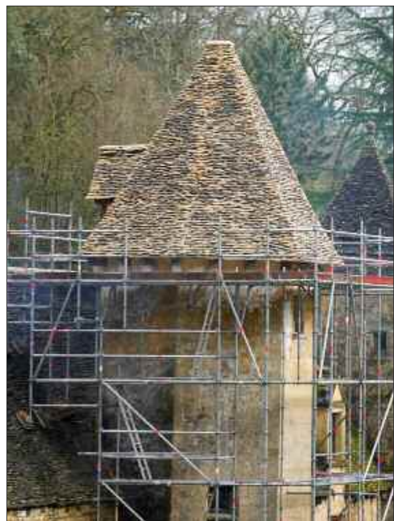
La tour escalier encore cernée de ses échafaudages

La lourde toiture de pierres de la tour escalier du château de Lacypière, à St-Crépin-Carlucet, nécessitait une réfection. C'est maintenant chose faite.