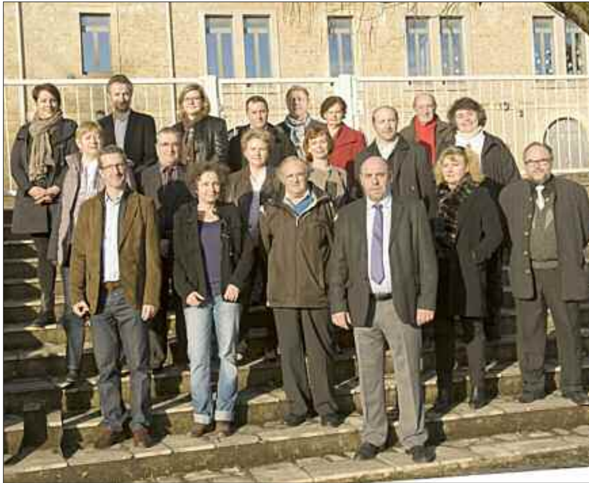
Les membres de la liste S'unir pour l'avenir

“ En matière d'urbanisme, une attention très particulière sera engagée pour l'élaboration du plan local d'urbanisme (PLU), document majeur pour l'avenir de notre commune.