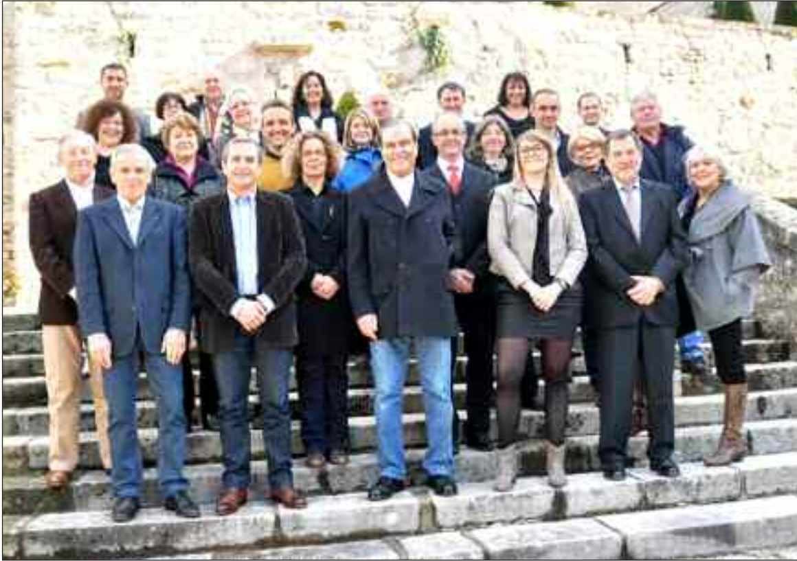
Liste Aïmons Terrasson avec force et imagination