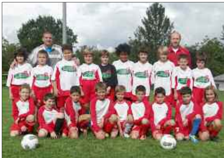
Les équipes U10 et U11

Pas de matches pour les Coquelicots en raison des mauvaises conditions météorologiques. Espérons que le week-end prochain les joueurs pourront retrouver le chemin des terrains.