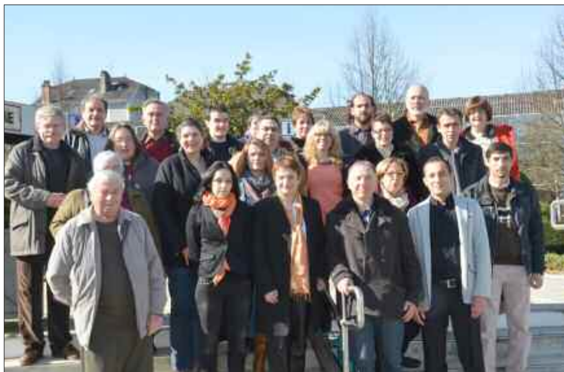
Liste Terrasson solidaire et citoyenne

"Face au déficit démocratique dont souffre notre ville, notre liste se veut résolument citoyenne. Il s'agit d'un engagement fort de notre part : faire vivre la démocratie municipale et redonner la parole aux citoyens ! Fruit d'une construction collective, notre projet, comme notre programme, sera nourri de vos propositions. C'est un programme solidaire, rejetant les logiques libérales et la mise en concurrence généralisée néfastes pour les citoyens et les services publics. La solidarité avec les plus démunis, les exclus, avec le mouvement social pour la défense de l'emploi et des avancées sociales est pour nous l'un des fondements de toute action municipale. Cette solidarité doit également être au cœur des relations