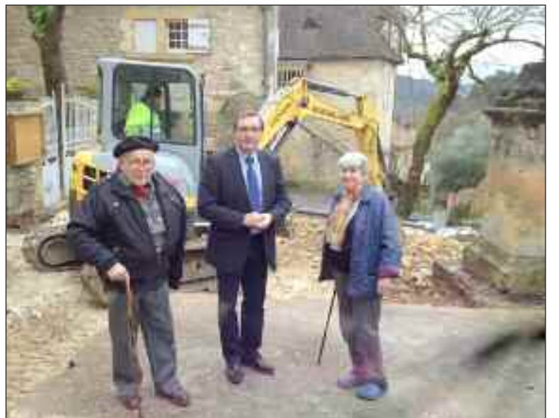
La place de la Mairie en travaux

La troisième tranche de rénovation des ruelles du vieux bourg de Castelnaud vient de débuter. Une partie concerne la place de la Mairie et le prolongement de la rue des Porches, et une autre la ruelle qui va du cimetière à la Croix.