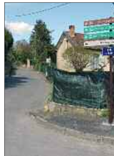
Le trottoir de la rue Jean-Leclaire se termine. La côte de Ravat commence...

Parmi les autres secteurs problématiques, la rue Jean-Jaurès – où les trottoirs promis l'an passé se font attendre – et le boulevard Voltaire où les automobilistes venant de se garer doivent rejoindre le trottoir de