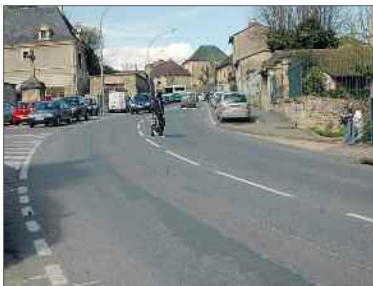
Boulevard Voltaire. Le passage clouté le plus proche est à une trentaine de mètres en amont : beaucoup de piétons préfèrent traverser ici