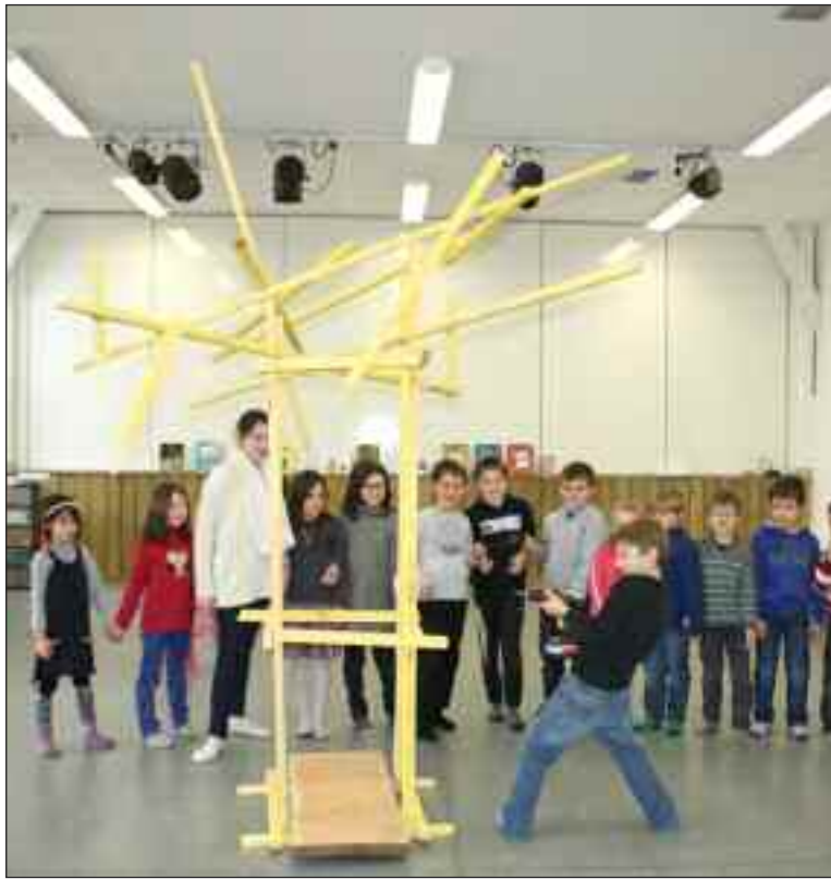
C'est la Tribu qui a fabriqué le vilain Pétassou, lequel sera jugé et brûlé

Le défilé costumé sur le thème de la nature, initié par les écoles de Saint-Geniès et de Salignac, se déroulera dans le bourg de Saint-Geniès le vendredi 7 mars de 14 h à 15 h avec la compagnie CuCiCo. Un goûter sera ensuite servi à la salle Robert-Delprat.