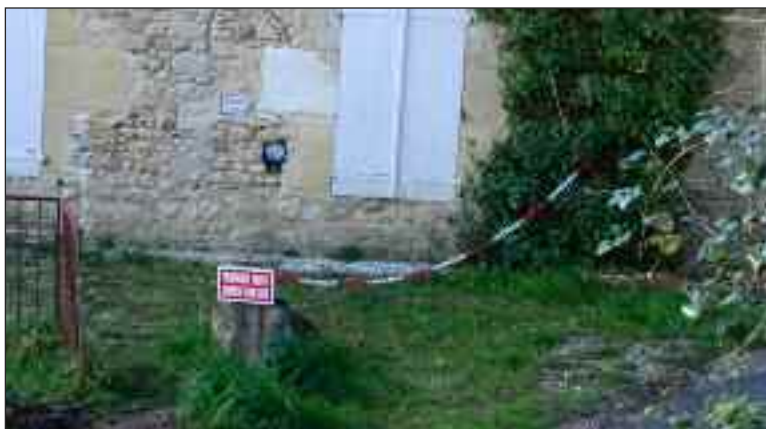
Une chaîne qui entrave la liberté