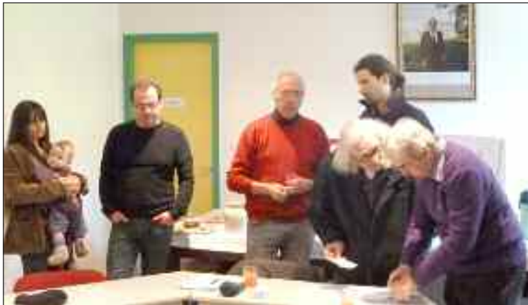
Les artisans d'iPulse