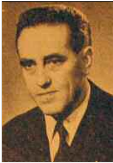
paru dans L'Essor Sarladais en mars 1971

"J'ai apporté le plus grand soin à composer cette liste, en choisissant un éventail de professions qui reflète sensiblement la composition du corps électoral", leur répond le maire dans le numéro de la semaine suivante. Les jeunes agriculteurs de Sarlat-La Canéda sont soucieux : "A la veille des élections, ils ont le vif regret de constater que parmi les listes en présence il en est deux où les représentants de ceux qui vivent exclusivement de la sueur du travail des champs sont en nombre nettement insuffisant, voire même ridicule. Comment serons-nous écoutés, encouragés, aidés ?"