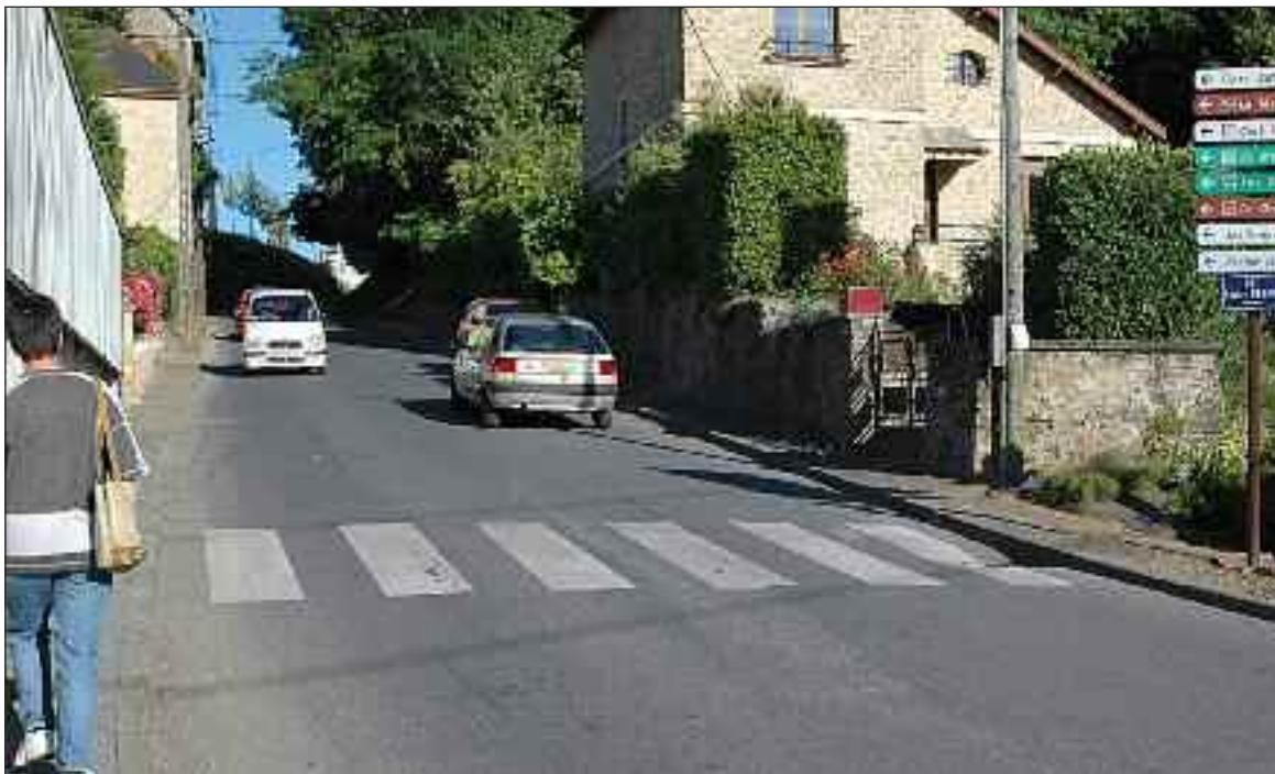
Cette piétonne profite des derniers mètres de trottoir avant d'entamer la montée de la rue Lucien-Dubois

Des rues sont trop étroites. Conséquence, elles n'ont pas de voie réservée aux marcheurs