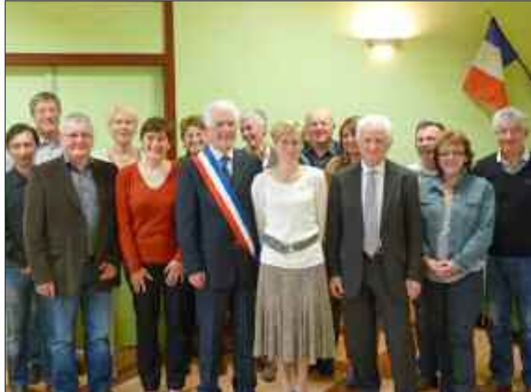
Le conseil municipal prêt pour six années