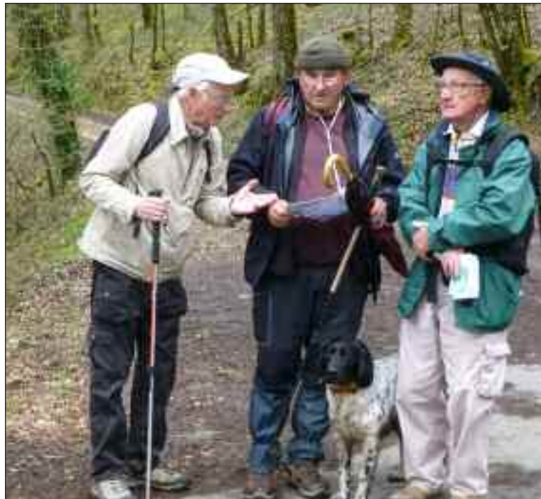
Comme c'est le cas pour chaque sortie des membres vont reconnaître les circuits