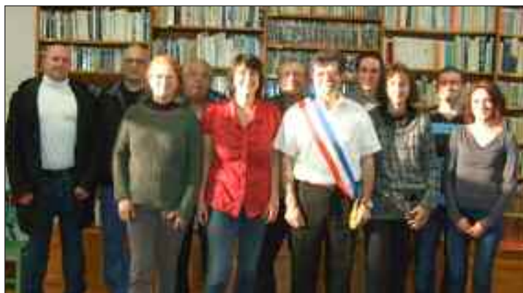
L'équipe municipale en place pour six ans