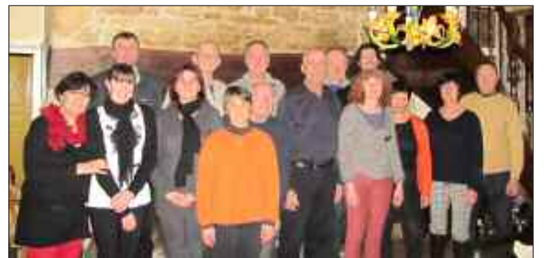
Liste A à l'écoute de chacun et au service de tous