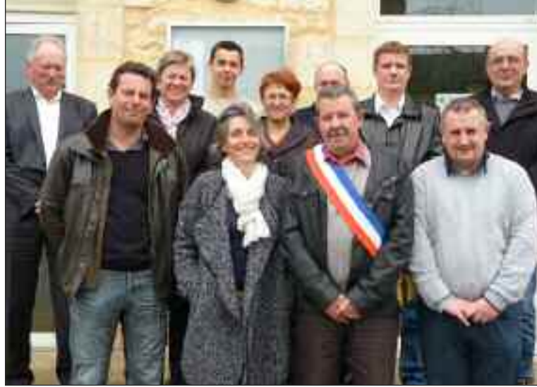
Le nouveau conseil municipal