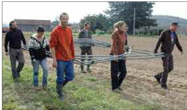
Les étudiants portent des pièces nécessaires au montage de la serre

De futurs maraîchers ont aidé des jeunes récemment installés à monter une serre qui servira à leur production de légumes