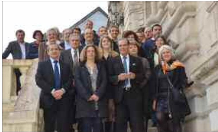
Le conseil municipal