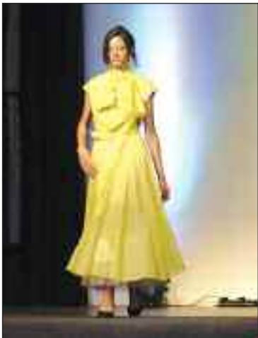
Le défilé de mode sera un temps fort de ces trois journées dédiées à l'artisanat d'art