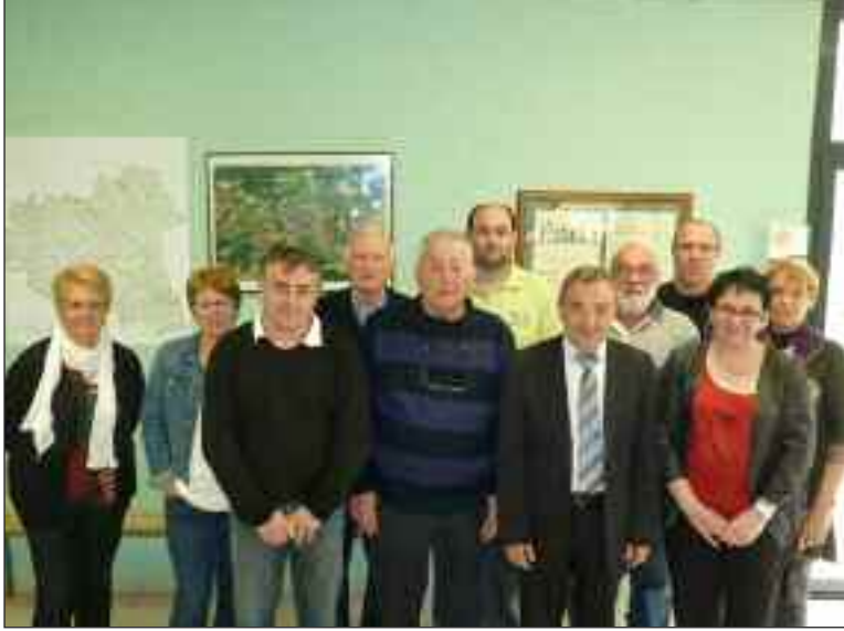
Le maire et ses conseillers