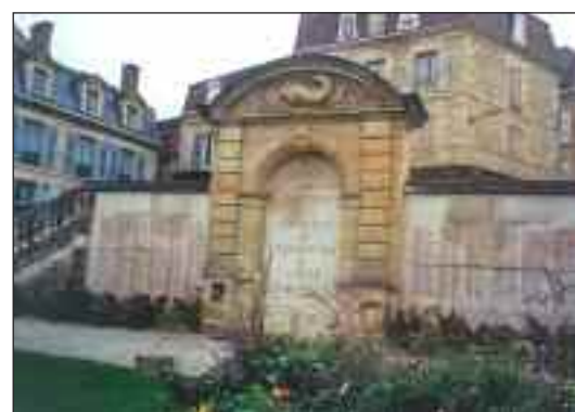
Le monument inauguré le 17 novembre 1946

La traditionnelle assemblée générale du comité sarladais se tiendra