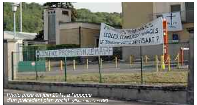
Photo prise en juin 2011, à l'époque d'un précédent plan social

La baisse de la production de tabac en France entraîne la diminution de l'activité à l'usine de transformation de Sarlat. La direction a annoncé un plan social. 29 emplois seraient menacés.