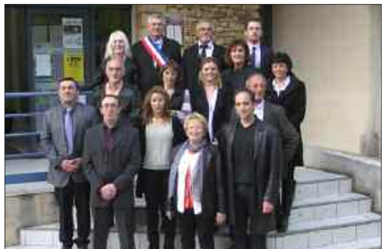
Les conseillers municipaux

Dans un discours très solennel, le maire a rappelé les droits et les devoirs de chacun et il a donné les grandes lignes de fonctionnement du conseil municipal dont des conseils relatifs à la communication : " Les citoyens de Siorac-en-Périgord vont vous poser souvent de multiples questions, ne répondez jamais au hasard mais seulement quand vous êtes sûrs de la réponse. En cas de