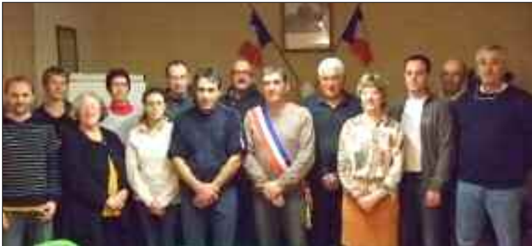
Le conseil municipal est prêt pour les six ans à venir

Dimanche 23 mars, les Villefrançoises et les Villefrançais ont élu la liste menée par le maire sortant. Vendredi 28, les quinze membres élus du conseil municipal, dont sept nouveaux, se sont réunis pour élire l'exécutif de la commune.