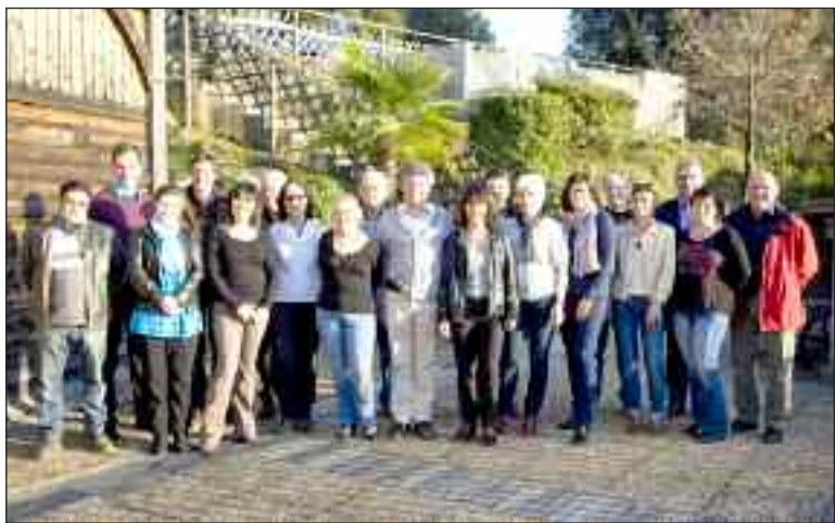
La nouvelle équipe municipale

Le maire et l'ensemble des élus vous invitent cordialement à la plantation du mai le samedi 3 mai