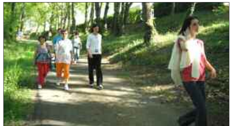
La participation est une excellente motivation pour un entraînement quotidien

On les retrouvera ensuite sur un stand de ravitaillement où elles ne ménageront pas leurs encouragements.