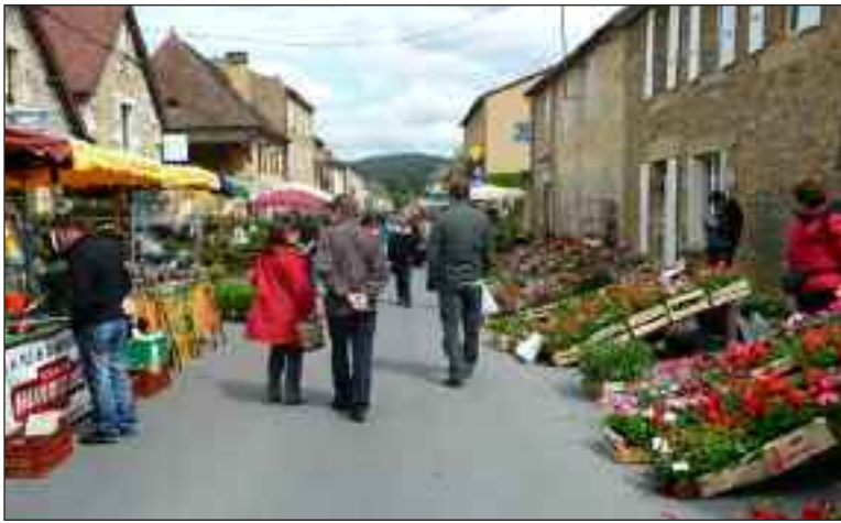
La traverse accueille les stands multicolores