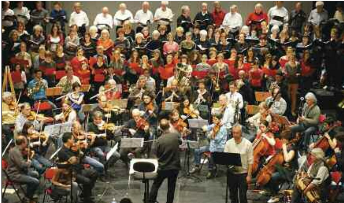
Les solistes de l'Ensemble instrumental de la Dordogne

C'est une soirée placée sous le signe de la musique classique qui est programmée le samedi 3 mai.