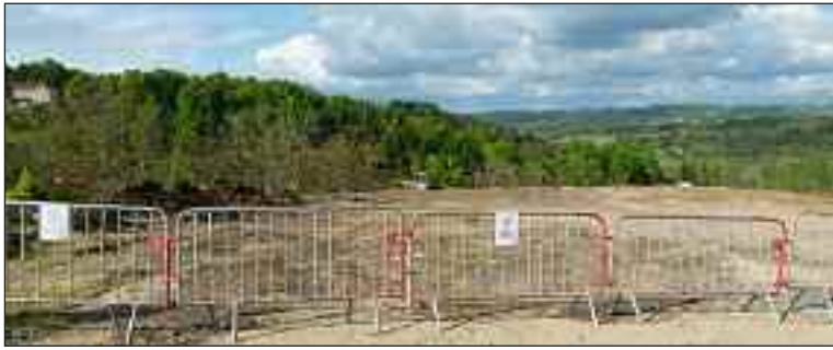
Accès interdit à ce qui était en train de devenir une décharge sauvage

C'était un vœu des deux listes en présence lors des dernières élections municipales : modifier le point