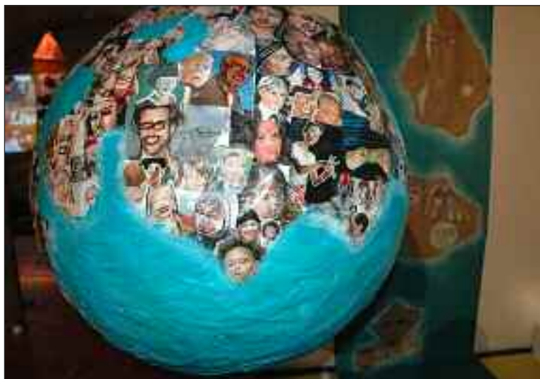
Un travail de l'Apajh

Le thème du festival cette année : le cosmos. Pendant l'inauguration, Jean-Jacques de Peretti, maire, fit remarquer le grand écran au-dessus de la cheminée de la salle Molière.