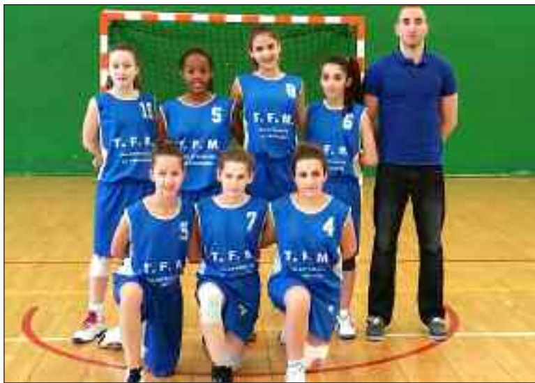
L'équipe des benjamines victorieuses