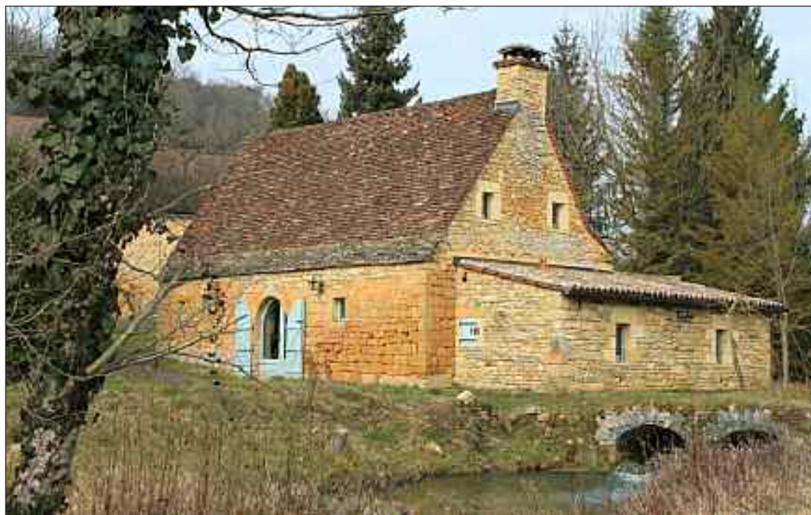
Moulin Bas à Saint-Vincent-Le Paluel

- Borrèze. Le Moulin de Janicot, téléphone : 05 53 30 26 52 ou 05 53 28 83 06. Dimanche de 10 h