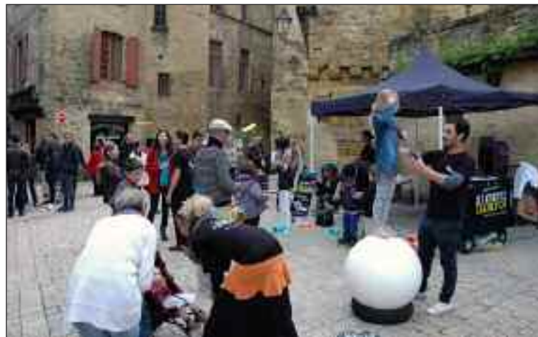
Les membres de Rue de la scène ont initié les jeunes, du 1 er au 4 mai