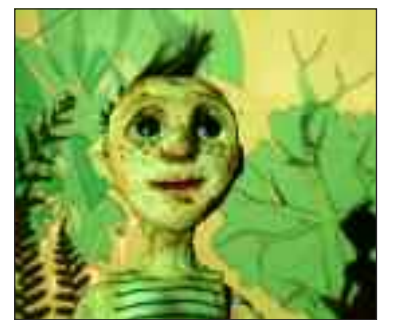
Piot est le personnage central de l'histoire