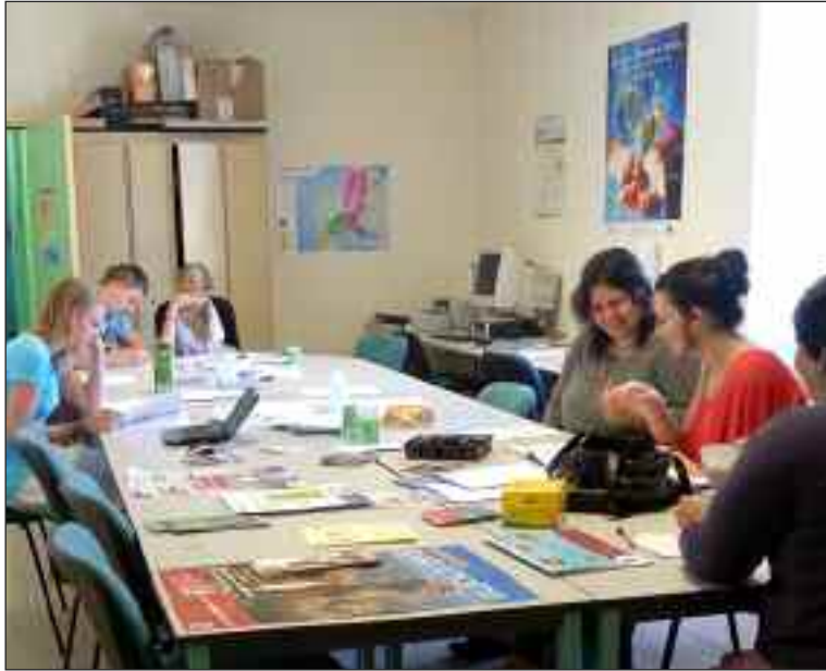
Une séance d'apprentissage à la rédaction d'un CV