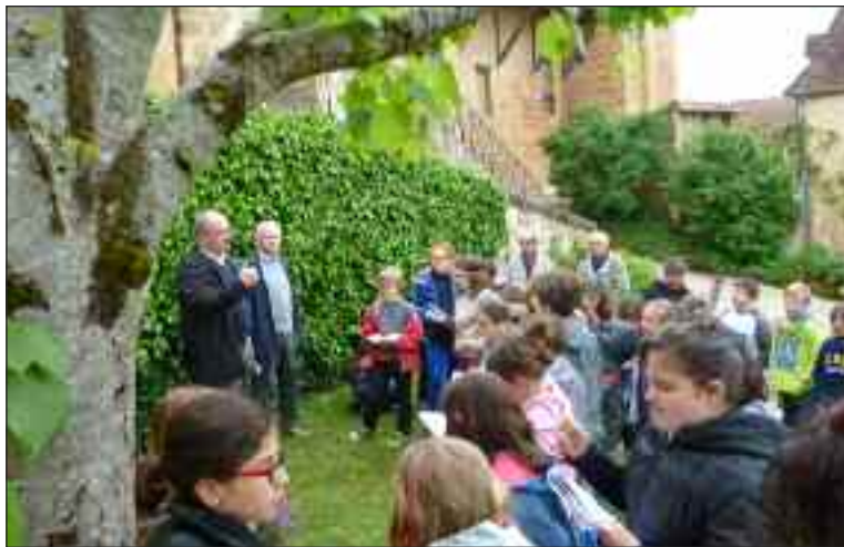
Dans la cour du presbytère, les enfants sont tous très attentifs et à l'écoute des représentants de l'ANACR