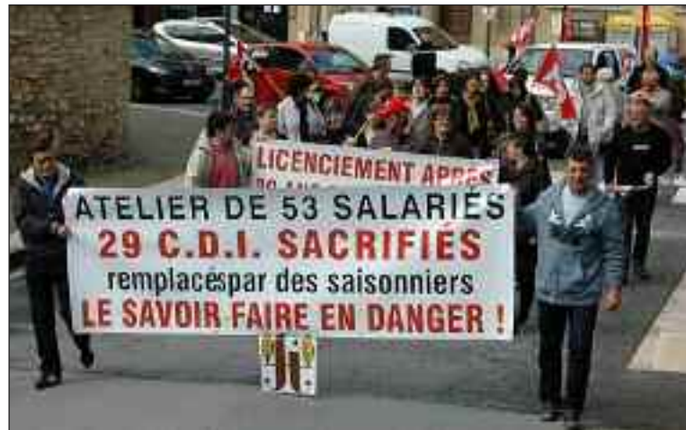
Des salariés de France Tabac en tête de cortège