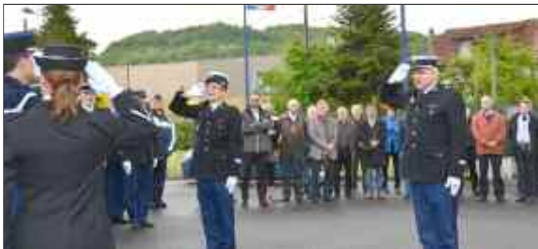
Lors de la levée des couleurs