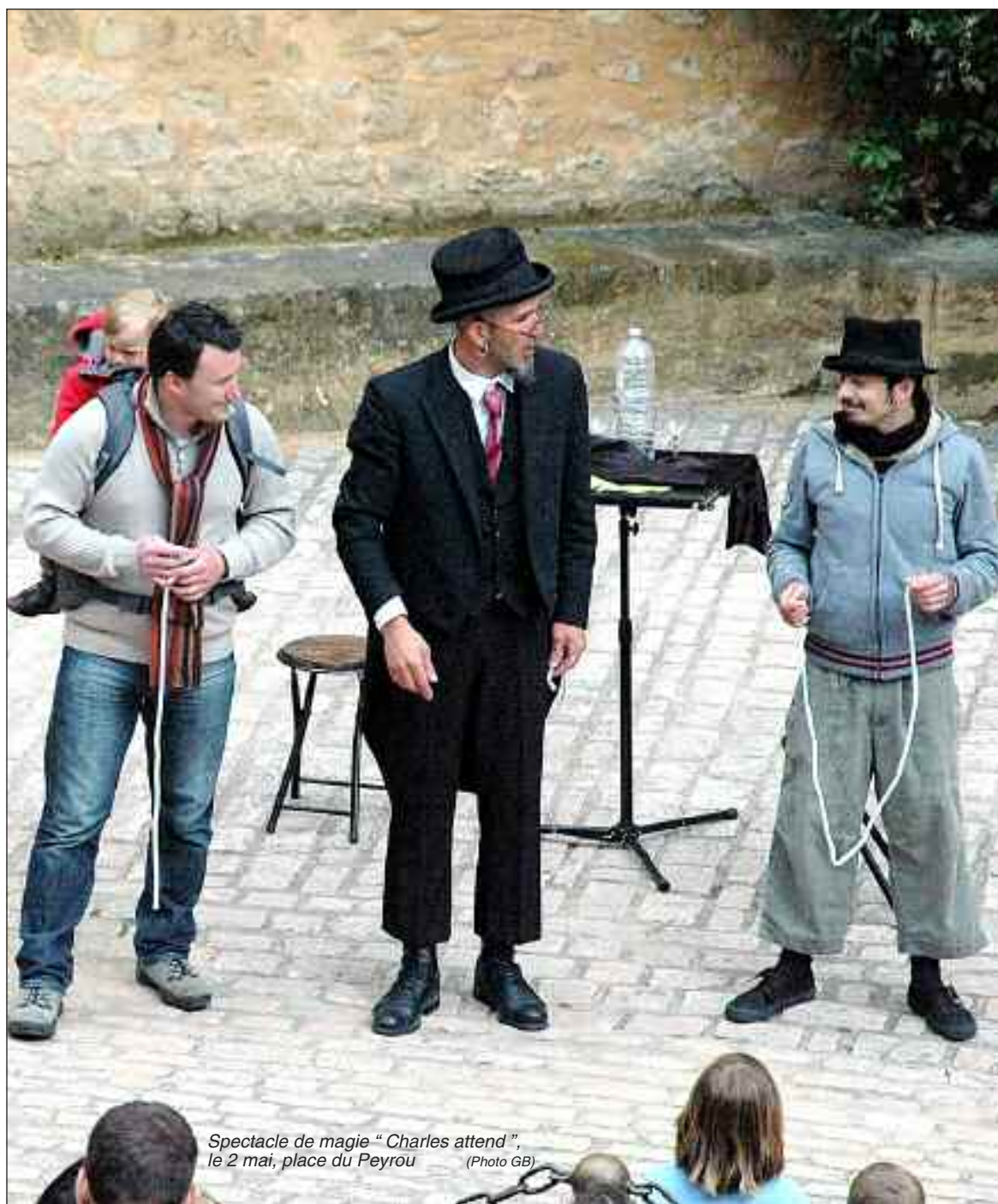
Spectacle de magie "Charles attend", le 2 mai, place du Peyrou

Un art contemporain qui n'effraie pas le quidam, ce n'est pas si courant. Celui proposé lors du festival sarladais est une œuvre collective de plus d'un millier de personnes. Dans la rue ou à l'Ancien Evêché, il attire locaux et touristes. Page 3