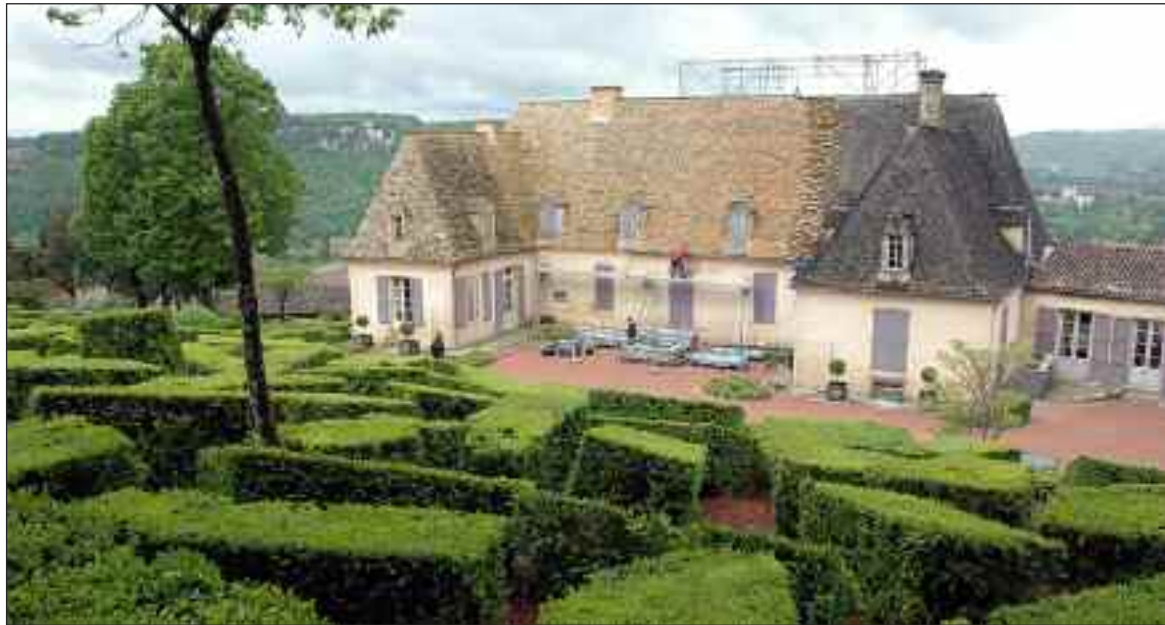
Le chaos de buis et au second plan le château

Le site vézacois annonce une hausse du nombre de visiteurs