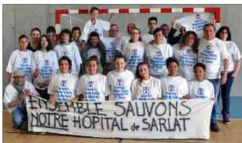
Des membres du Sarlat handball Périgord Noir posent avec tee-shirts et banderoles

Les animateurs du comité poursuivent également la tenue de permanences chaque jeudi devant le Centre hospitalier Jean-Leclaire. L'occasion pour eux de populariser leur argumentaire mais aussi d'en apprendre à chaque fois un peu plus