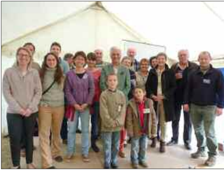
Les organisateurs, producteurs, exposants et bénévoles

Le week-end du 1 er mai est devenu le rendez-vous des amateurs, voire des passionnés d'orchidées. C'est désormais tous les deux ans que se tient aux Jardins d'Eyrignac cette manifestation portée par l'Office de tourisme et ses nombreux bénévoles pour la circonstance, et ses partenaires.