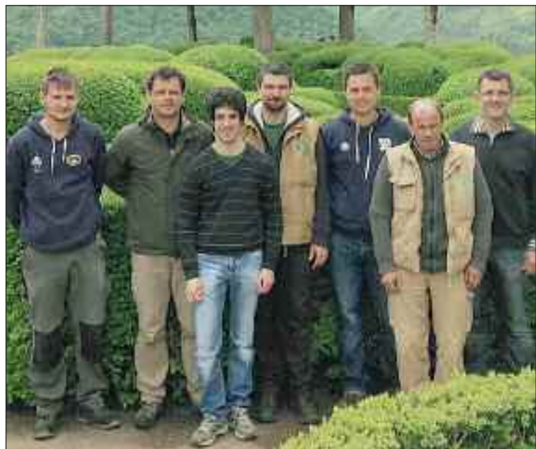
L' équipe des jardiniers

Samedi à 10 h 30 à la cathédrale, présentation des cartes postales éditées par la section orgue de Musique en Sarladais ; de 11 h à 12 h, audition dans le cadre de l'Orgue au marché ; de 15 h 30 à 17 h, présentation concertante des orgues. Dimanche à 11 h, messe paroissiale accompagnée par le grand orgue ; de 15 h à 17 h, présentation concertante des orgues. A 17 h 30 à la cathédrale, documentaire sur la construction d'un orgue. Accès libre.