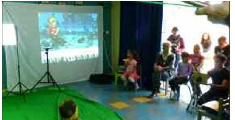
Les résultats des tournages d'essai obtenus à partir d'un ordinateur portable sont surprenants et ont passionné les enfants qui ont testé le projet

Dès la prochaine rentrée scolaire, la réforme des rythmes scolaires sera en principe en vigueur partout. Du côté des services de la DDCSPP (direction départementale de la