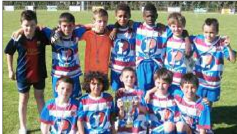
Des jeunes de l'école de football

Seniors A. Honneur. Saint-Médard-en-Jalles : 4 - FCSMPN : 0.