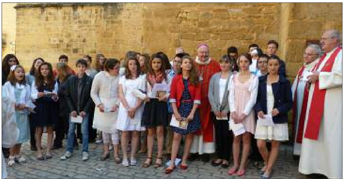
La joie des confirmés et de leur évêque