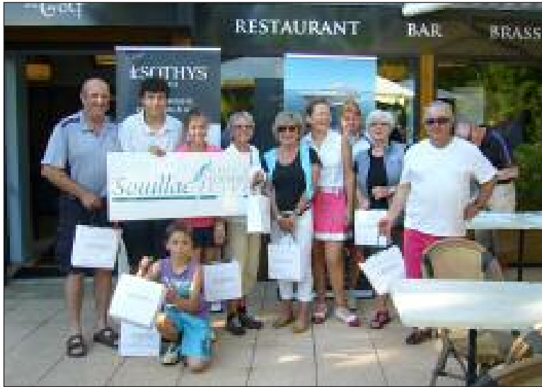
Les vainqueurs de chaque catégorie

Dimanche 18 mai, sur les greens du Souillac Golf & Country-club, s'est déroulée une compétition au cours de laquelle de nombreux participants ont profité de la qualité exceptionnelle du parcours et d'un temps splendide. Toutes les conditions étaient réunies pour réaliser de belles performances.