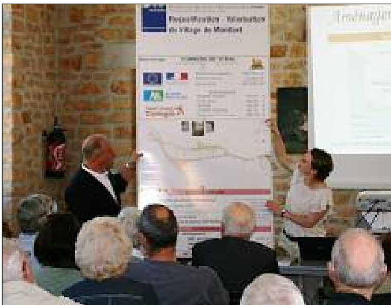
Lors de la vidéoprojection