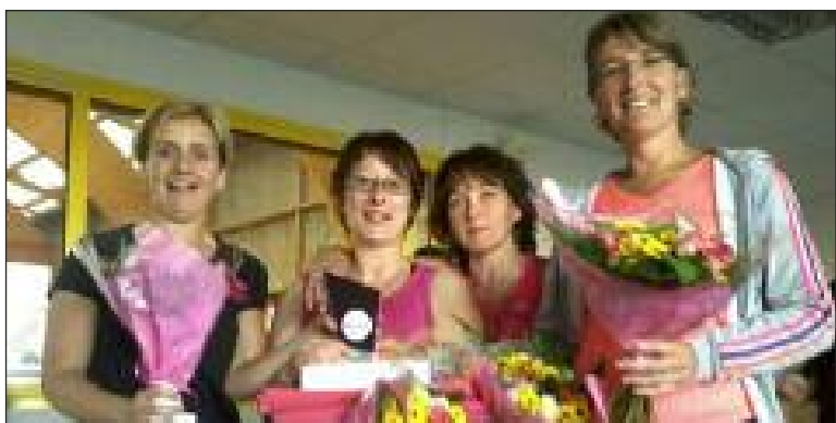
L'équipe "raquettes FFT" a remporté le titre départemental