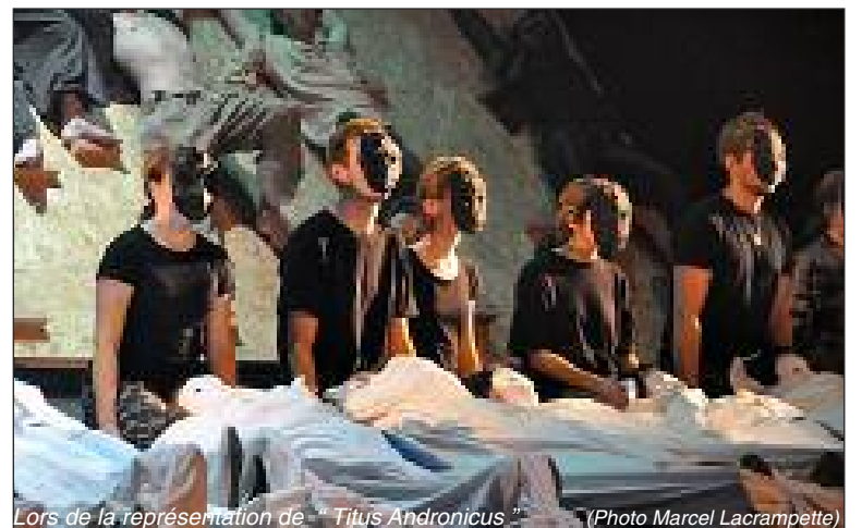
Lors de la représentation de "Titus Andronicus"

Alors l'ouverture du rideau sur vingt et un soldats tirant vingt et un morts impressionne le public, médusé. Ils le sont aussi, médusés, les quelques spectateurs embarqués qui se retrouvent allongés, masqués et tirés sur un drap blanc par des comédiens concentrés. La porte au fond du plateau s'ouvre dans un