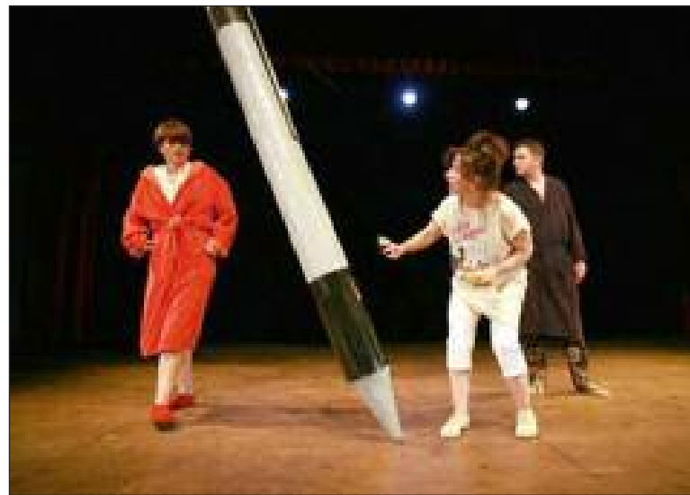
Un immense stylo sur scène

Le public se doit de montrer qu'il y a une tradition de théâtre à Sagelat