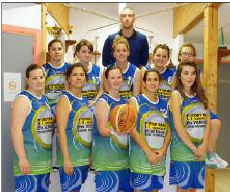
Les seniors, victorieuses pour leur dernier match