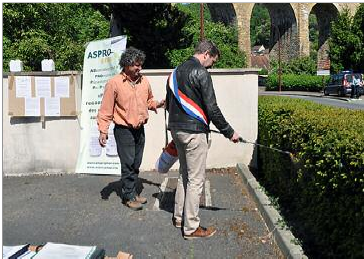
Les manifestants ont assisté à la pulvérisation symbolique d'un produit naturel peu préoccupant non autorisé, en l'occurrence du purin d'orties, sur la haie délimitant la permanence du député