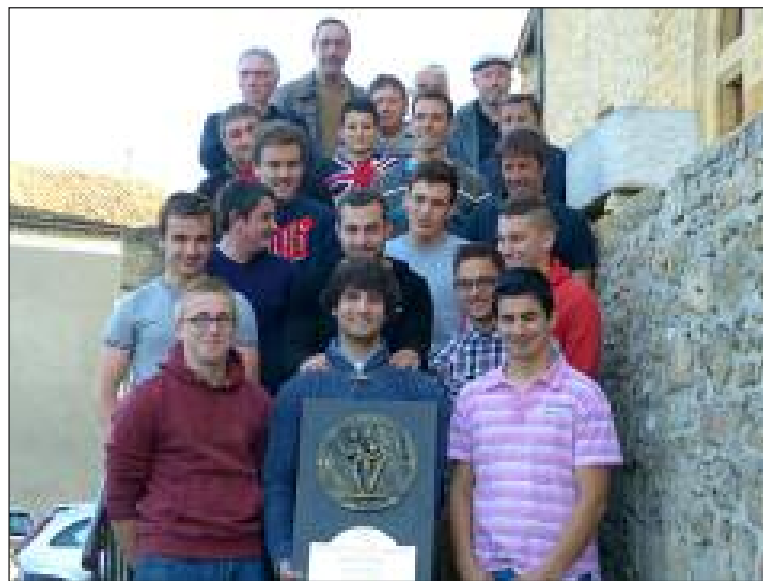
Les juniors autour du trophée