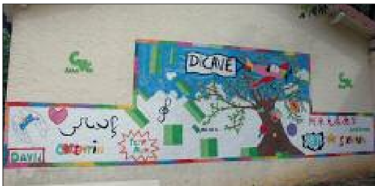
La fresque réalisée par les jeunes Sarladais

L'année dernière, Itinérance a mené une action au quartier des Chênes Verts. Sept Sarladais âgés de 14 à 16 ans y ont participé, sous la houlette de Khalfallah Mehdi, moniteur éducateur. Ils ont réalisé une fresque sur l'une des façades de la salle commune. L'objectif : valoriser leurs compétences, leur créativité et leur investissement. "Ils ont été très assidus, ont manifesté un grand intérêt et ont su faire preuve de motivation, d'imagination et de cohésion", est-il précisé dans le rapport d'activité 2013 de l'association.