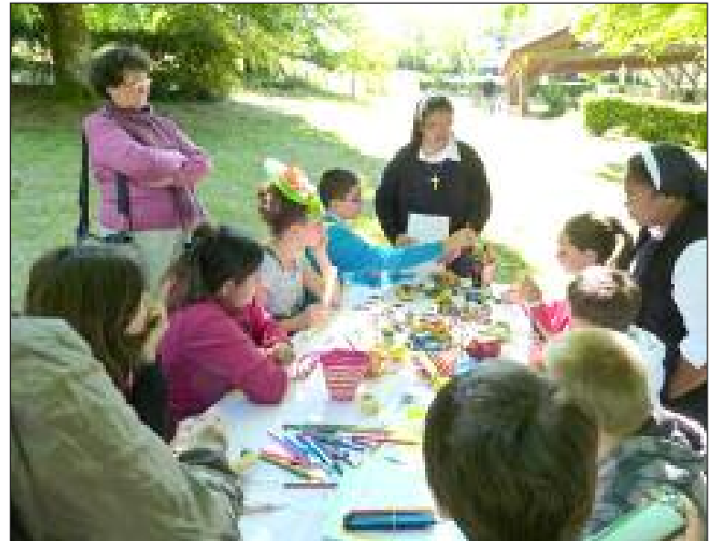
Les petites voitures de Madagascar ont suscité l'intérêt des enfants

Samedi 17 mai, près de deux cents enfants de la région se sont retrouvés dans le parc de Capelou à l'invitation du Secours catholique pour une grande leçon de solidarité. Beaucoup d'ateliers ont permis de parler des enfants d'Afrique Noire, d'Égypte, du Pérou, de Madagascar... à travers l'apprentissage d'ob-