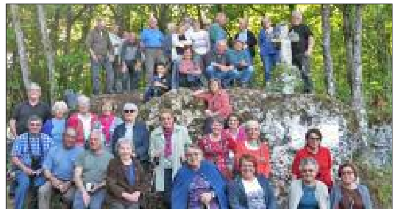
Une partie de l'assistance venue au Malpas