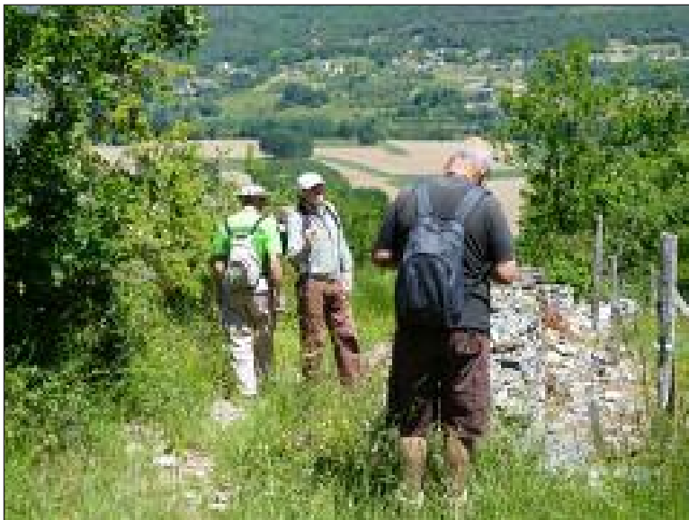
Des pauses sont prévues pour admirer la beauté des paysages

Dimanche 1 er juin, l'association Les Sentiers d'antan propose de participer à l'opération départementale Randonnée en fête en découvrant la commune de Cladech et ses beautés patrimoniales. Rendez-vous à 8 h 30 sur le parking de la mairie, près de l'étang, où le maire vous souhaitera la bienvenue et vous offrira le café. Ensuite, départ pour parcourir 12 km à la découverte de paysages magnifiques, avec la participation d'Isabelle Petitfils, directrice de l'Aroeven, qui apportera explications et commentaires sur la flore et les paysages. Le pique-nique sera pris vers 13 h sur le parking du château des Milandes. L'après-midi, 3,5 km de sentiers vous permettront de rejoindre le