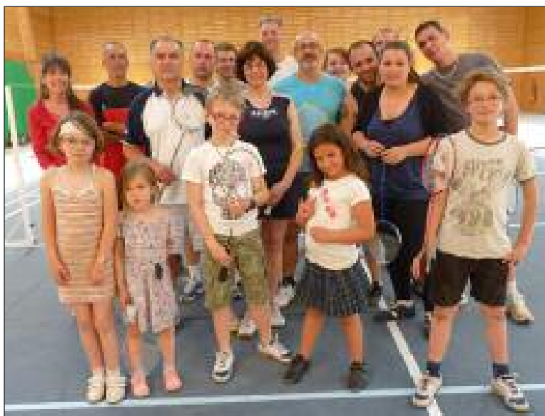
Tout au long de l'après-midi, une quarantaine de personnes sont venues s'initier aux techniques du badminton

Tout au long de l'année, la section badminton-loisir n'a cessé d'augmenter ses effectifs. Les entraînements des mardis et vendredis de 20 h 30 à 23 h montrent une participation régulière d'une vingtaine d'adhérents venus profiter de cette activité accessible à tous.