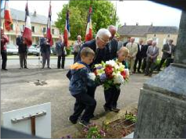
Les plus jeunes se sont aussi impliqués