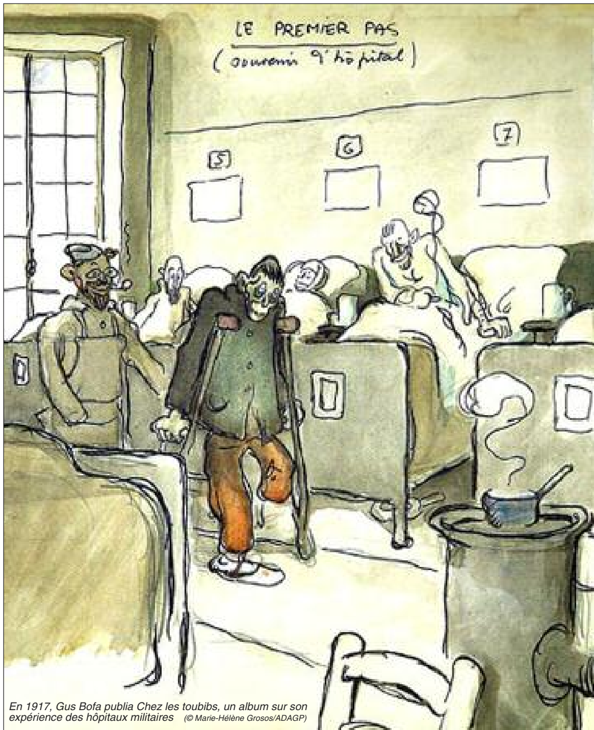
En 1917, Gus Bofa publia Chez les toubibs , un album sur son expérience des hôpitaux militaires © Marie-Hélène Grosos/ADAGP

L'exposition d'été de la ville de Sarlat à l'Ancien Evêché met en avant le travail du dessinateur Gus Bofa. Blessé et amputé dès le début de la Première Guerre mondiale, son œuvre met l'accent sur l'absurdité du conflit.