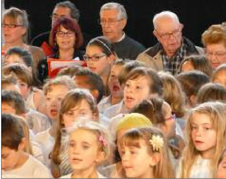
Aînés et enfants ont enchanté le public