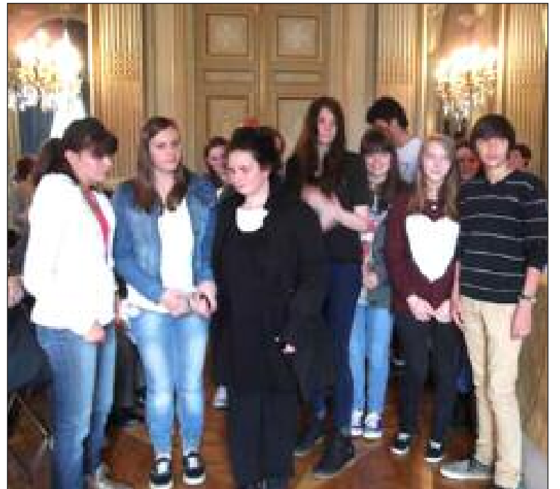
Les collégiens belvésois dans les salons de la préfecture