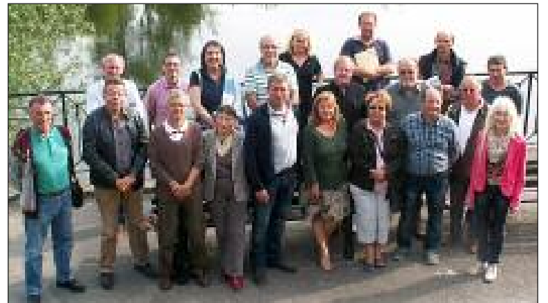
Les membres du conseil syndical

Les communes adhérentes : Vitrac, La Roque-Gageac, Vézac, Beynac-et-Cazenac, Saint-Vincent-de-Cosse, Allas-Les Mines, Bézenac, Castels, Meyrals, Berbiguières, Saint-Cyprien, Marnac, Audrix, Mouzens, Siorac-en-Périgord, Urval, Coux-et-Bigaroque, Le Buisson-de-Cadouin, Badefols-sur-Dordogne, Pontours.