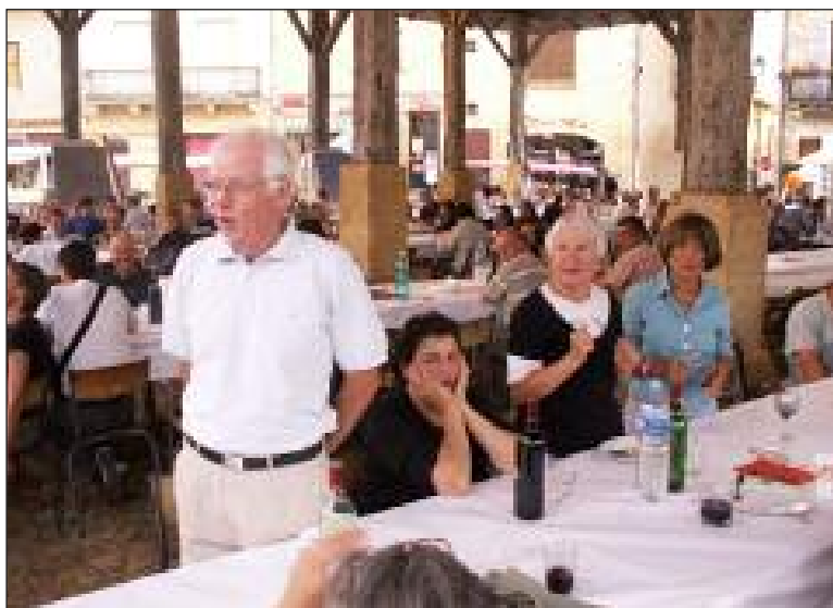
L'euphorie gagnant, il est souvent des chanteurs au talent insoupçonné