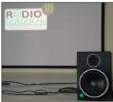
Le logo de la Webradio sur un écran, lors de la conférence de presse

Deux musiciens vézacois ont lancé une Webradio dans le cadre associatif