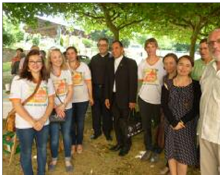
Un moment de dialogue sous les ombrages de Capelou