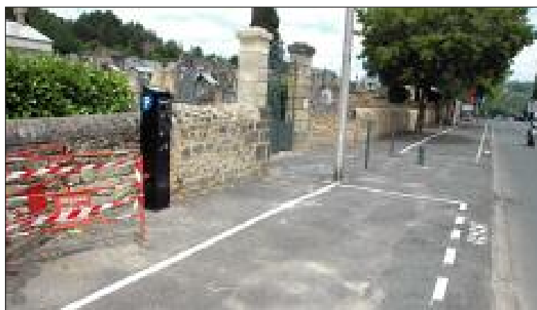
L'horodateur et la signalisation au sol récemment installés devant le cimetière

Le 24 avril, les élus sarladais ont approuvé en conseil municipal une délibération sur les tarifs de stationnement. Une zone payante comprenant l'avenue du Général-de-Gaulle, la place du 19-Mars-1962 et la place Sundhouse a été décidée. Du 1 er juillet au 31 août, de 9 h à 12 h et de 14 h à 19 h (sauf dimanches et jours fériés), stationner à cet endroit vaudra 2 € pour quatre heures et 3 € pour huit. Il y a quelques jours, la signalisation a été apposée au sol et les horodateurs ont été installés.