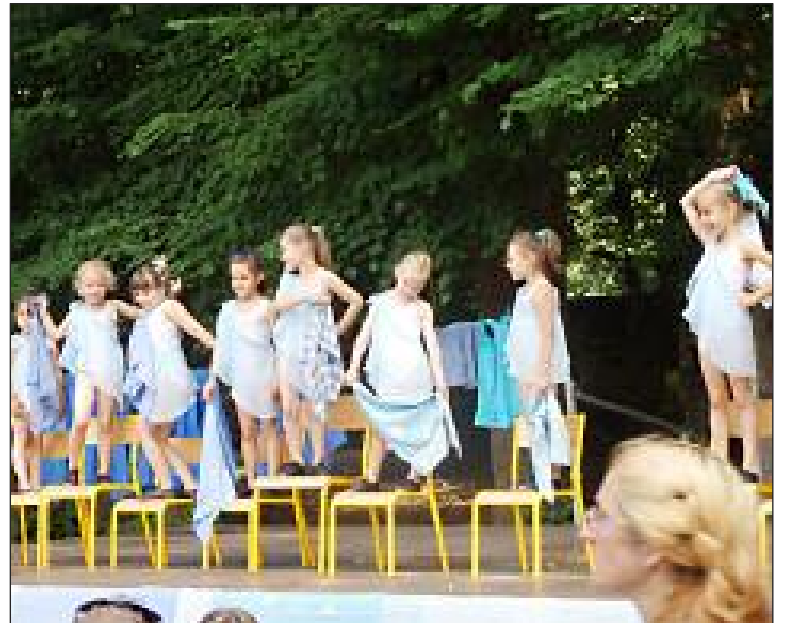
Lors du spectacle de danse avec la prestation des plus jeunes