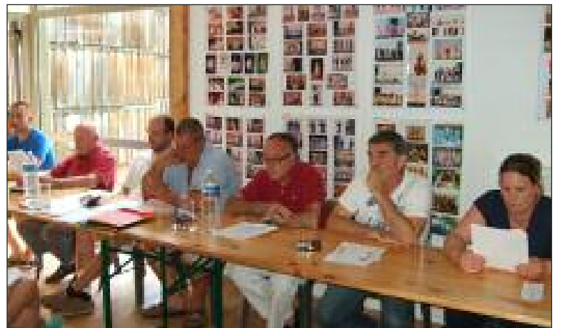
Elus et dirigeants à la tribune lors de l'assemblée générale