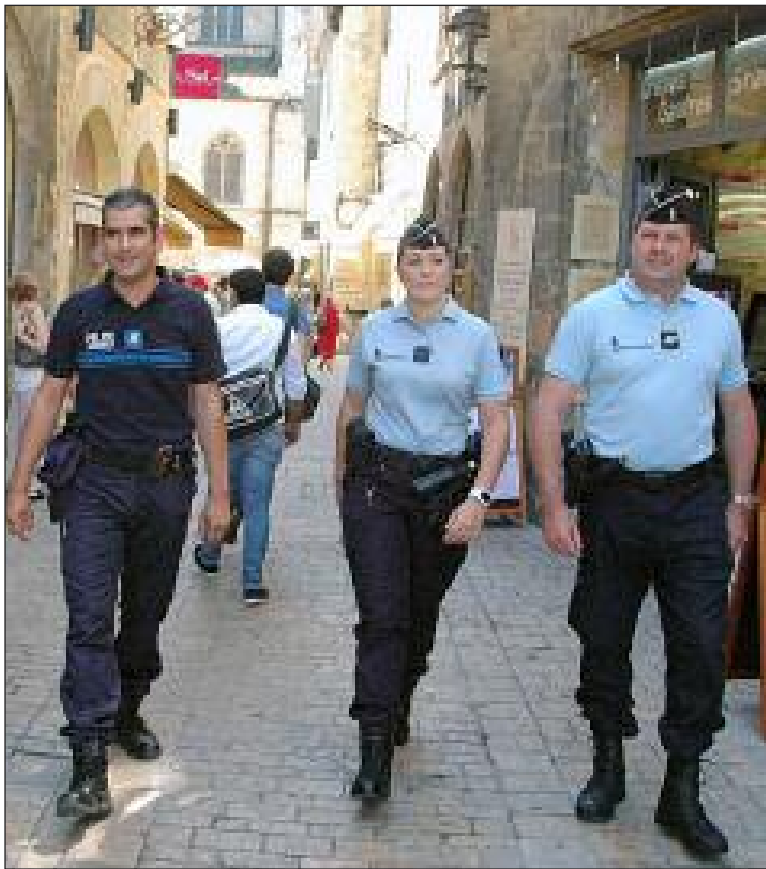
Service en commun dans la rue de la Liberté : un agent municipal aux côtés de deux gendarmes

Une convention a été signée entre la mairie de Sarlat-La Canéda et la préfecture