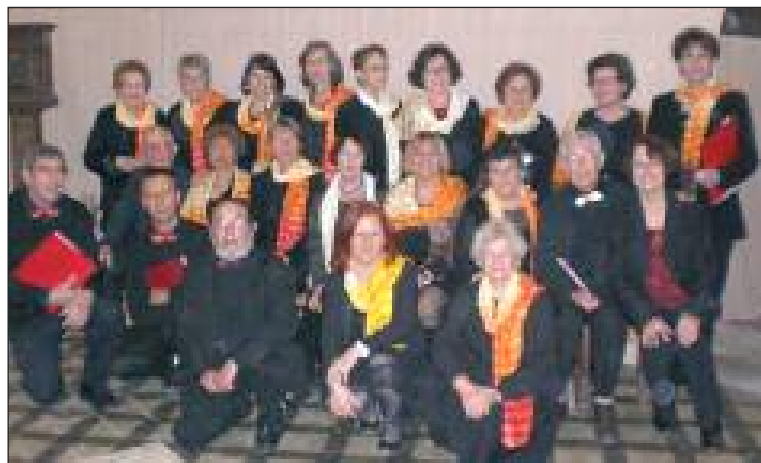
L'Ensemble vocal lors d'un récent concert