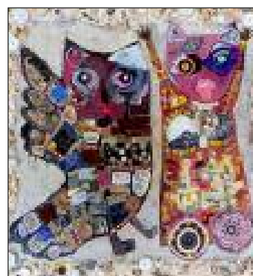
"Les Charivaris. Le temps s'est démonté, qui le remontera ?" Acrylique et techniques mixtes