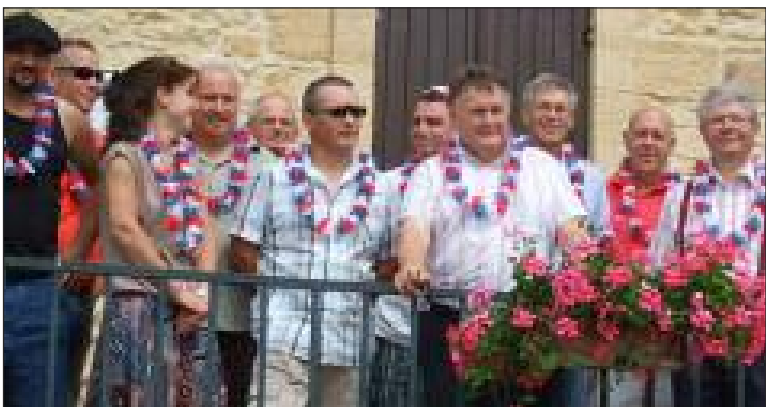
Le conseil municipal