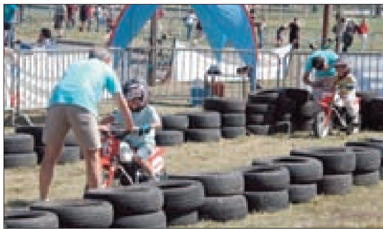
Sur l'atelier du Moto-club sarladais