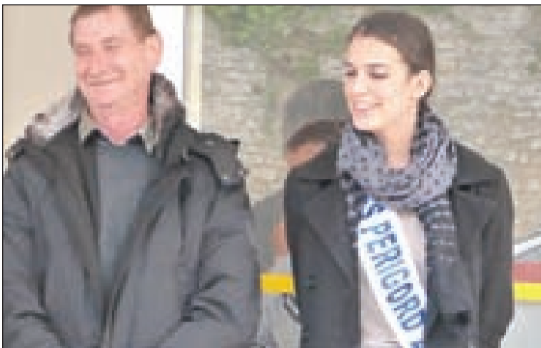
Le président Sinico est très attentif à la participation des féminines