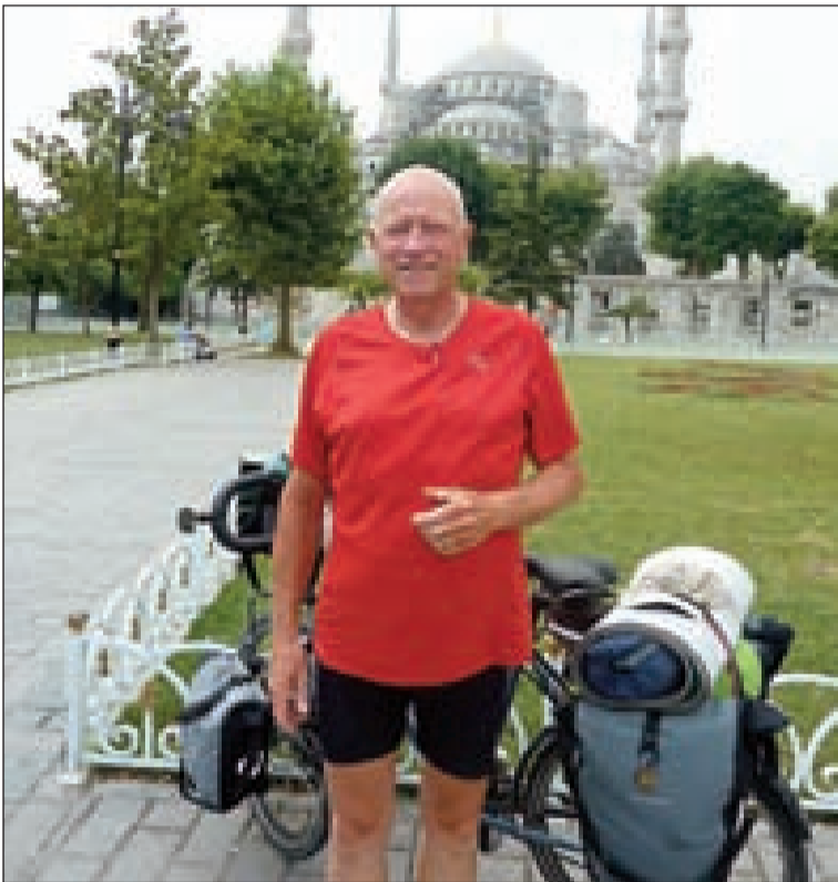
L'arrivée devant la mosquée Sainte-Sophie