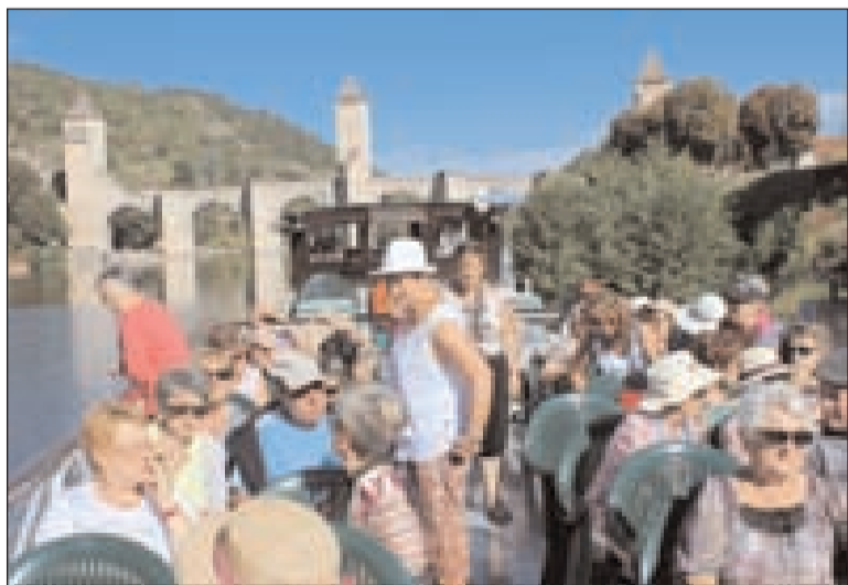
Les Périgourdins sur le Lot

Dimanche 14 septembre, quarante-cinq Vinecossois, dont le premier magistrat, ont répondu à l'invitation de l'association Les Amis de Saint-Vincent-de-Cosse pour une balade sur la rivière Lot, entre Cahors et le village de Vers, suivie de la visite de Saint-Cirq-Lapopie. Aux environs de 11 h, toute cette joyeuse assemblée a embarqué sur le bateau Fénelon quai Valentré pour une promenade dans la vallée du Lot, au fil de l'eau et des écluses. Les commentaires avertis du guide sur les monuments aperçus ou entraperçus, la géologie et la géographie des sites, la vie d'avant autour de la rivière étaient d'un grand intérêt. Après un repas pris à bord et apprécié de tous, la croisière s'est poursuivie dans le cadre reposant et