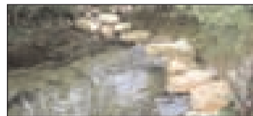
Barre "tuffeuse" sur le Céou

Pêche électrique de sauvegarde. Malgré un été pluvieux, le Céou connaît un assèchement de son cours d'eau. Les fortes chaleurs enregistrées ces derniers jours en sont sans nul doute la cause. Habituellement ce type de phénomène se situe plus tôt dans l'année, vers fin juin.