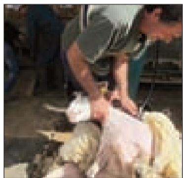
Un tondeur de moutons au travail

suivi d'une salade verte, d'un cabécou et fromage de chèvre (faisselle) avec des fruits de saison. Tout provient de la production locale. La participation est fixée à 15 € (un verre de vin et café compris) ; 12 € pour les enfants. Réservez votre place le plus rapidement possible.