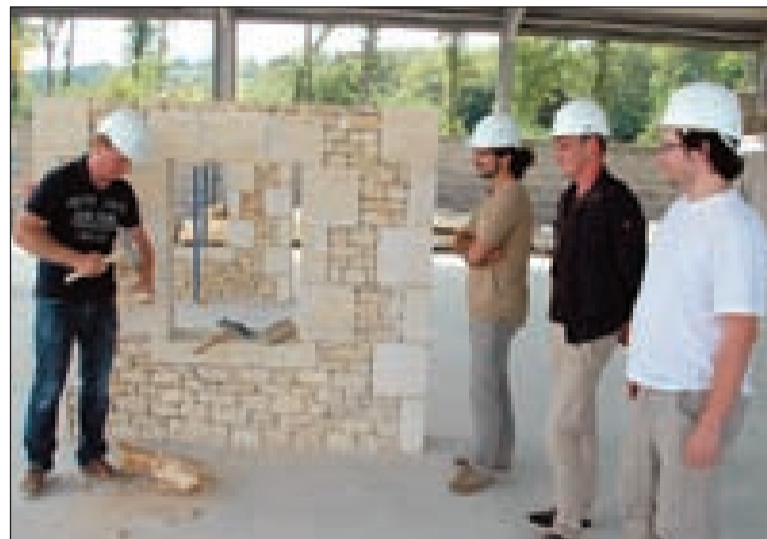
Une formation encadrée et validée par des professionnels

Au final, le cursus permettra de valider trois modules : 1) exécuter des travaux de maçonnerie en pierre dans le bâti ancien, 2) réaliser des ouvrages coffrés, 3) réaliser des enduits et des dallages. Sera proposée en plus une sensibilisation à