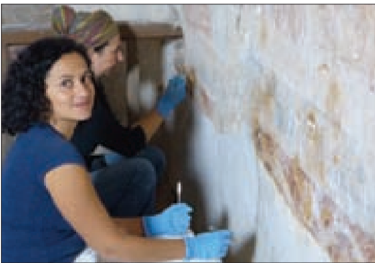
L'occasion de se rendre compte des travaux de restauration à l'église